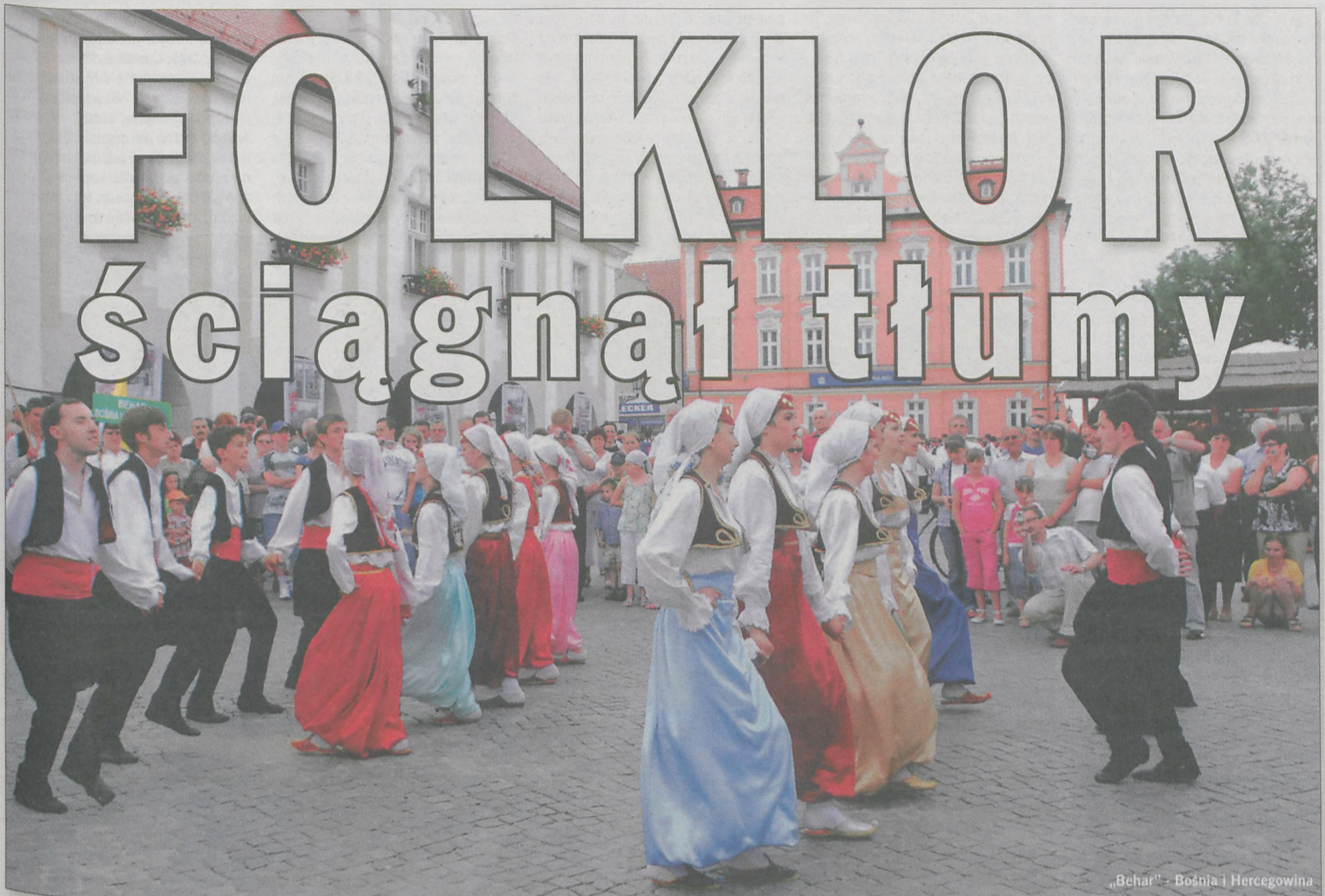
„Behar” - Bośnia i Hercegowina

Trzydzieści zespołów z sześciu państw uczestniczyło w XII Międzynarodowych Spotkaniach Folklorystycznych Jarocin 2009. Dla Turków Cypryjskich oraz zespołu „Behar” z Bośni i Hercegowiny był to pierwszy kontakt z naszym miastem. Piękna pogoda i brak innych imprez sprawiły, że w niedzielne popołudnie w jarocińskim amfiteatrze pojawiły się setki widzów. Publiczności bardzo podobał się żywiotyowy program zespołu „Hasder” z Cypru. Swoich wielbicieli miały także grupy lokalne: „Snutki”, „Ciświczanie”, „Potarzyczanki”, „Dąbrowianki”, „Golinia-cy” i „Noskowiacy”.