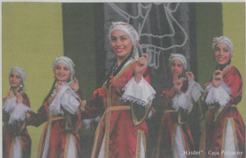
„Hasder” - Cypr Północny