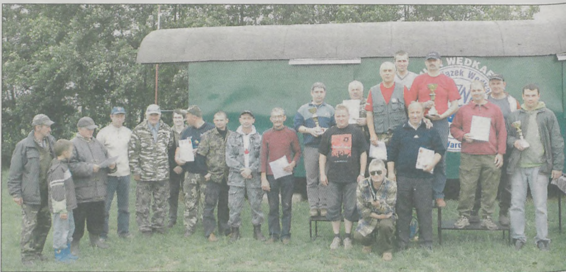
Uczestnicy zmagania wędkarskiego

■ Powiatowe zawody sportowo-pożarnicze w Wysogotówku