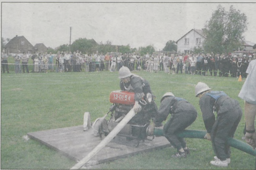
Drugą z konkurencji było ćwiczenie bojowe

Drużyny jednostki OSP Ludwinów okazały się bezkonkurencyjne na powiatowych zawodach sportowo-pożarniczych. Trzykrotnie uplasowa-