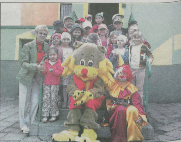
Przedszkolaków odwiedzili klaun i... tygrysek