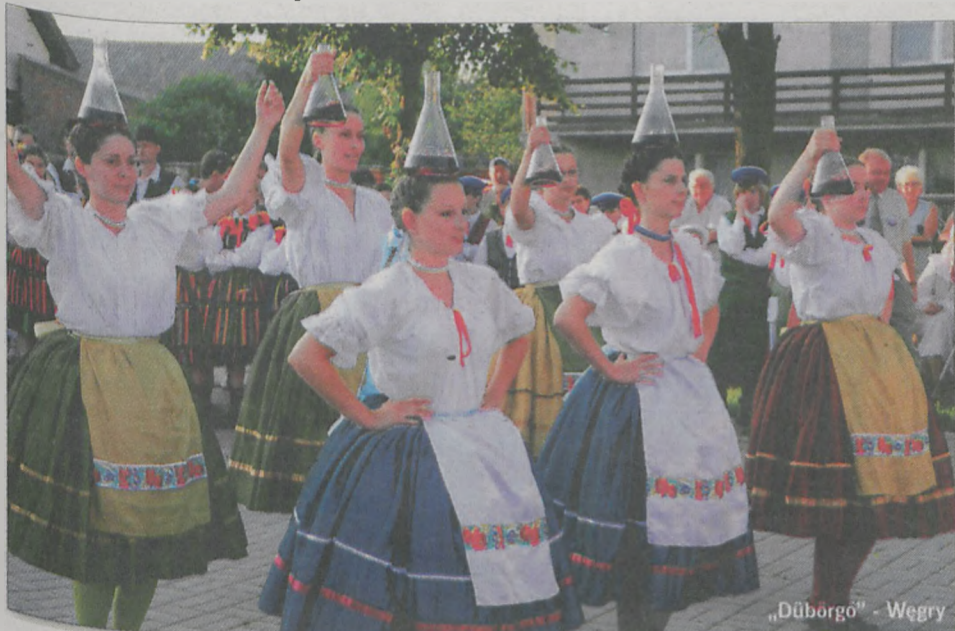
„Dübörgö” - Węgry