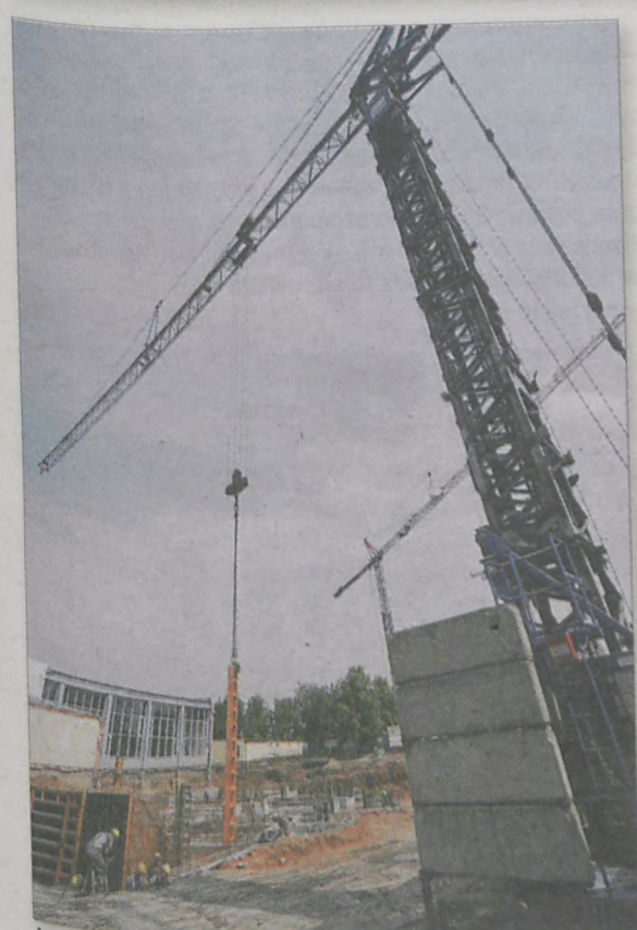
Żeby obsłużyć plac budowy, potrzebne są dwa żurawie