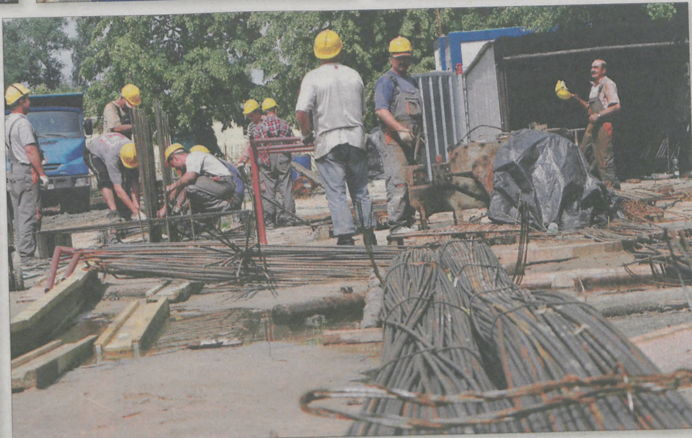
Codziennie zużywa się tony stali