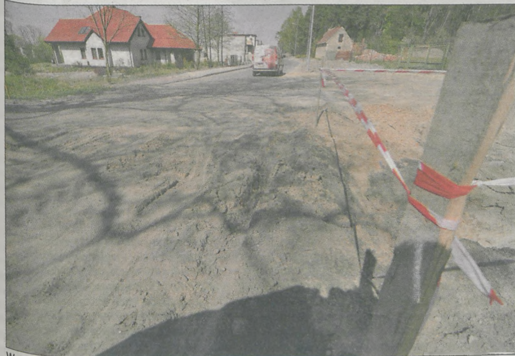
W poniedziałek upłynął termin wykonania przez Strabag pierwszego odcinka drogi Bachorzew - Wilkowyja. Drugi wybuduje firma DroBud

Dróg Lokalnych autorstwa wicepremiera Grzegorza Schetyny. W projekcie partnerem gminy jest powiat, który zaoferował 160 tys. zł. Resztę dołoży miasto z własnego budżetu.