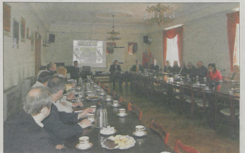
W minionym tygodniu przeszkoleni zostali softysy z gminy Jarocin