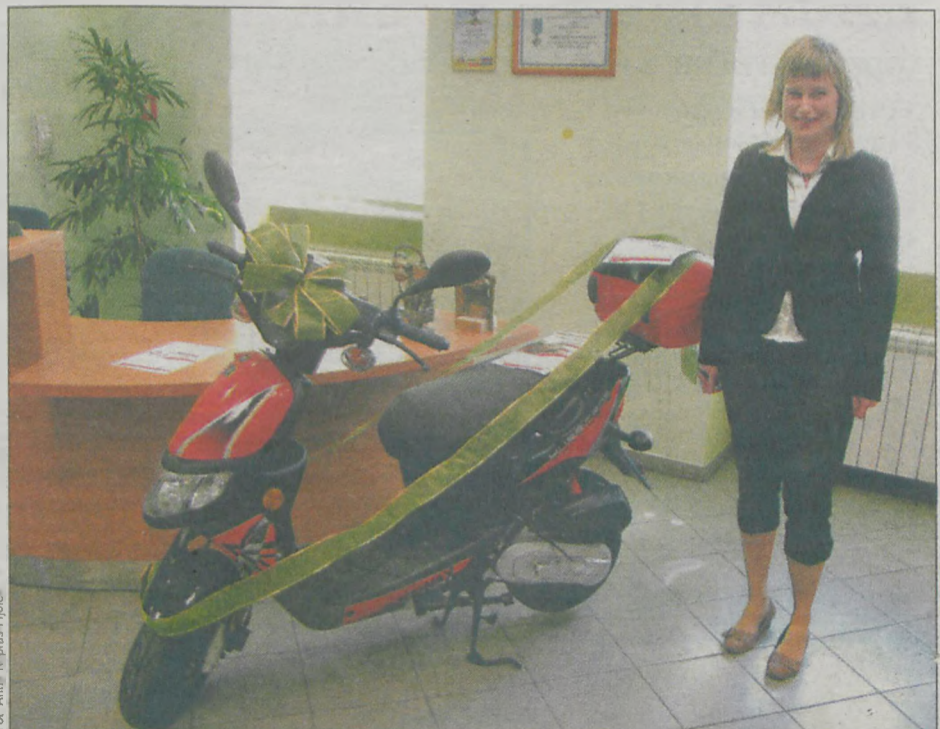
Skuter - to jedna z nagród czekających na klientów Banku Spółdzielczego