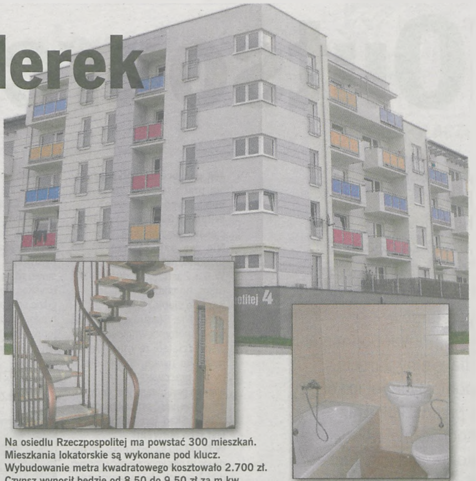
Na osiedlu Rzeczpospolitej ma powstać 300 mieszkań. Mieszkania lokatorskie są wykonane pod klucz. Wybudowanie metra kwadratowego kosztowało 2.700 zł. Czysznz wynosił będzie od 8,50 do 9,50 zł za m kw.

*„Rodzina na swoim” to rządowy program mający na celu wsparcie rodzin w pozyskaniu własnego lokum. Program umożliwia korzystanie z dopłat do kredytów hipotecznych na zakup mieszkania lub budowę domu.