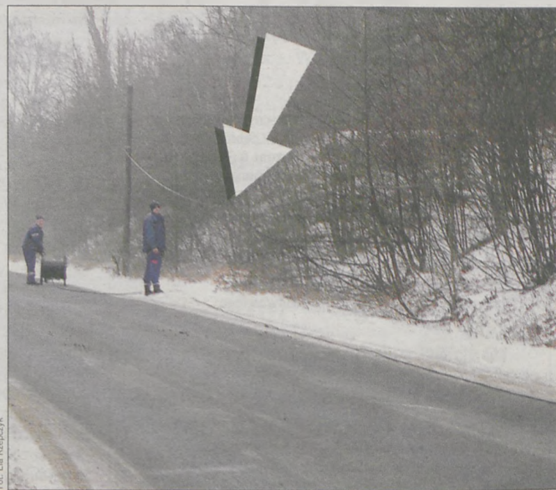
Po interwencji „Gazety”, awarię sunięto w ciągu kilku godzin