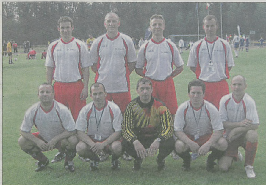
Zwycięska drużyna jarocińskich policjantów

karskich z Polski, Niemiec, Węgier, Ukrainy i Włoch. Nasi policjanci w finałowym meczu zremisowali ze stróżami prawa z Gdańska. Zwycięstwo jarocińskim funkcjonariuszem przyniosły rzuty karne - 3:2. (era)