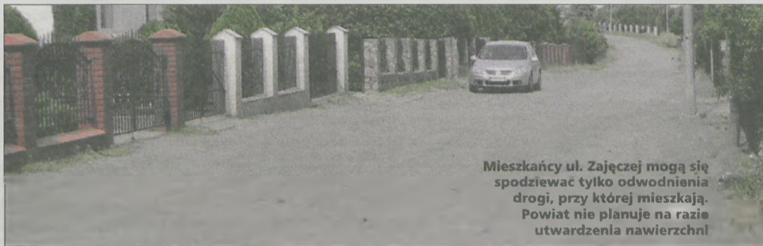
Mieszkańcy ul. Zajęczej mogą się spodziewać tylko odwodnienia drogi, przy której mieszkają. Powiat nie planuje na razie utwardzenia nawierzchni

- Projekt odwodnienia ulicy Zajęczej w Jarocinie przygotowuje w tym roku powiat jarociński - tak zapowiada starosta Mikołaj Szymczak. Zanim to jednak nastąpi, trzeba przeprowadzić uzgodnienia z właścicielami działek, przez które to odwodnienie zostanie przeprowadzone. - My oprócz ulicy nie mamy tam swojego gruntu. Wszystkie działki wzdłuż ulicy są w rękach prywatnych. Nie możemy też uciec z tym zadaniem do Annapola, na ul. Żerkow-