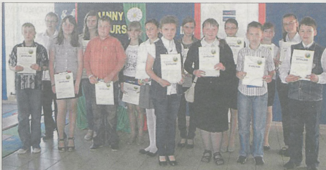
Uczniowie z dwunastu podstawówek zmagali się z pułapkami ortograficznymi