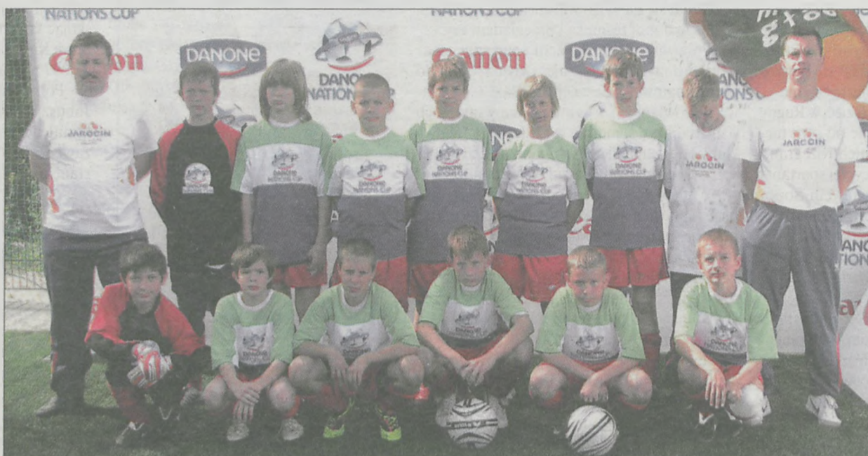
Piłkarze ze Szkoły Podstawowej nr 5 wywalczyli trzecie miejsce w Polsce do lat 12

Drużyna ze Szkoły Podstawowej nr 5 z Jarocina, w której występują piłkarze Jaroty Jarocin, zajęła trzecie miejsce w turnieju Danone Cup 2011, czyli nieoficjalnych mistrzostwach Polski do lat 12. Podopieczni Sławomira Udzika okazali się czarnym koniem finałowych rozgrywek. Po nieudanym początku w dalszej części grali znakomicie i wywalczyli brązowy medal. Najlepszym bramkarzem turnieju został Dawid Rzepczyński z SP 5 Jarocin.