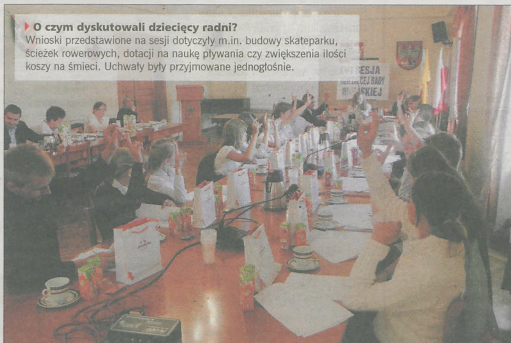
Dziecięca Rada Miejska składa się z 22 uczniów szkół podstawowych i gimnazjów z gminy Jarocin