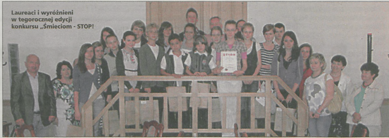
Laureaci i wyróżnieni w tegorocznej edycji konkursu „Śmieciom - STOP!”