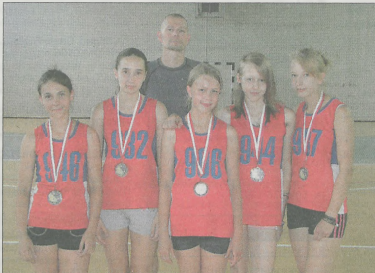
Dziewczeta ze Szkoły Podstawowej nr 5 w Jarocinie zajęły drugie miejsce w Mistrzostwach Wielkopolski w Czwórboju Lekkoatletycznym