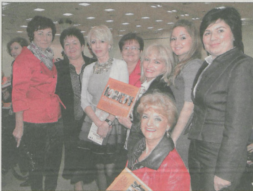
W konferencji wzięły udział również jarocinianki

Dress for Success to największa na świecie organizacja pomagająca kobietom bezrobotnym poszukującym pracy. Do tej pory pomogła 500 tys. kobiet na całym świecie. Kobiety, które pracują i osiągnęły sukces, wspierają te, które sobie nie radzą. Zapraszamy panie, które są już umówione na rozmowę kwalifikacyjną, pomagamy jej dobrać fryzurę, pomagamy wykonać profesjonalny, biznesowy makijaż, dobieramy strój, dajemy także wsparcie psychologiczne.