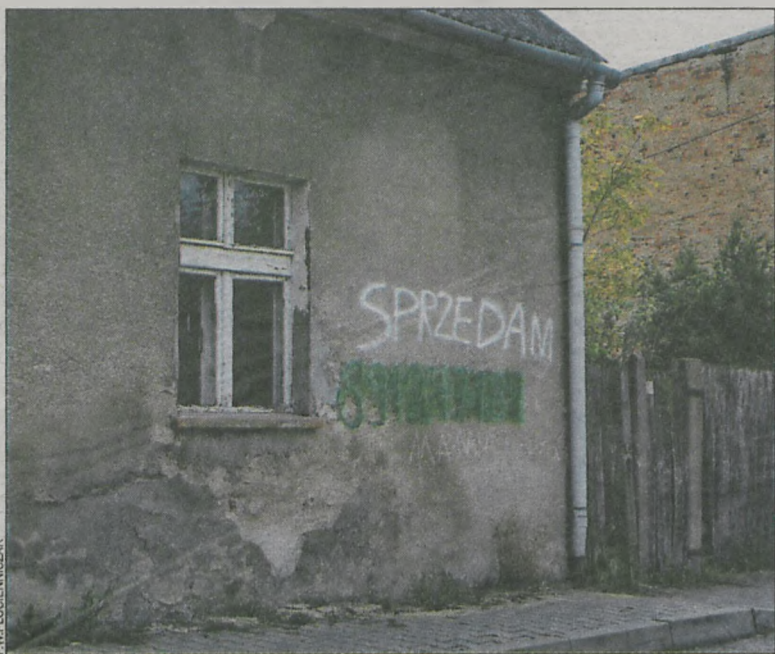
Są jednak i takie domy, które trudno sprzedać