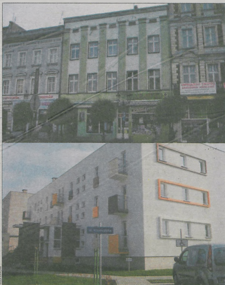
Wielu, kupując własne mieszkanie, rozważa lokum w kamienicy albo w bloku

Może się też wydawać, że koszty związane z ogrzewaniem będą dotkli-