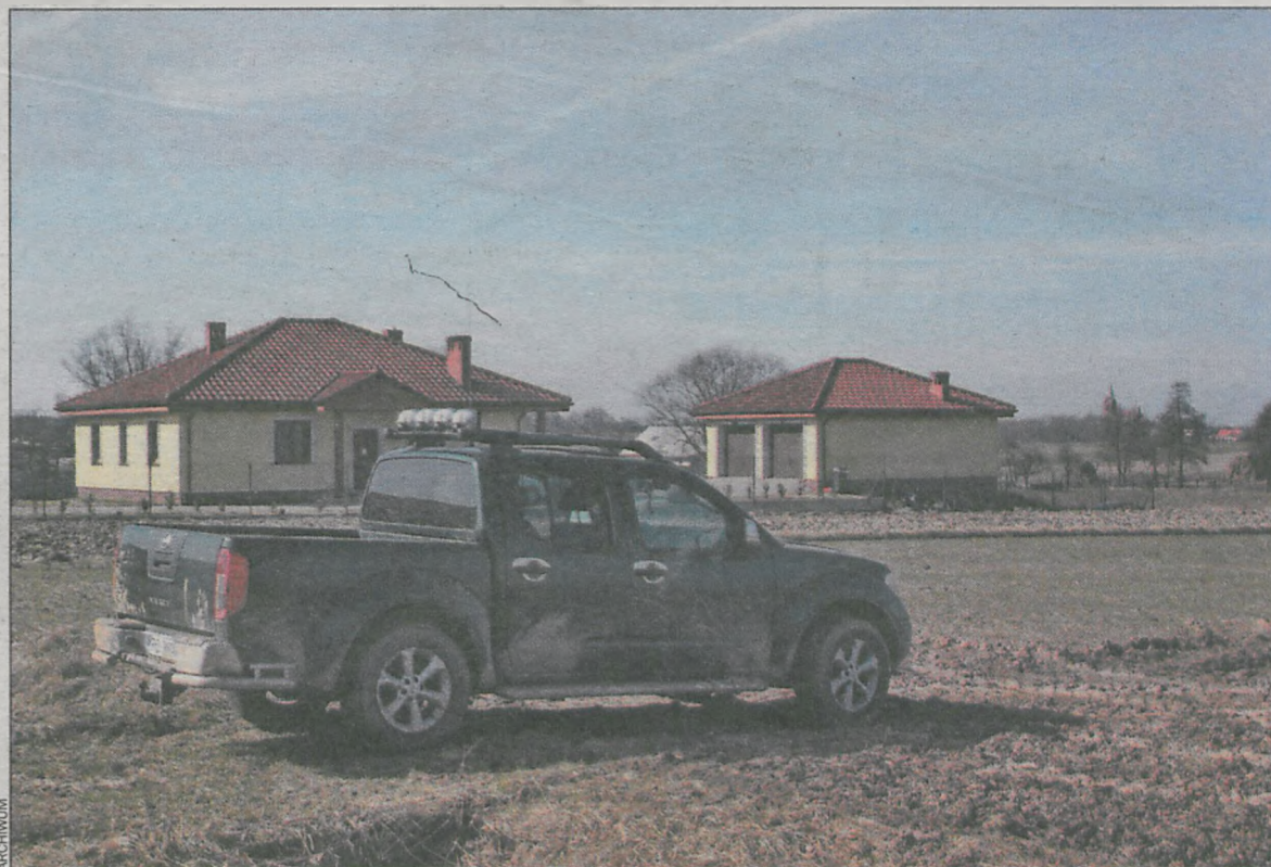
Sporo domów powstaje na peryferiach Krotoszyna oraz w okolicznych wsiach; Chachalni, Konarzewie czy Tomnicach

Kolejny krok to obejrzenie miejscowego planu zagospodarowania przestrzennego, który odpowie nam na pytanie, czy w miejscu, które wybraлиśmy, możemy wybudować dom jednorodzinny, a jeśli tak, to jakie powinny być jego wymiary. Wyjaśni również wiele wątpliwości dotyczących zagospodarowania terenów sąsiednich oraz planowanych inwestycji drogowych i gospodarczych. Nad tą sprawą trzeba się pochylić szczególnie uważnie, aby ustrzec się nie miłych niespodzianek. Może się bowiem zdarzyć, że w przyszłości za naszym plotem powstanie obwodnica.