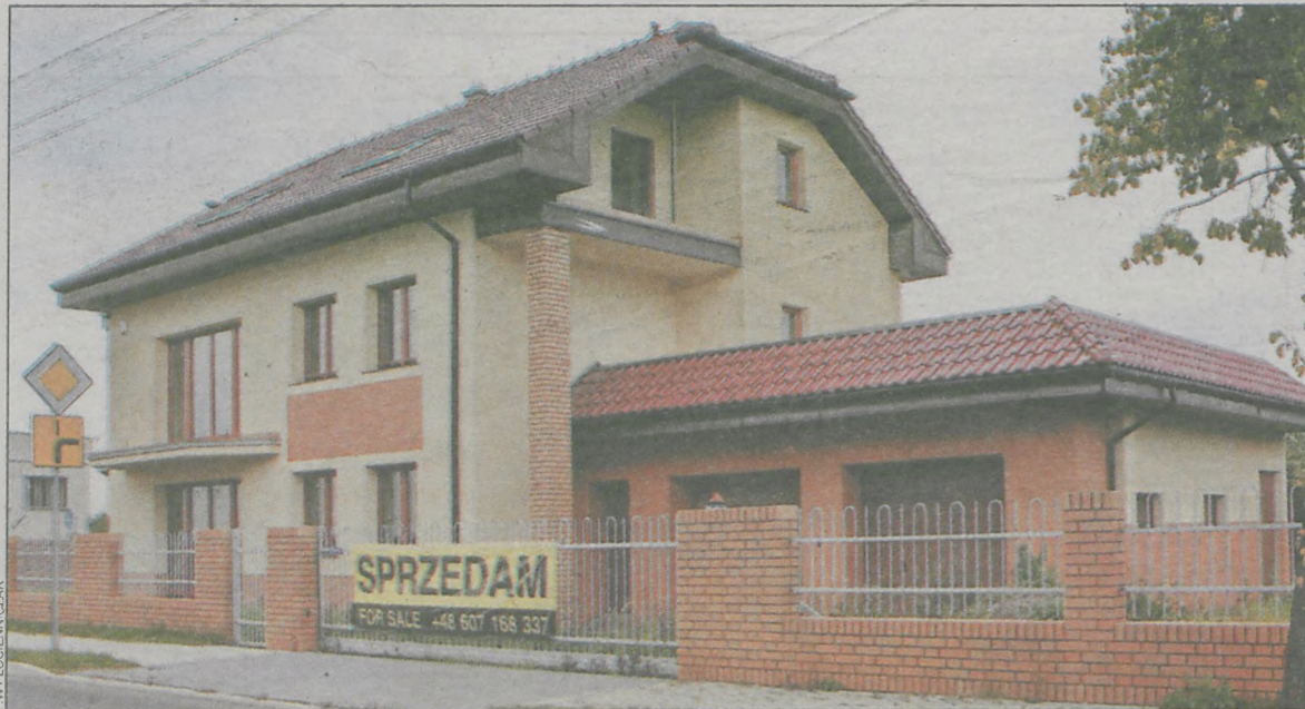
W powiecie nie brakuje atrakcyjnych nieruchomości