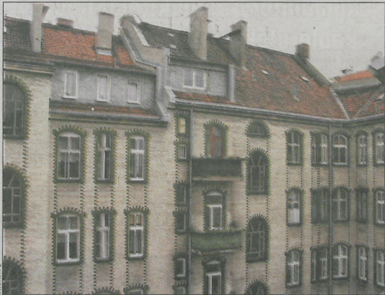
Remont kamienicy można przyspieszyć dzięki dopłacie

Właściciele kamienic mogą korzystać z nowelizacji ustawy o wspieraniu termomodernizacji i remontów, która znosi bariery, które do tej pory uniemożliwiały im staranie się o dopłatę do remontów.