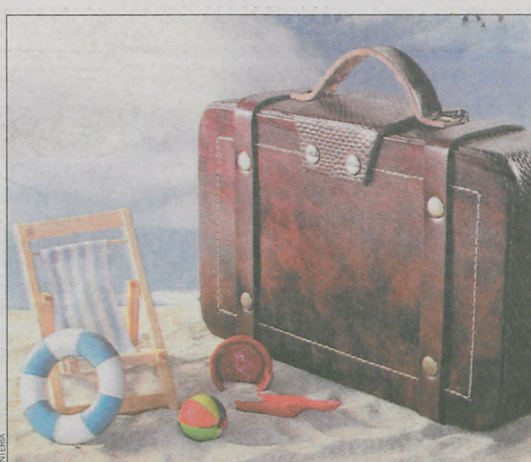
Przed wyjazdem warto załatwić polisę mieszkaniową

Ogólne Warunki Ubezpieczenia (OWU) to istotny dokument, który dokładnie określa nie tylko jego zakres, ale także warunki wypłaty odszkodowania. – Należy zwrócić uwagę na obecność takich określeń, jak franszyza integralna oraz redukcyjna. W ten sposób właściciel lokalu uniknie rozczarowania, gdy dojdzie do przykrego zdarzenia – informuje A. Prajsnar. Akceptując franszyzę, ubezpieczający zobowiązuje się bowiem do pokrycia części wydatków z własnej kieszeni. W przy-