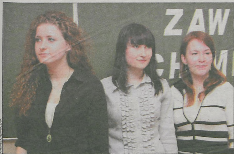
Uczestniczki konkursu przed testem