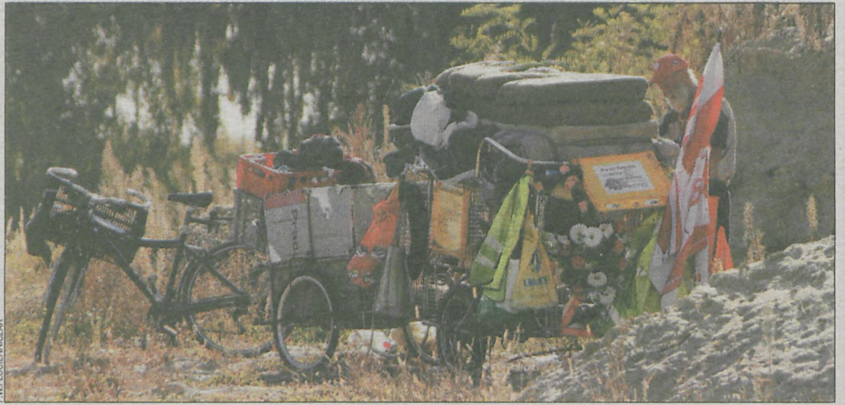
Wózki razem z bagażem ważą około 350 kilogramów

Każdego dnia podróżnik przemierza rowerem 20 do 30 kilometrów. – Nigdzie mi się nie spieszy. Utrzymuję spokojne, równe tempo jazdy, podziwiam sobie widoki, rozmawiam z napotkanymi ludźmi – mówi. Pod wieczór rozbija obozowisko. Zazwyczaj w cichych, spokojnych miejscach. – Obozuję tam, gdzie mnie nie widzą. W lasach, zwrotniach, z daleka od ruchliwych dróg. Raz tylko mieszkańcy pewnej wioski stwarzali problemy, gdy rozłożyłem się obok kościoła. Kiedy jednak wytłumaczyłem im, co robię i kim jestem, zostawili mnie w spokoju – opowiada. Zapytany, czym żywi się podczas podróży, odpowiada, że w dużej mierze pomagają mu rodacy: – Ja nie muszę wiele jeść, nie jest to więc wielki problem. Bardzo często życzliwi ludzie, których spotykam, coś tam pomogą. A zimą, kiedy jestem w domu, wywożę złom. Tak oszczędzam pieniądze na następną podróż.