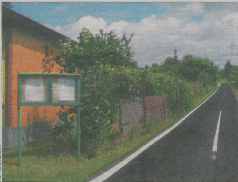
Aby dostać odszkodowanie, trzeba było złożyć wniosek w wymaganym terminie