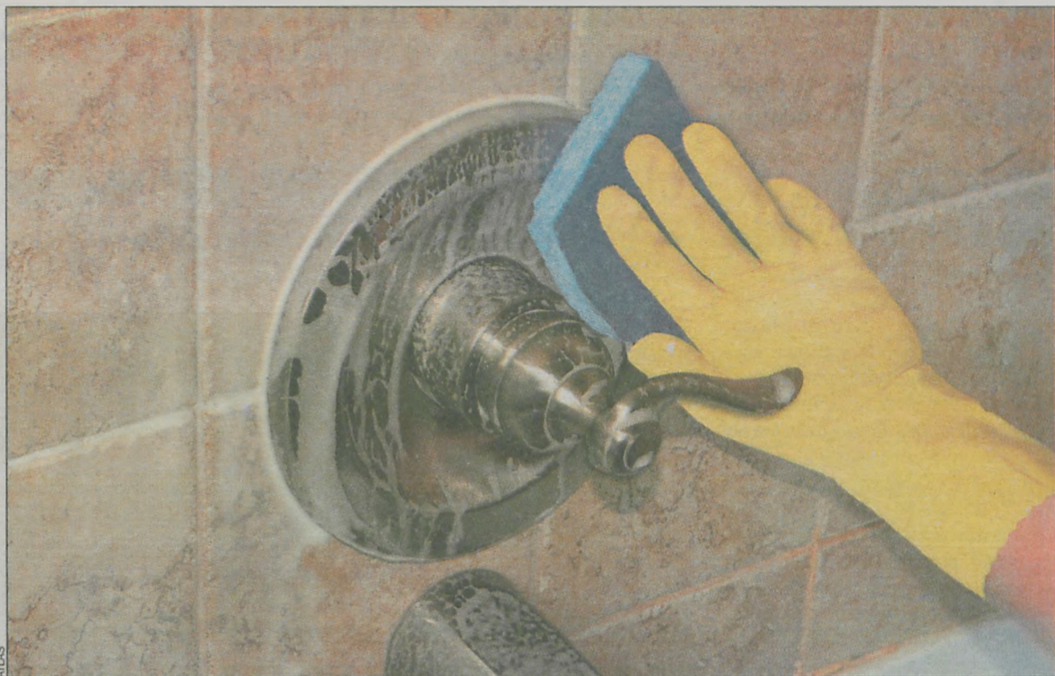
Do czyszczenia powierzchni z płytek ceramicznych najlepiej użyć szczotki lub gąbki

OFERUJEMY SZEROKI ZAKRES ASORTYMENTU ELEKTROTECHNICZNEGO