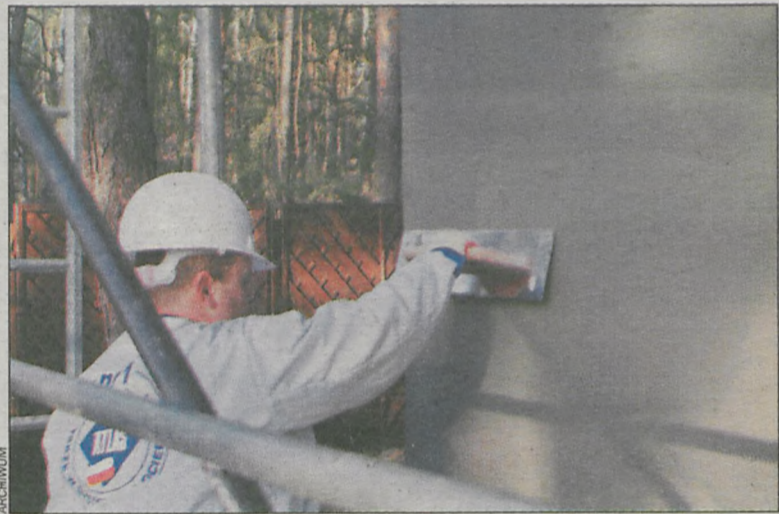
Tak zabezpieczona elewacja wytrzyma na pewno do wiosny