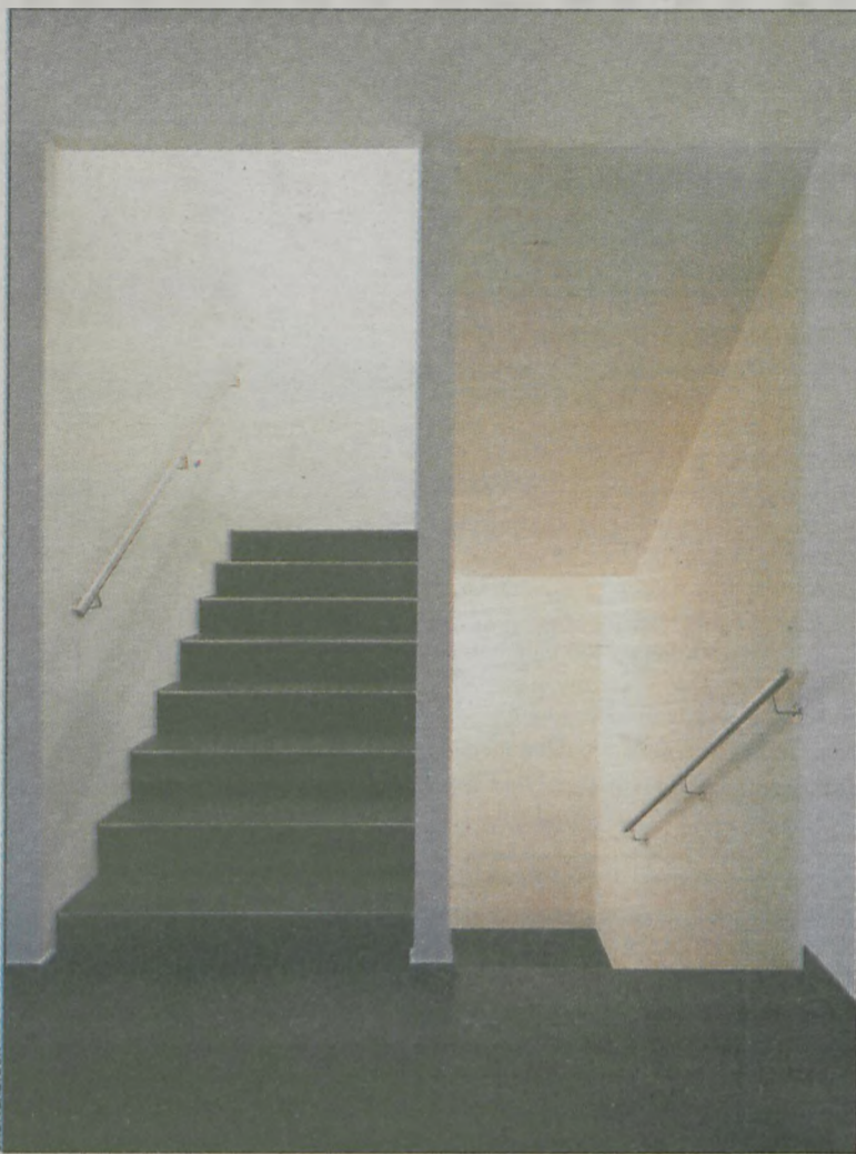
Płytki gresowe świetnie nadają się na posadzkę

Do wypełnienia spoin między płytkami posłużyć może fuga. Lekki ruch pieszego po okładzinie jest już