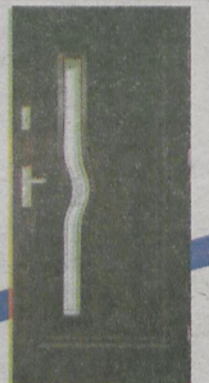
Grand -22 + wyposażenie