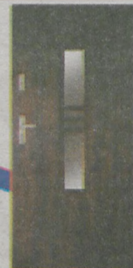
Grand -24 + wyposażenie