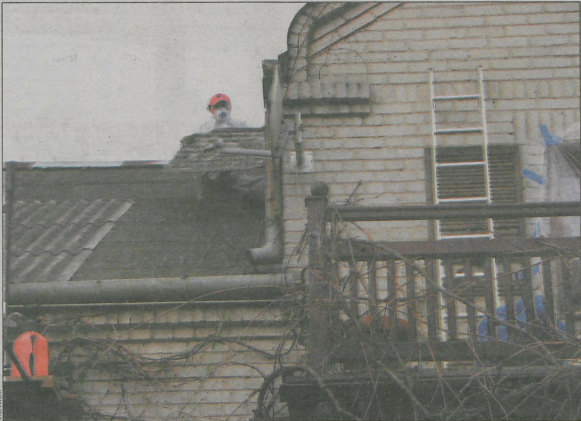
Przy usuwaniu azbestu trzeba pracować w specjalnych maskach, kombinezonach i rękawicach

jest spore. Kwota jest mała, wyczerpaliśmy ją już dawno. Gdy ktoś złoży dziś wniosek, otrzyma wsparcie finansowe za około dwóch lat – informuje pracownica wydziału gospodarki komunalnej i ochrony środowiska magistratu. Trzeba wypełnić formularz, który potwierdza