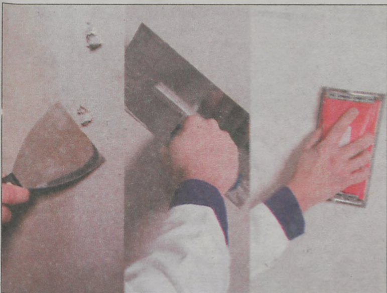
Uzupełnianie ubytków, rozprowadzanie gładzi, szlifowanie

Przed wszystkim konieczne będzie dokładne oczyszczenie okolic uszkodzenia. Posłuż do tego druciana szczotka oraz szpachelka. Druciana