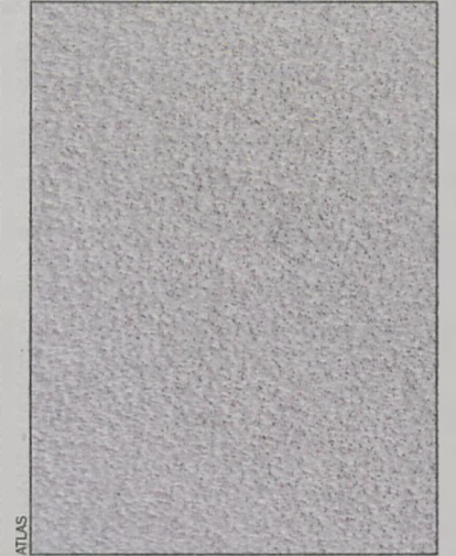
Struktura tynku Atlas Cermit MN

osłabić przyczepność tynku i zagruntowane podkładową masą tynkarską. Zwiększa to przyczepność oraz pozwala na uzyskanie równej powierzchni podkładu. Przygotowanie tynku polega na wymieszaniu suchej mieszanki z odpowiednią ilością wody, zgodnie z instrukcją podaną na opakowaniu. Czynność tę należy wykonać wyłącznie urządzeniem z mieszadłem wstęgowym. Użycie innego mieszadła może skutkować powstaniem „kluch” i zatorów w dyszy agregatu.