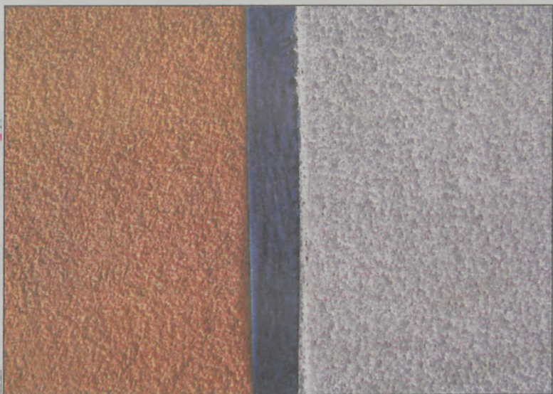
Tynk wykonany metodą tradycyjną (po lewej) i natryskową

przyspiesza dwukrotnie wykonanie tynku. Skraca to czas pracy firmy wykonawczej, co w konsekwencji wpływa na niższe koszty inwestora. Maszynowe narzucanie tynku zmniejsza też jego zużycie. Natryskowa technologia jest wygodna, gdyż pozwala na przerwanie pracy w dowolnym momencie, bez konieczności, jak w metodzie ręcznej, dojścia na przykład do narożnika budynku. Sposób aplikacji ułatwia także tynkowanie miejsc trudnych, takich jak na przykład gzymsy.