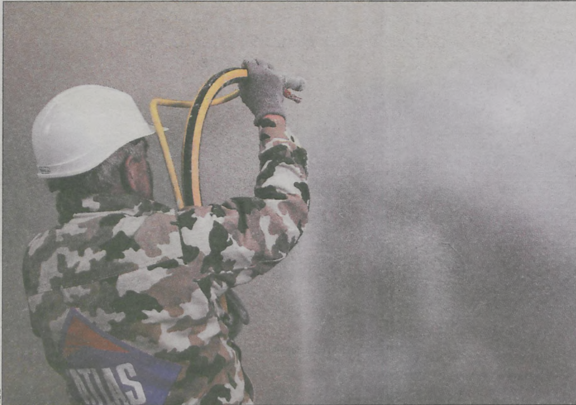
Tynkowanie metodą natryskową skraca czas pracy, jest wydajne i ekonomiczne

Natryskowe nakładanie tynków cienkowarstwowych ma wiele zalet. Przede wszystkim, użycie agregatu