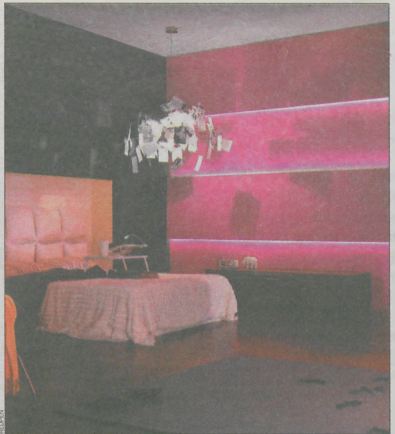
„Wiatr przyszłości” charakteryzuje się olbrzymią energią kolorów i lekkością wiatru