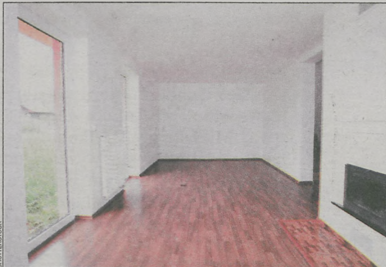
Do samego malowania najlepiej przystąpić w dobę po zakończeniu prac gipsowych

szczotką oczyścić można powierzchnię ze starych powłok, szpachelka natomiast przyda się do usunięcia większych chropowatości oraz poszerzenia