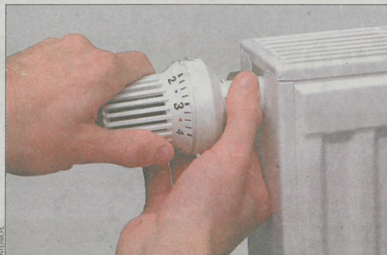
Za grzejnikami można montować ekrany z folii aluminiowej, które odbijają ciepło w stronę mieszkania

Wysokość osiągniętych oszczędności zastosowanych w naszym domu zależy od wielu czynników, m.in. od materiałów, z których budynek jest wykonany, stanu instalacji c.o., roku oddania do użytku oraz wielkości budynku czy stanu wentylacji. – Dlatego właśnie każdą termomodernizację powinien poprzedzać szczegółowy audyt energetyczny tak, aby realizowana modernizacja była rozwiązaniem optymalnym dla