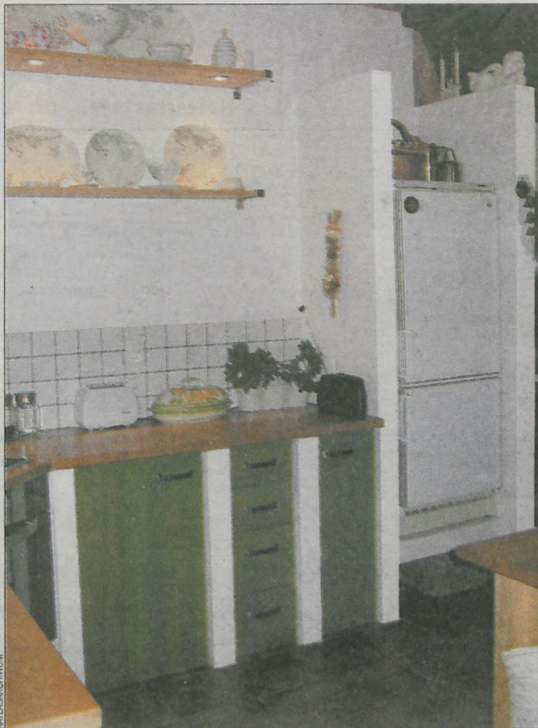
W murowanej kuchni sprytnie wkomponowana została lodówka

Krotoszyn, ul. Mickiewicza 1, tel. 62 722 07 24 Krotoszyn, ul. Zdunowska 99, tel. 62 722 65 01