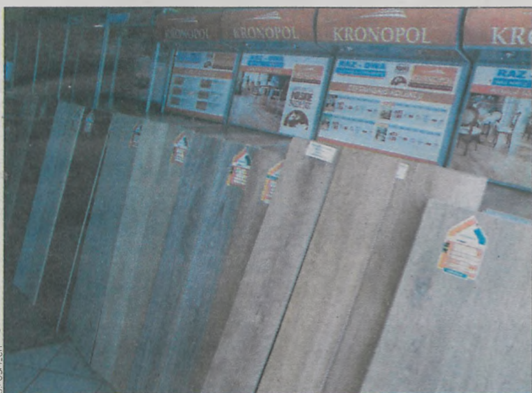
Klienci mają duży wybór paneli podłogowych