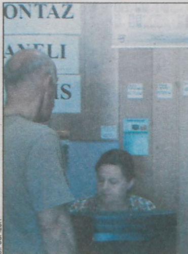
Tutaj czeka miła i profesjonalna obsługa

W sklepach tej sieci handlowej można liczyć na fachową obsługę i doradztwo przy wyborze towaru oraz na atrakcyjne ceny i szeroki asortyment. Dużym atutem jest darmowy montaż paneli. – Wyszkolona przez producentów ekipa monterska zajmu-