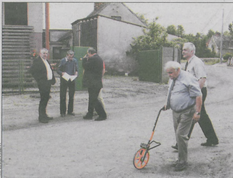
W tym roku za 171 tys. zł wykonane zostanie 183 m drogi