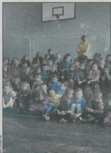
Sala wymaga gruntownego remontu

ul. Grzegorzewska I, Krotoszyn tel. 605 680 292, 695 148 145 biuro@klima-partner.pl | www.klima-partner.pl