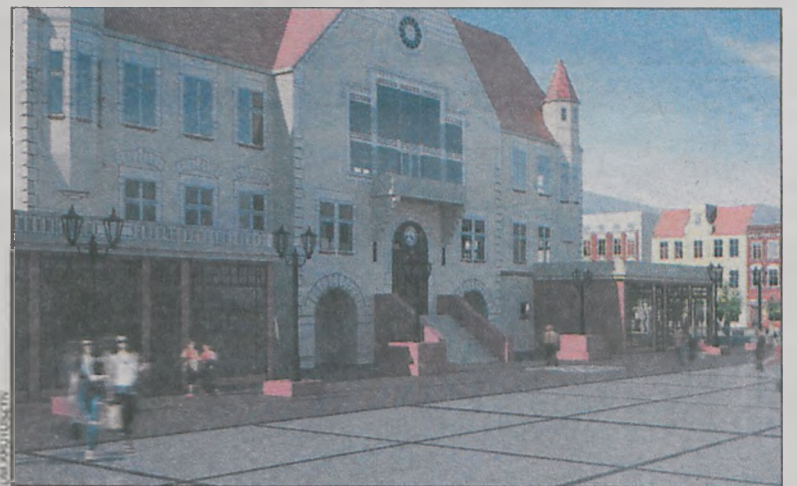
Tak w przyszłości ma prezentować się krotoszyński rynek