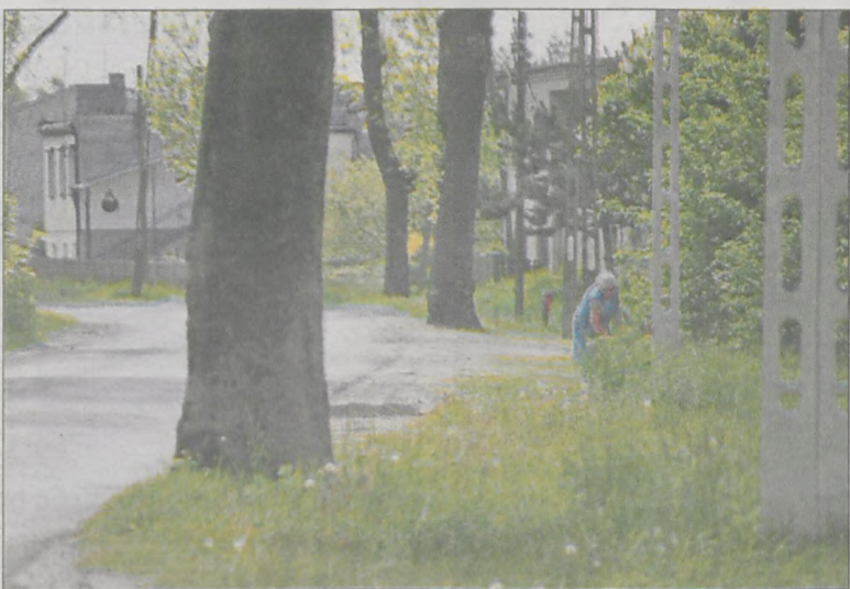
Chodnik w tym miejscu to dla mieszkańców kwestia priorytetowa

Mieszkańcom przyjdzie zatem czekać. Być może chodnik pojawi się na Baszkowskiej za rok. (szyn)