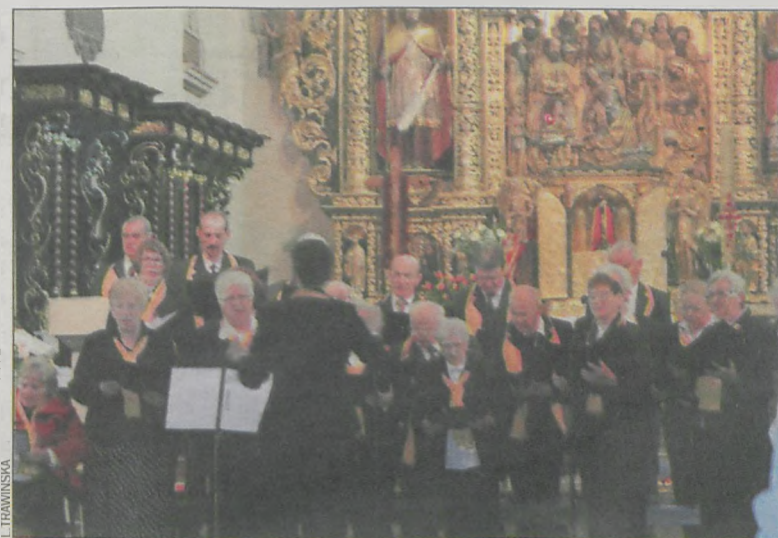
Przyjaciele wzruszyli swoim wykonaniem ulubionej pieśni JP II