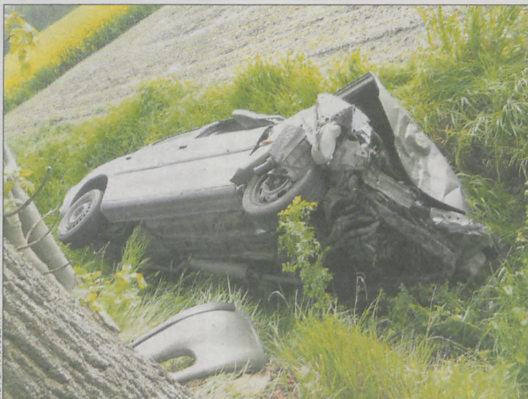
W aucie odłączono akumulator i zakręcono zawór instalacji gazowej

lekarz podjął decyzję o zabraniu ich do Szpitalnego Oddziału Ratunkowego na badania szczegółowe. – Dwóch pacjentów zostało zbadanych w SOR. Udzielono im pomocy ortopedycznej. Zostali wypisani do domów z zaleceniem kon-