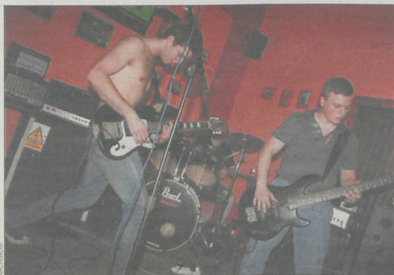
Formacja Nocebo rozgrzała publiczność do czerwoności