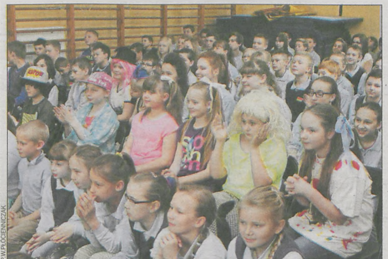
Młodzież zadbała, by tego dnia w szkole było naprawdę kolorowo