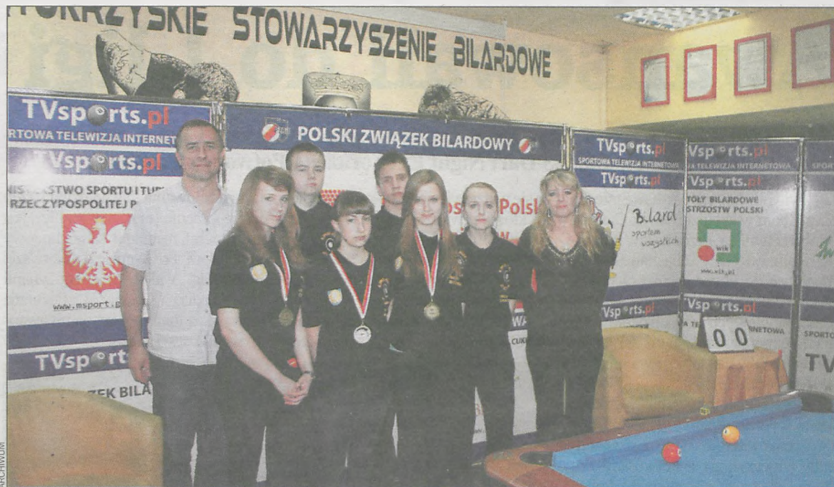
Ekipa zduńskiej Billi ma powody do radości