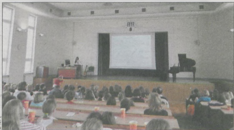
Uczelniana aula poznańskiego UAM zrobiła na wszystkich spore wrażenie

Grupa uczniów Szkoły Podstawowej nr 1 wybrała się do Poznania na Kolorowy Uniwersytet, tym razem na Wydział Studiów Edukacyjnych.