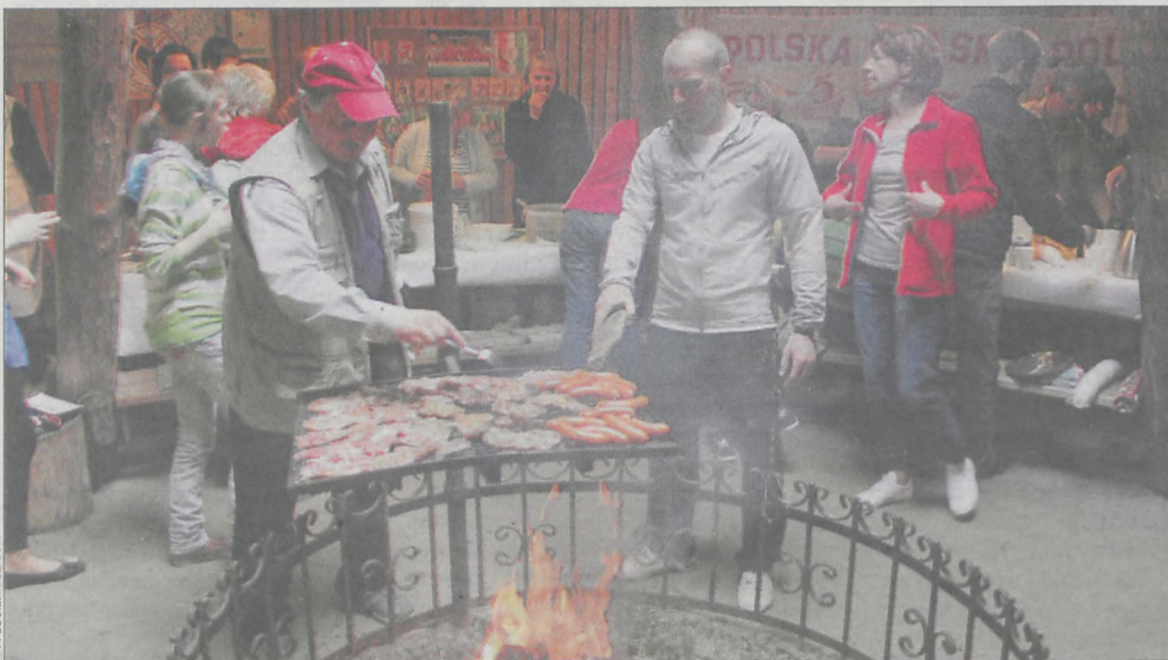
Podczas imprezy serwowano dania z grilla