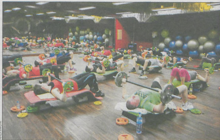
Zamiast grupowo ćwiczymy w parach

dlatego staramy się angażować w wiele akcji motywujących Polaków do ruchu i budowania dobrej formy. Jak wieemy, zarówno Chodakowska, jak i Lewandowska rozpoczęły w Polsce dotychczas nietypowy trend ćwiczeń z bli-