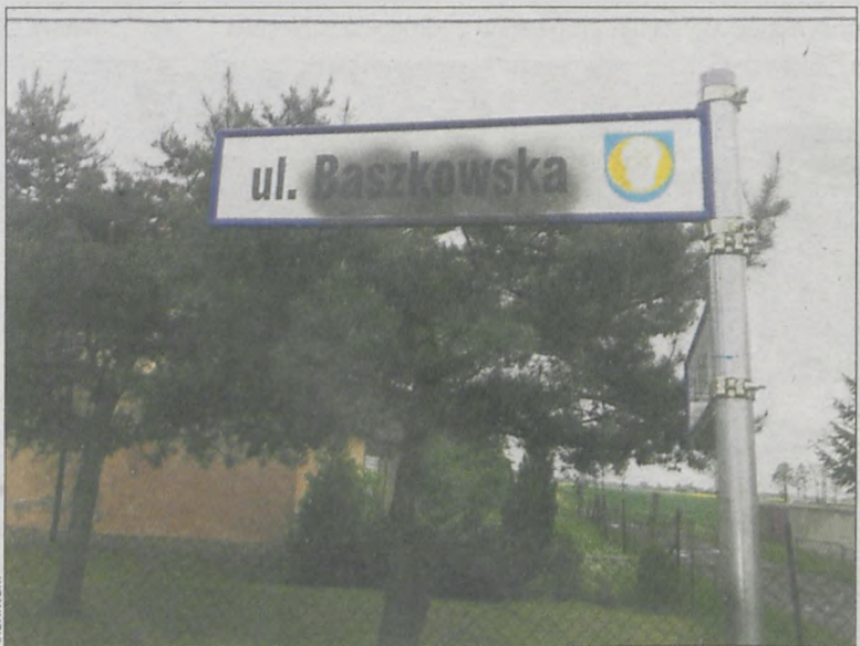
Zniszczona tabliczka w Konarzowie