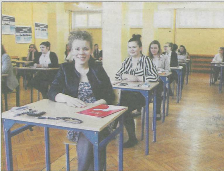
Za chwilę maturzyści z ceramą rozpoczną egzamin z matematyki