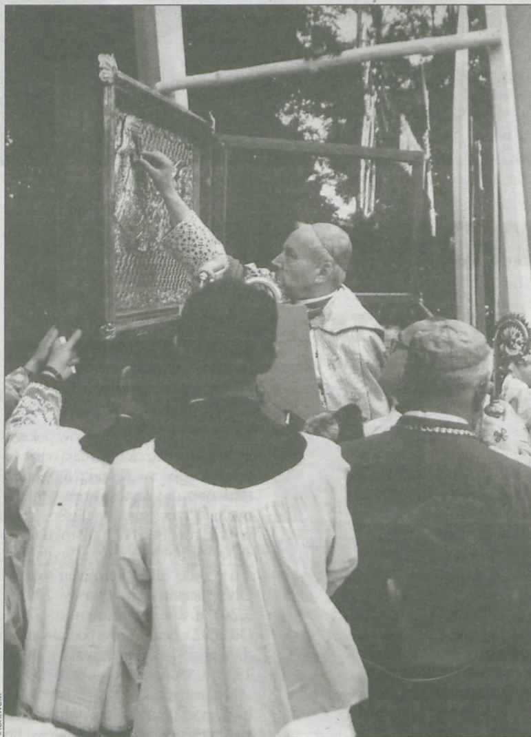
Kard. Stefan Wyszyński koronuje cudowny obraz Matki Boskiej Turskiej (1968)

Bóg obdarza łaskami przez wstawiennictwo Maryi, dlatego w Litanii loretańskiej nieustannie wołamy módl się