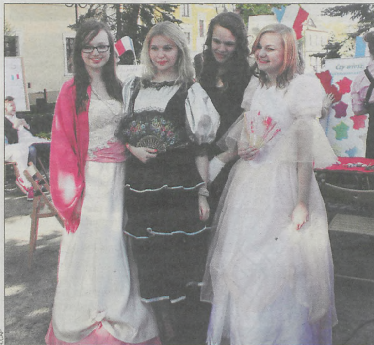
Tego dnia młodzież ubrana była bardzo kolorowo