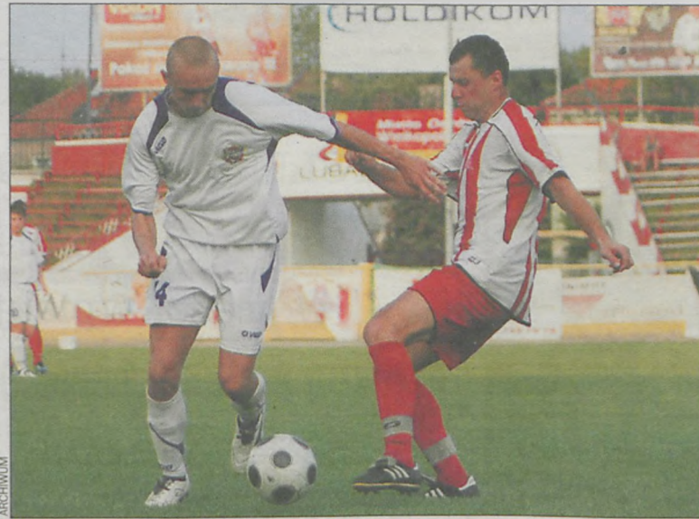
Ekipa Białego Orła pewnie zmierza do IV ligi