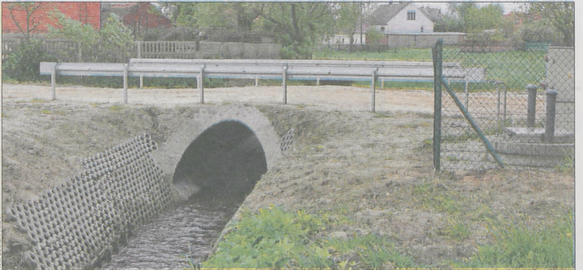
Przepust czeka na nową nawierzchnię

Zakończył się remont przepustu drogowego w Trzemesznie, który kosztował gminę 73 tys. zł. Na razie jednak ustawiono tam szlabany, które uniemożliwiają przejazd. Mieszkańcy wsi pytają, czy prace faktycznie już zakończono.