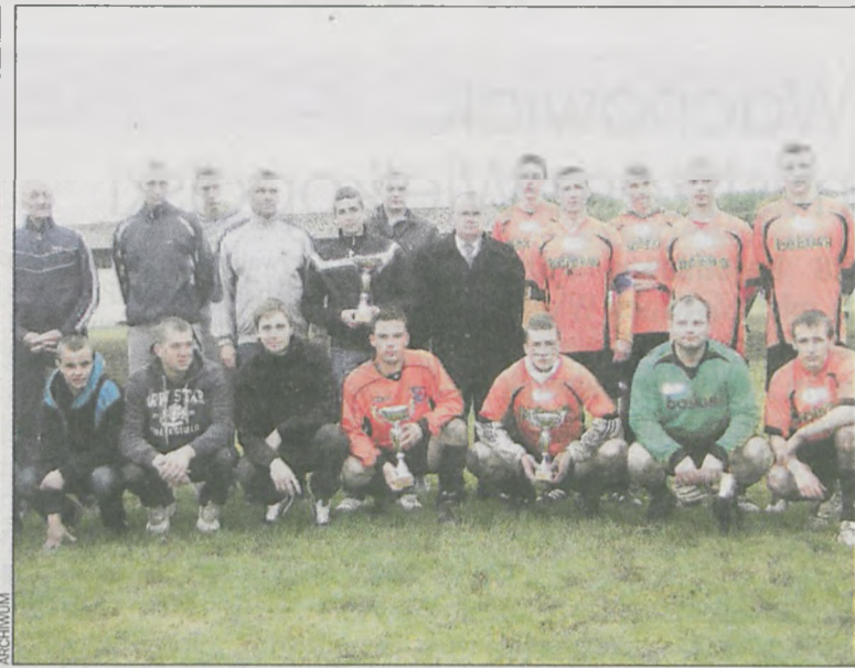
Zwycięski team z Kuklinowa