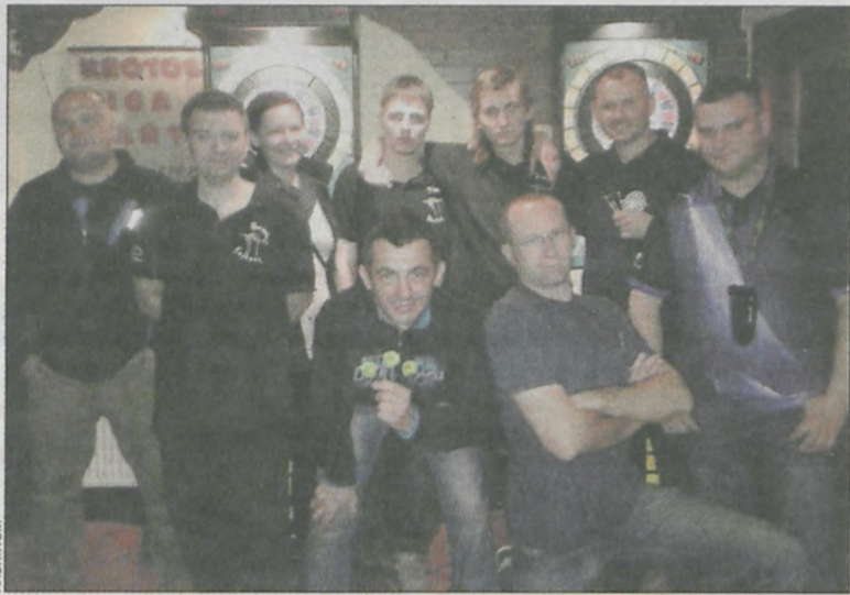
Ekipa Jar-Kro Strzecha Dart Team odniosła duży sukces sportowy

ją z zamiłowaniem. Na co dzień każdy z nich pracuje (trzech w Mahle), jest też fotograf, mechanik samochodowy i hydraulik. Po awansie do pierwszej ligi będą walczyć z drużynami z Gniezna, Konina i Poznania o pierwszą lokatę, która da im awans do mistrzostw Europy. (popi)