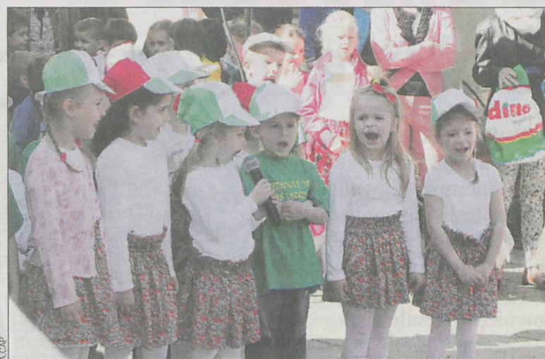
Wystąpiły dzieci z przedszkola Miś Uszatek

Na małej scenie – po oficjalnym otwarciu imprezy – ogłoszono wyniki konkursu rysunkowego dla przedszkolaków, a potem one same zaprezentowały krótkie scenki taneczno-wokalne inspirowane kulturą wybra-