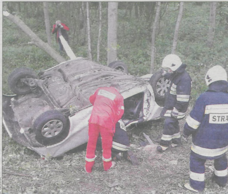
Kierująca straciła panowanie nad autem, wjechała do rowu i uderzyła w drzewo