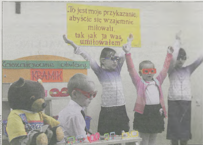
Dzieci jako aktorzy spisali się na medal

Na początku kwietnia w krotoszyńskim przedszkolu Słoneczko odbył się przegląd teatralny o tematyce religijnej, zorganizowany przez Zgromadzenie Sióstr św. Elżbiety.