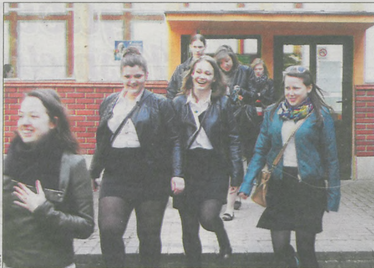
Po języku angielskim humory dopisywały