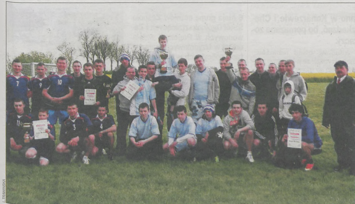
Mimo nieciekawej pogody chętnych do udziału w turnieju piłki nożnej nie brakowało

W zeszłym roku swój program satyryczny przedstawił Marcin Daniec