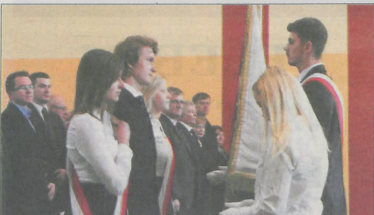
Absolwenci przekazują sztandar następcom z klas pierwszych

Są miejsca, czasy i ludzie, których się nie zapomina – takimi słowami rozpoczęła się 25 kwietnia w krotoszyńskim Zespole Szkół Ponadgimnazjalnych nr 2 uroczystość pożegnania tegorocznych absolwentów.