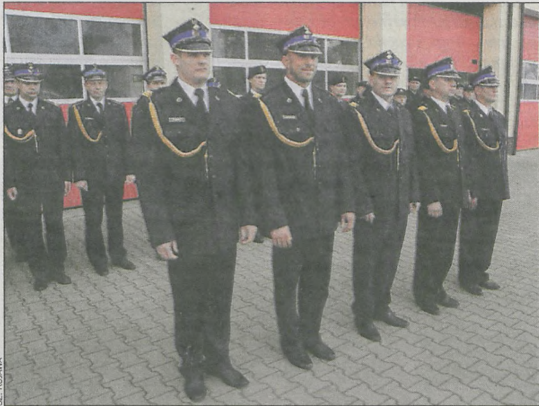
Ci strażacy otrzymali nominacje na wyższe stopnie