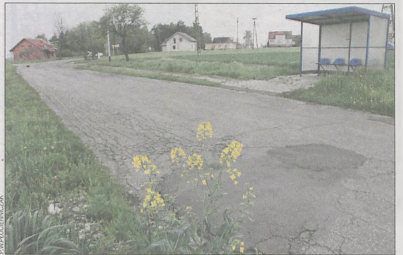
Teraz mieszkańcy są zmuszeni, by wysiadać przy rowie

O ile osoby chcące pojechać w stronę Krotoszyna wsiadają na przystanku, to wracające z tego miasta mają problem. – Wychodzą wprost na rów. Jakoś sobie radzą. Czasami kierowca sta-