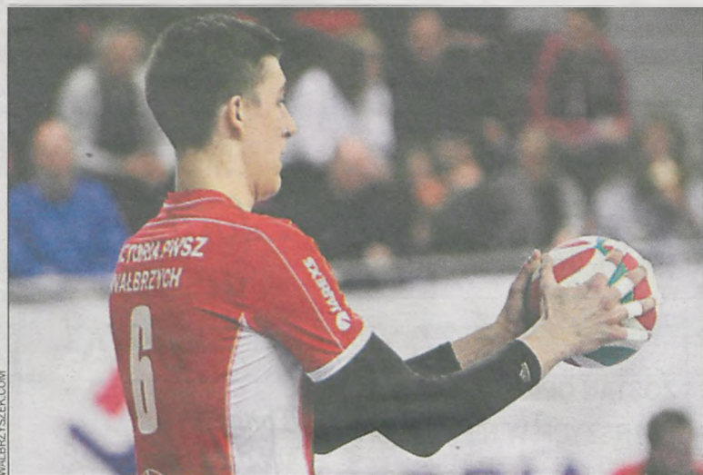
Jest jedynym zawodnikiem w kadrze na Ligę Europejską spoza klubów PlusLigi