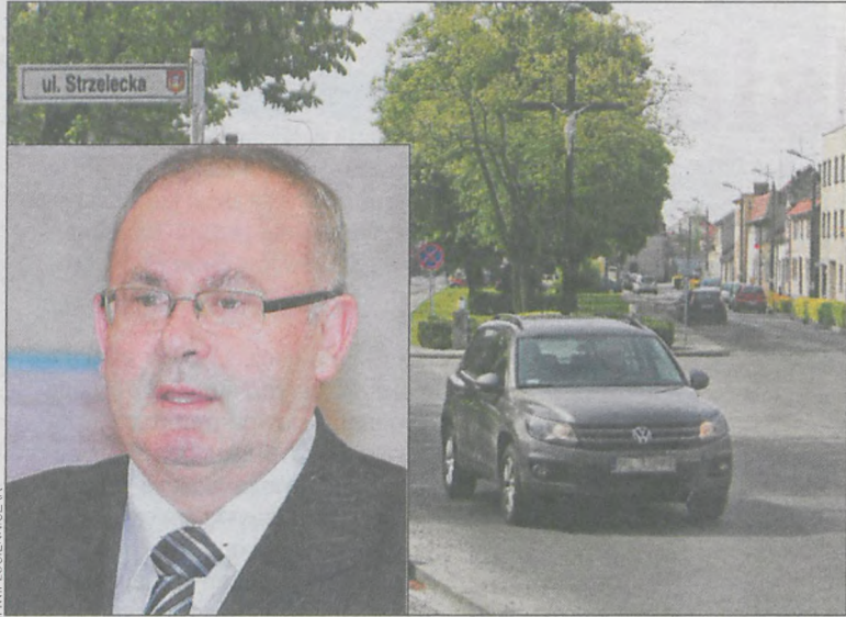
Na alei Powstańców zrobimy 18 miejsc parkingowych – mówi burmistrz

Gmina Kobylin zamierza zająć się przebudową alei Powstańców Wlkp. Na ten cel wstępnie zarezerwowano w budżecie kwotę 15 tys. zł.