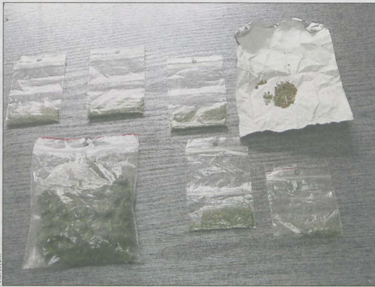
Policja nie wyklucza zatrzymań kolejnych osób zamieszanych w narkobiznes

i 22 lata) zatrzymani zostali na ul. Wiśniowej w Krotoszynie. Mieli przy sobie niewielkie ilości marihuany, bo część narkotyków udało im się wrzucić do pobliskiego stawu.