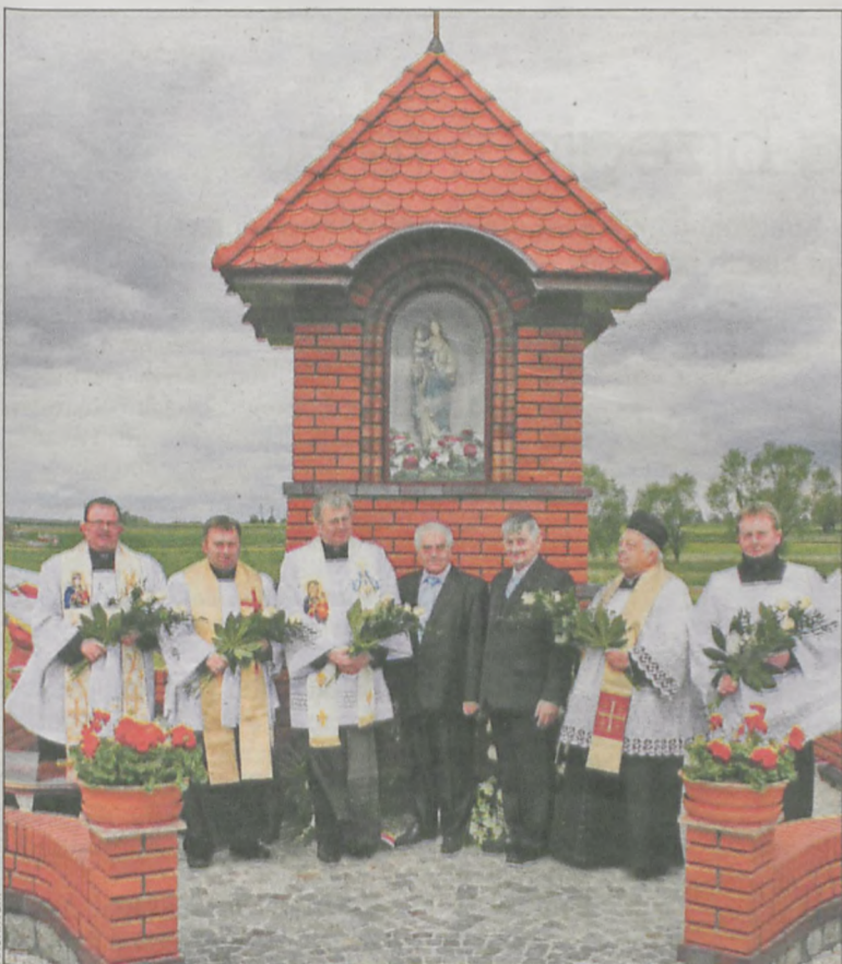
Odbudowana kapliczka prezentuje się bardzo okazale