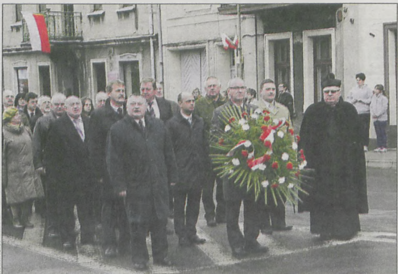
Przy dźwięku syren strażackich złożono kwiaty pod Pomnikiem Wolności

Mieszkańcy Koźmina i okolic tradycyjnie, wspólnie z władzami miasta i gminy, uczcili rocznicę uchwalenia Konstytucji 3 Maja. Obchody rozpoczęła uroczysta Msza św. w kościele św. Wawrzyńca odprawiona w intencji Ojczyzny.