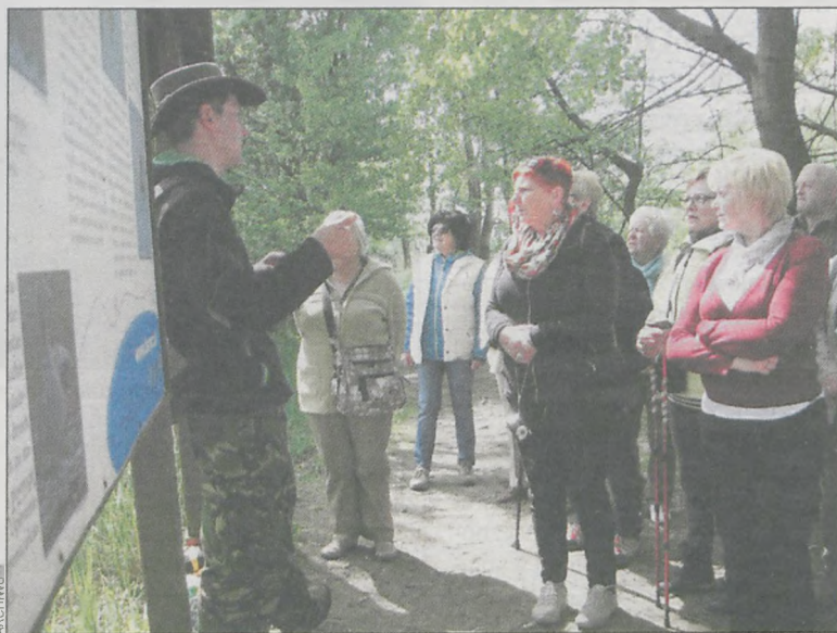
Uczestnicy wyjazdu w parku z XVIII w.