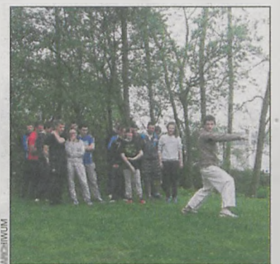
Młodzież z Pogorzeli podczas zajęć z samoobrony

Trzeciego dnia uczniowie dowiedzieli się, jak ważną rolę pełnią w policji psy i konie. Psy przechodzą specjalistyczne szkolenia, aby znajdować narkotyki czy zaginionych ludzi. Ko-