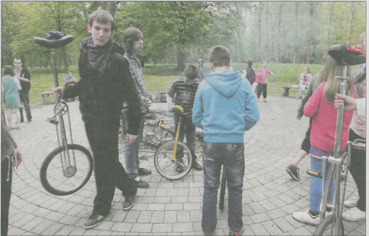
Młodzież z Polski i z Niemiec podczas wspólnych zajęć

W dniach 22-26 kwietnia w Specjalnym Ośrodku Szkolno-Wychowawczym odbyły się warsztaty cyrkowe z udziałem tamtejszej młodzieży oraz wychowanków zaprzyjaźnionej placówki z Mannheim w Niemczech.