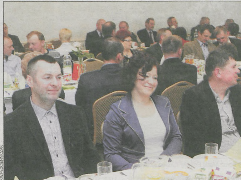
Nasi producenci mleka należą do krajowej czołówki