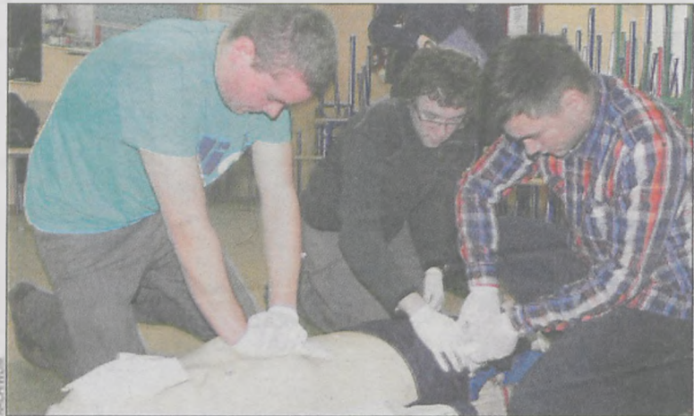
Uczestnicy finałów powiatowych pokazywali na co ich stać

24 kwietnia na terenie Zespołu Szkół Ponadgimnazjalnych w Koźminie odbył się powiatowy finał turnieju motoryzacyjnego. Po wyrównanej rywalizacji pierwsze miejsce zdobyli uczniowie Zespołu Szkół Ponadgimnazjalnych nr 1 w Krotoszynie.