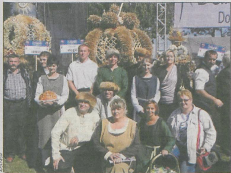
Laureaci konkursu na najaktywniejsze sołectwo 2013 – Dziadkowo

W gminie trwa nabór wniosków w ramach konkursu grantowego Działaj Lokalnie, które mogą uzyskać unijne dofinansowanie. Premiowane będą projekty inicjujące współpracę mieszkańców na rzecz dobra wspólnego.