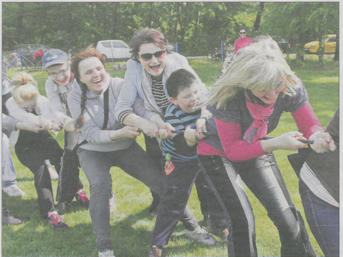
Przeciąganie liny przyniosło wszystkim dużo radości