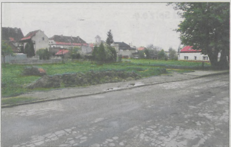
Dzięki nadwyżce wykonany zostanie m.in. parking na ul. Mastowskiego

Podczas kwietniowej sesji mówiono m.in. o nadwyżce budżetowej. Pieniądze rozdysponowane zostaną m.in. na inwestycje, w tym budowę parkingu na ulicy Mastowskiego.