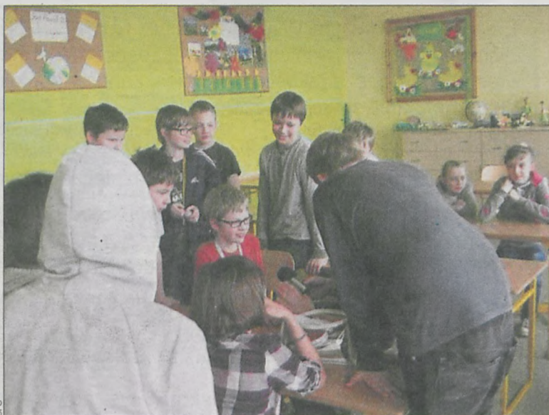
Młodzież podczas pracy nad własnym filmem

11 kwietnia młodzież ze Szkoły Podstawowej nr 8 w Krotoszyźnie uczestniczyła w zajęciach pn. Wielka przygoda z filmem.