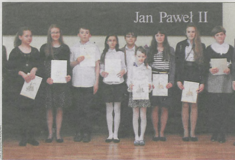
Najzdolniejsi uczniowie otrzymują od 250 do 450 zł za pierwsze półrocze

Stypendyści to najlepsi uczniowie ze szkół w gminie Krotoszyn. Każdy z wyróżnionych może pochwalić się wysoką średnią ocen, wielu z nich brało udział w konkursach, olimpiadach o zasięgu regionalnym, wojewódzkim, ogólnopolskim, a nawet międzynarodowym. Niektórzy wydali nawet własne książki, inni zajmują się prowadzeniem stron internetowych, piszą wiersze, mają uzdolnie-