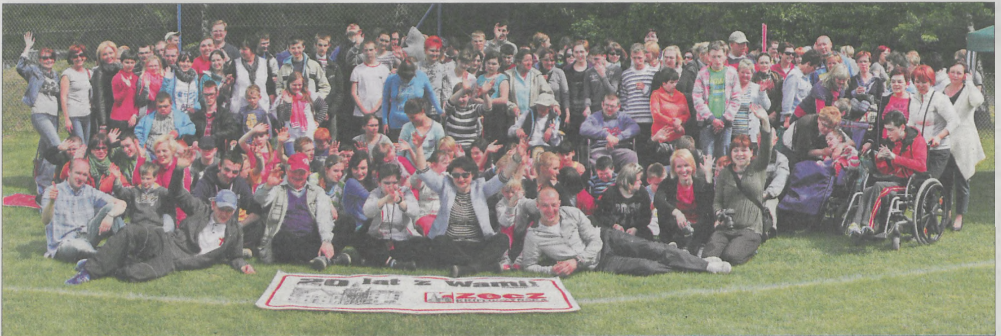
Uczestnicy spotkania pod grzybkem