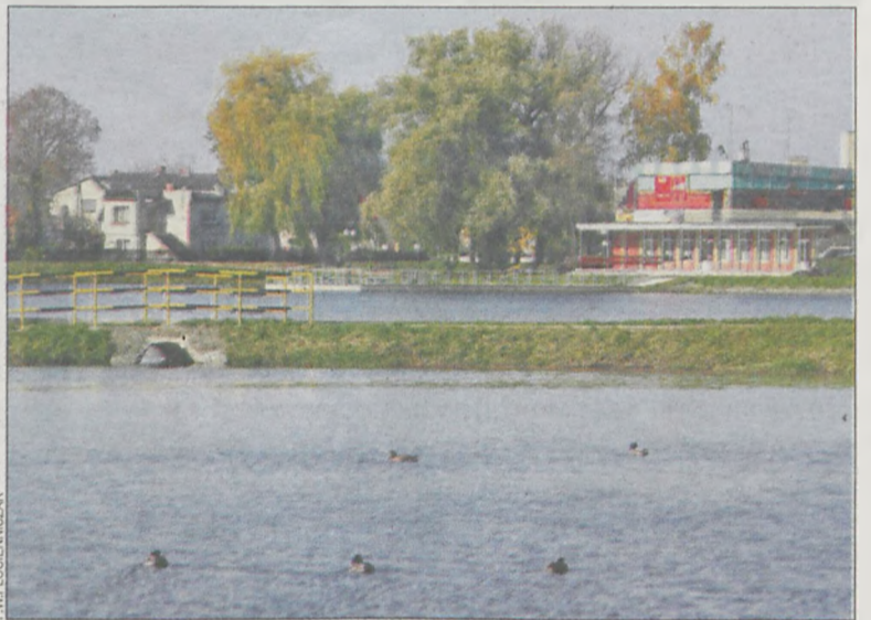
Zbiornik zostanie udostępniony wędkarzom już 2 listopada