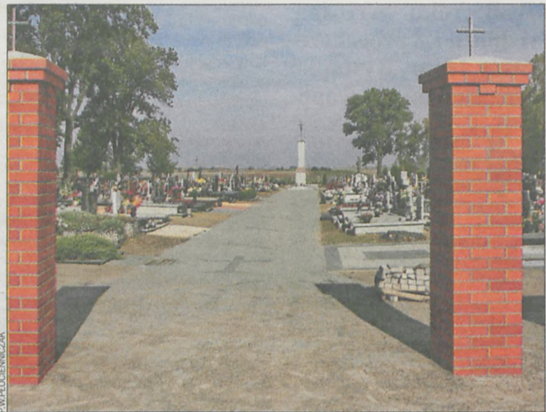
Cmentarz w Lutogniewie zyskał nowy, ceglany parkan i utwardzone alejki