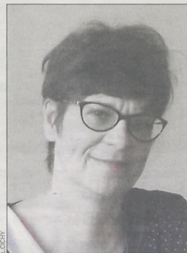
Jest dyrektorem od 2011 r.