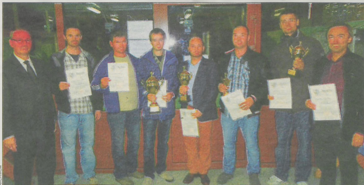
Zawody dla firm bractwo kurkowe zorganizowało po raz pierwszy