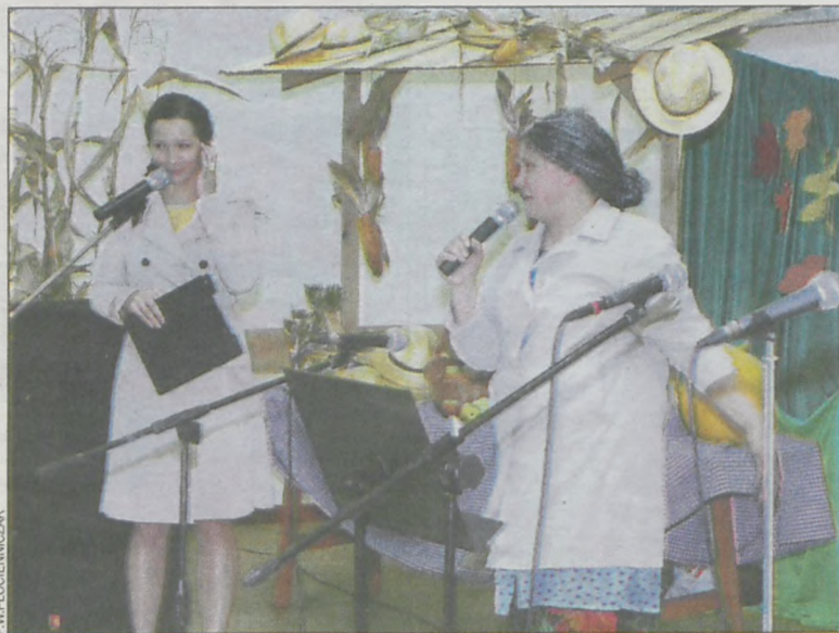
„Babiniec” podczas występu w Kuklinowie, gdzie rozbawił publiczność do łez

Podsumowaniem konferencji było ogłoszenie wyników konkursów Kobiety w akcji oraz Hymn liderki . W szerokim gronie laureatów znalazły się panie z rozdrażewskiego zespołu Babiniec , które otrzymały wyróżnie-