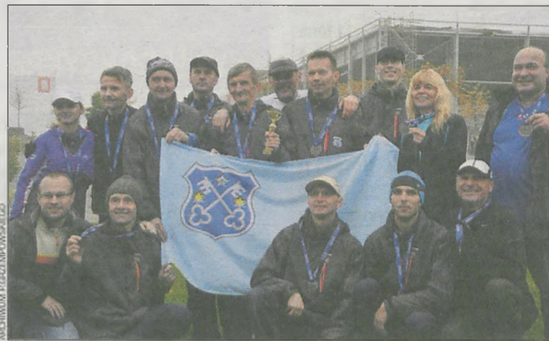
Zawodnicy KS „Krotosz” na pamiątkowym zdjęciu