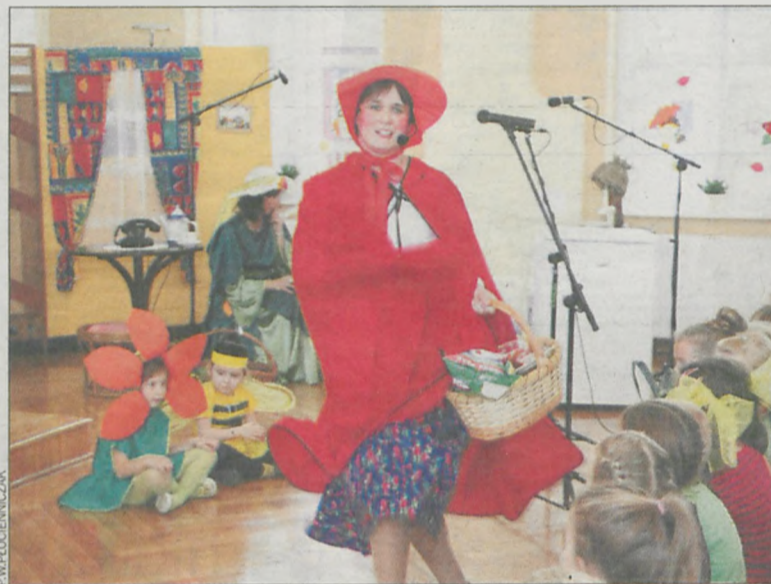
...oraz ich rodzice

zł. Sfinansował je krotoszyński urząd przy wsparciu Państwowego Funduszu Rehabilitacji Osób Niepełnosprawnych. – Wszystkie te zadania realizowane były w czasie roku szkolnego. Prace rozpoczęły się w październiku, a zakończyły w maju bieżącego roku. W tym czasie przedszkole nieprzerwanie realizowało swoje zadania wy-