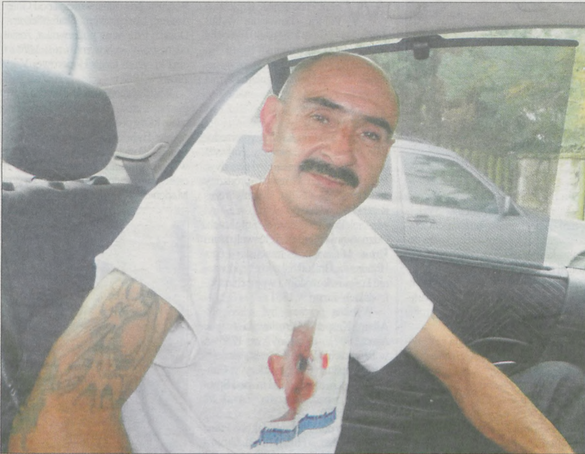
Tulipan mieszka z dziewczyną, z którą ma dwoje dzieci, i z jej siostrą, która również urodziła mu dwoje dzieci

Czy pamiętacie filmowego Tulipana, który wykorzystywał łatwowerne kobiety, wylądował od nich pieniądze i kosztowności, a potem zniknął. Serial oparty był na prawdziwej historii, mającej miejsce w naszym kraju, głośniej w latach osiemdziesiątych.