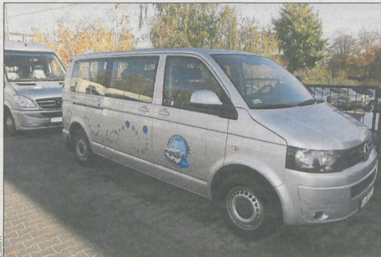
Volkswagen caravelle zastąpi wyeksploatowanego volkswagena transportera