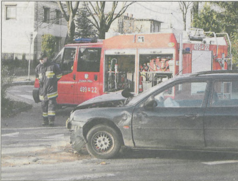
Działania służb ratunkowych trwały ponad trzy godziny

W miniony czwartek w godzinach popołudniowych na skrzyżowaniu ul. Klasztornej z ul. Jana Pawła II w Koźminie Wlkp. doszło do groźnie wyglądającej kolizji, w wyniku której sześć osób, w tym dwoje dzieci, zostało rannych.