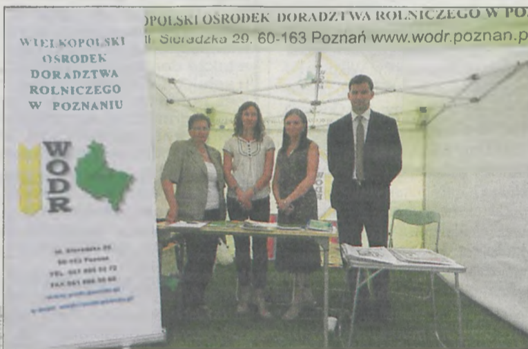
Przedstawiciele ośrodka biorą udział w pokazach, wystawach i innych imprezach