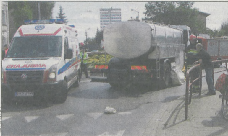
Kierowca nie zachował szczególnej ostrożności włączając się do ruchu na rondzie