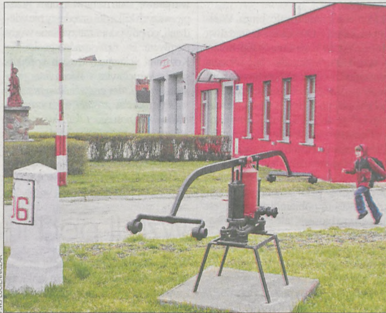
Gmina Kobylin wsparła OSP dodatkowymi 9 tys. zł