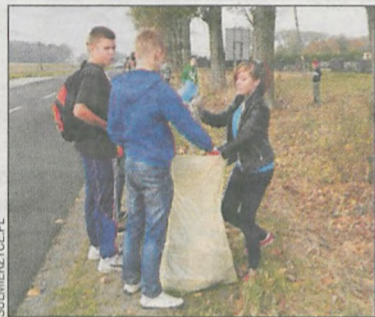
Młodzież zaangażowała się w pracę