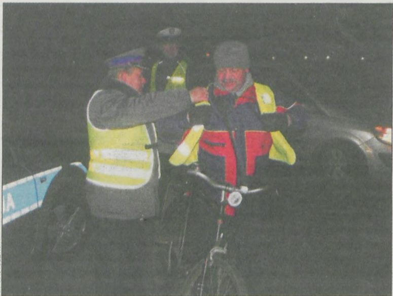
Podczas akcji rowerzyści nie byli karani. Dostawali kamizelki

15 października od godz. 5.00 krotoszyńscy policjanci kontrolowali rowerzystów w ramach corocznej akcji.