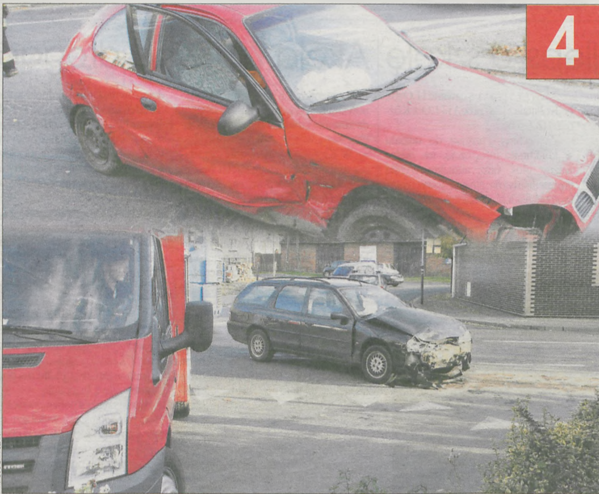
Ford jechał od strony Jarocina, a kierująca daewoo wyjeżdżała z ul. Jana Pawła II

Sześć osób, w tym dwoje dzieci w wieku 4 i 9 lat, zostało rannych w wypadku na skrzyżowaniu ul. Klasztornej z ul. Jana Pawła II w Koźminie Wlkp. Kierująca daewoo mieszkanka tej gminy nie ustąpiła pierwszeństwa przejazdu fordowi mondeo, doprowadzając do zderzenia.