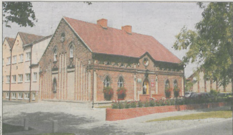
Na modernizację za ponad milion złotych czeka centrum Pępowa