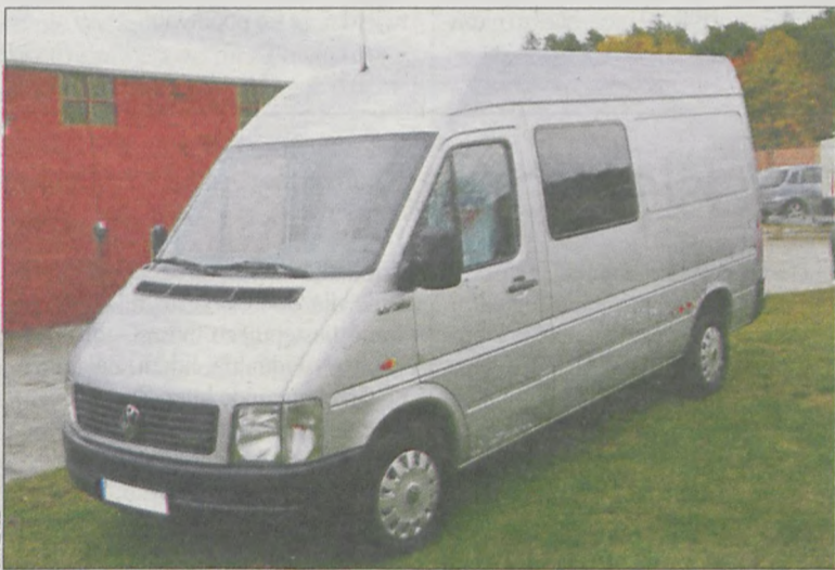
Nowy samochód dla ekipy hydraulików

Gminie Cieszków nie udało się sprzedać wozu strażackiego star 244, wyprodukowanego w 1984 r. Samochód ten należał do jednostki Ochotniczej Straży Pożarnej w Cieszkowie i został wycofany w tym roku. Zastąpił go znacznie nowszy mercedes. Stara próbowano sprzedać w dwóch przetargach. Do pierwszego, który od-