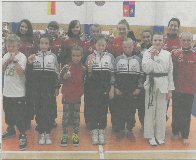
Ekipa „Białych Tygrysów” z dumą prezentuje swoje medale

Pierwszy start zagraniczny mają za sobą zawodniczki Białych Tygrysów . Na międzynarodowym turnieju taekwondo Sokol Cup – CEFTA 2013 , rozegranym w Hradec Kralove 12 października, dziewczęta z Borzęcic wywalczyły brązowe medale.