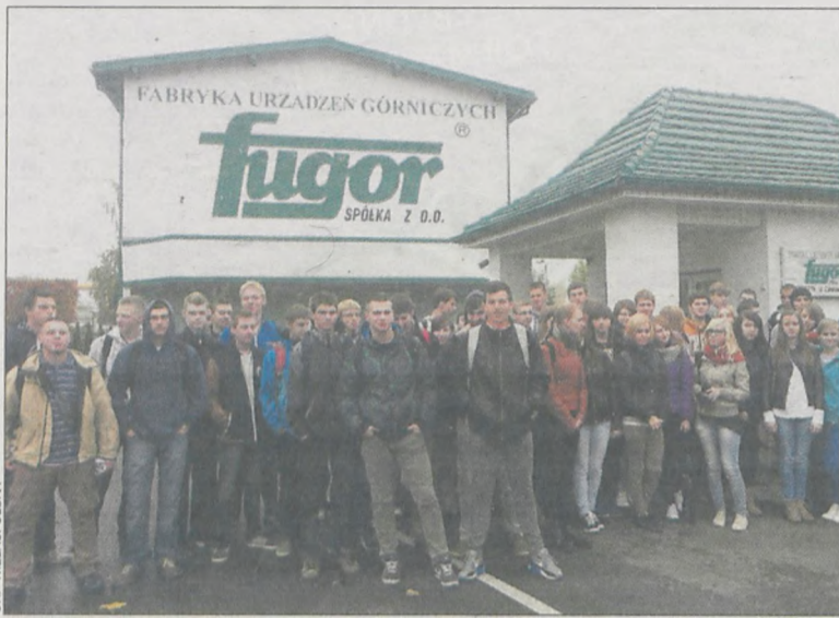
Młodzież odwiedziła kilka firm, m.in. krotoszyński „Fugor”

18 października w Ośrodku Szkolenia Zawodowego na ul. Kobylińskiej w Krotoszynie podsumowano Ogólnopolski Tydzień Kariery, do którego w tym roku przyłączyły się Punkt Pośrednictwa Pracy oraz Klub Pracy.