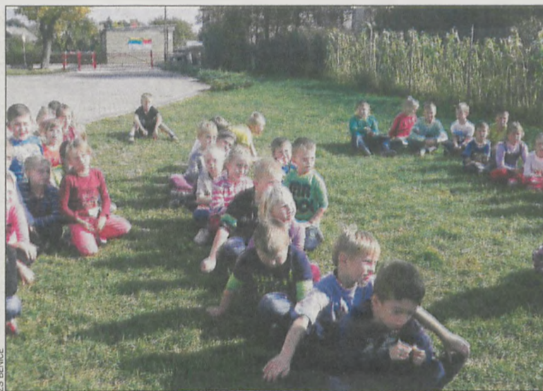
Piknik w Benicach

Ziemniak nierozzerwalnie kojarzy się z wykopkami, które powoli dobiegają końca. Nic więc dziwnego, że w październiku wiele szkół organizuje imprezy z pyrą w tle.