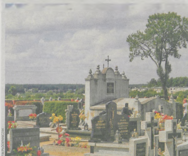
Cmentarz w Sulmierzycach przy ul. Wrocławskiej. Tu także 1 listopada nie zabraknie tych, którzy przyjdą na groby swoich najbliższych. W mieście znajdują się ponadto dwie nekropolie: stara (zabytkowa) i współczesna na Błoni.

Tę prawdę uświadamiamy sobie w sposób szczególny na każdym pogrzebie, nie tylko wówczas, kiedy żegnamy w kościele czy cmentarnej kaplicy osobę bardzo bliską. Był człowiek. Żył, rozmawiał, cieszył się, smucił, a zostało tylko ciało i przykryta wawą ją mogiła, na której zapalimy lampkę, położymy kwiecie, przy której powspominamy dobre wspólne chwile. Czy rzeczywiście tylko ciało? Osoby niewierzące, aby uzasadnić swe niedowiarstwo, lubią posługiwać się argumentem, że wiara to pociecha dla ubogich i przeżywających inne trudności. Oto prostaczkowie wymyślili sobie życie po śmierci, drugi lepszy świat, ponieważ potrzebują nadziei i choćby takiego rodzaju wsparcia w dźwiganiu ciężaru codzienności. Pominę uwłaczający ludziom wiary absurd tego stwierdzenia. Czyż jednak nawet największy ateusz gdzieś w głębi duszy nie szuka sensu, nie dopuszcza do siebie myśli, że urodził się, żył, umarł to o wiele za mało, gdy mówimy o człowieku? Romana Hyszko