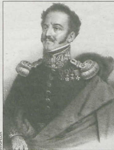
General Jan Nepomucen Umiński