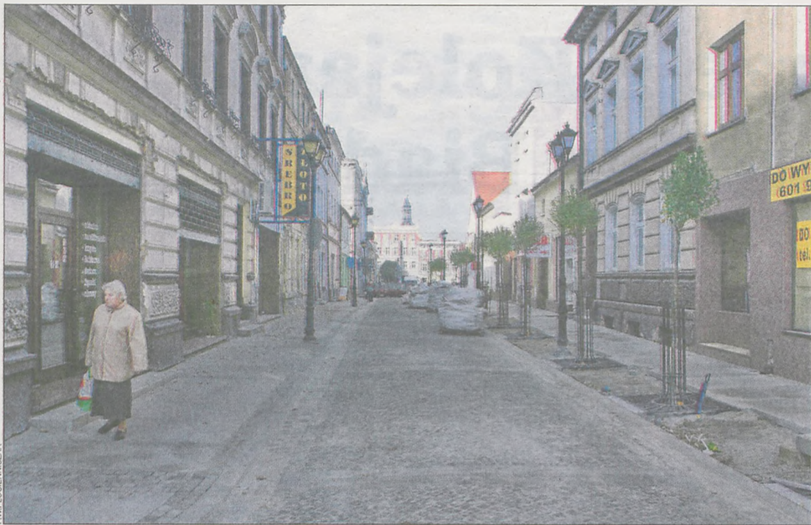
Pod koniec zeszłego tygodnia Farna została oddana do użytku