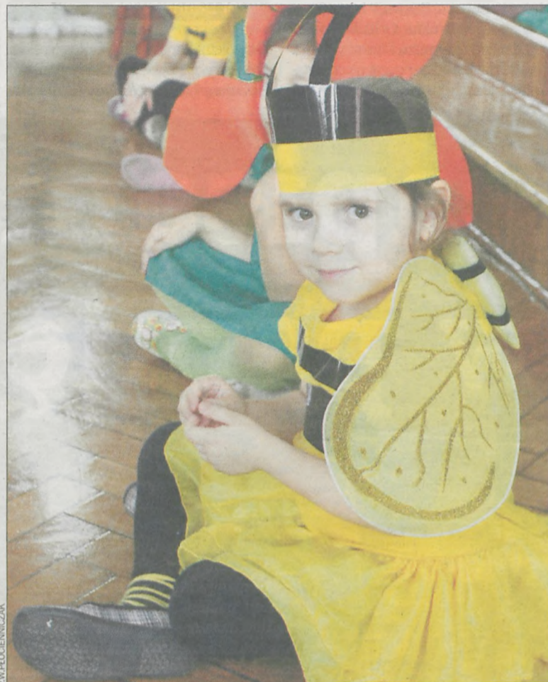
W spektaklu wystąpili wychowankowie przedszkola...

W poprzednim roku szkolnym przeprowadzono termomodernizację obiektu, wyremontowano pomieszczenia przedszkolne i dostosowano je do potrzeb osób niepełnosprawnych. Wykonawcą inwestycji było konsorcjum firm Kubiak i Grześkowiak . Wartość prac wyniosła ponad 340 tys.