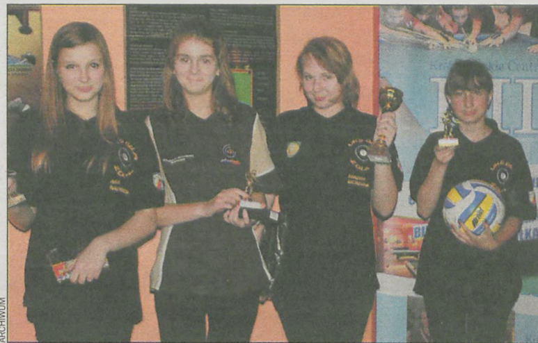
Najlepsze bilardzistki turnieju nie kryły radości

20 października w krotoszyńskim Centrum Bilardowym rozegrano trzecią edycję wielkopolskiej młodzieżowej ligi bilardowej. W turnieju uczestniczyło 21 reprezentantów trzech klubów.