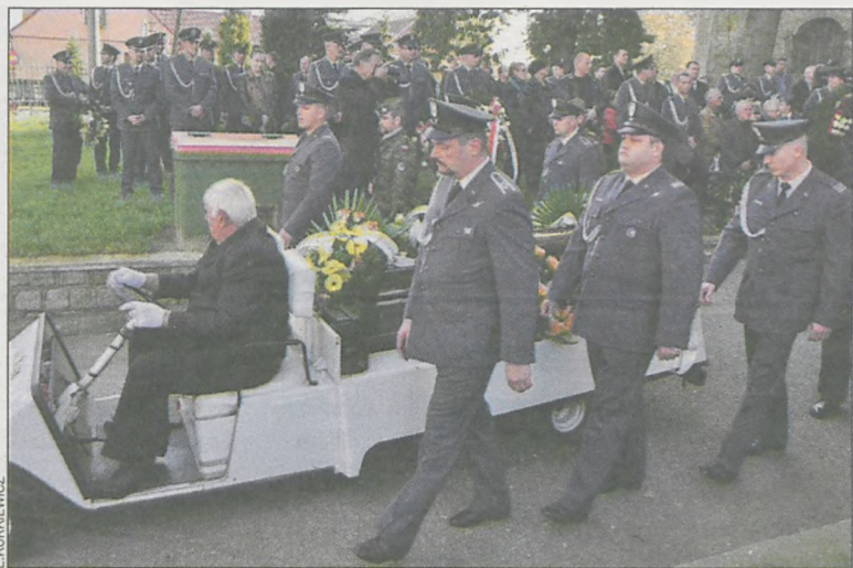
Zmarłego odprowadziła kompania honorowa z Krzesin