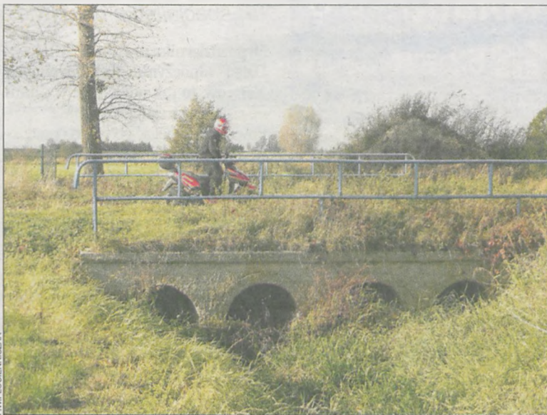
Trwają pomiary na przepuście w Trzemesznie