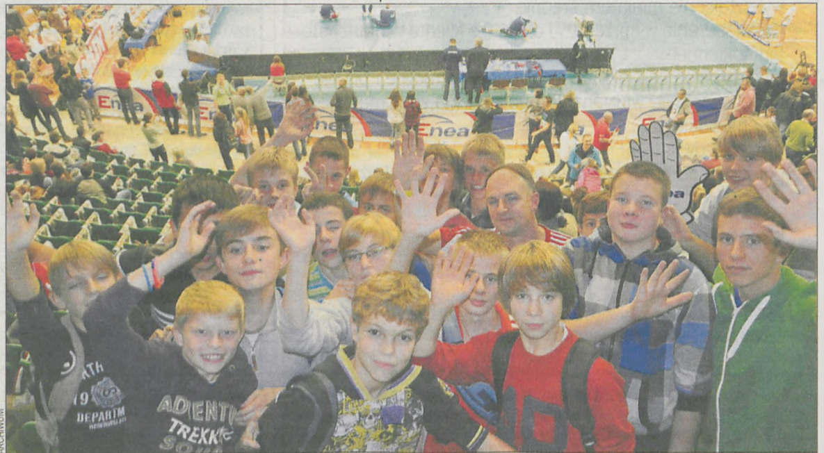
Młodzież z „Piasta” wraz z opiekunem w poznańskiej „Arenie”