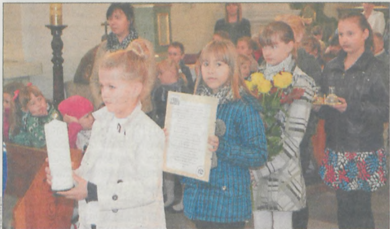
Uczniowie wzięli udział w Mszy św.

Korowód uczniów i nauczycieli szkoły przeszedł ulicami miasta z Kapelą znad Orli zakończył imprezę. (ft)