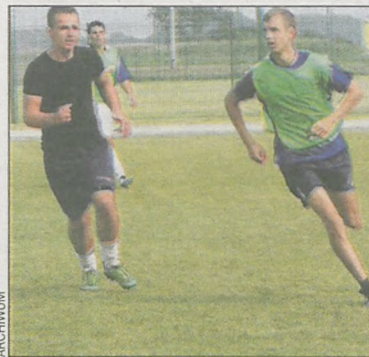
Boisko jest czynne od ponad tygodnia

By problem zlikwidować, magistrat musiał przeprowadzić na boisku zabieg agrotechniczny, polegający na rozluźnieniu i napowietrzeniu wierzchniej jego warstwy. Zrobiono to przed trzema tygodniami. Gmina zapłaciła za zabieg 16 tys. zł. – Po takim zabiegu trawa musiała dojść do siebie, więc dopiero po dwóch tygodniach została pierwszy raz skoszona. Przeprowadziliśmy również badania gruntu. Wykazały, że sytuacja się poprawiła. Mam nadzieję, iż