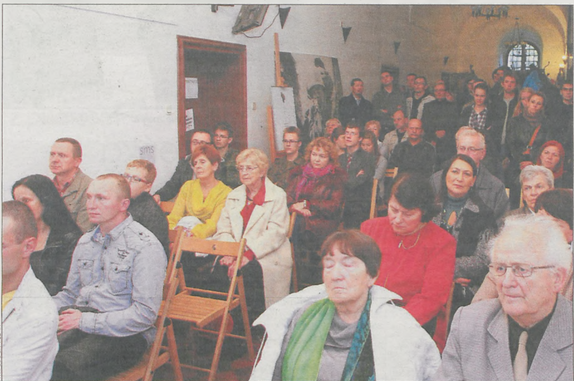
Na wernisaż przybyło ponad sto osób