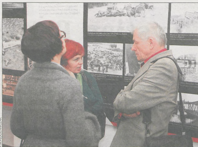
Dwujęzyczne plansze wypożyczono z krakowskiego IPN