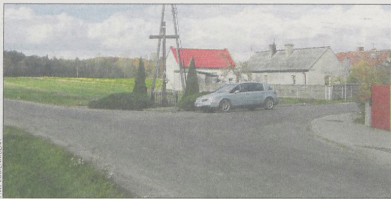
Prace związane z częściowym odwodnieniem drogi mają się zacząć niebawem