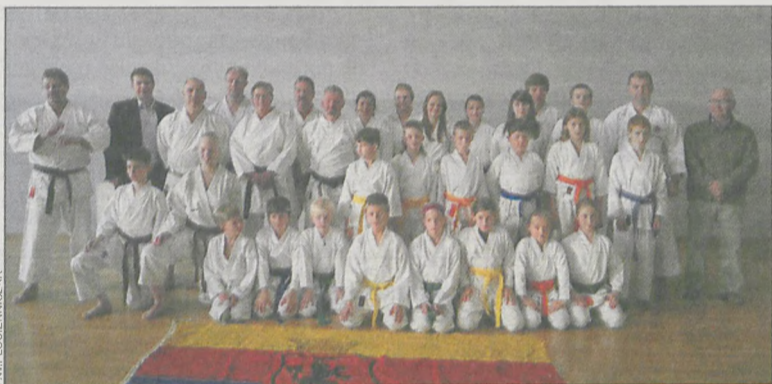
Umiejętności polskich zawodników z KS „Krotosz” zostały wysoko ocenione przez niemieckich karateków