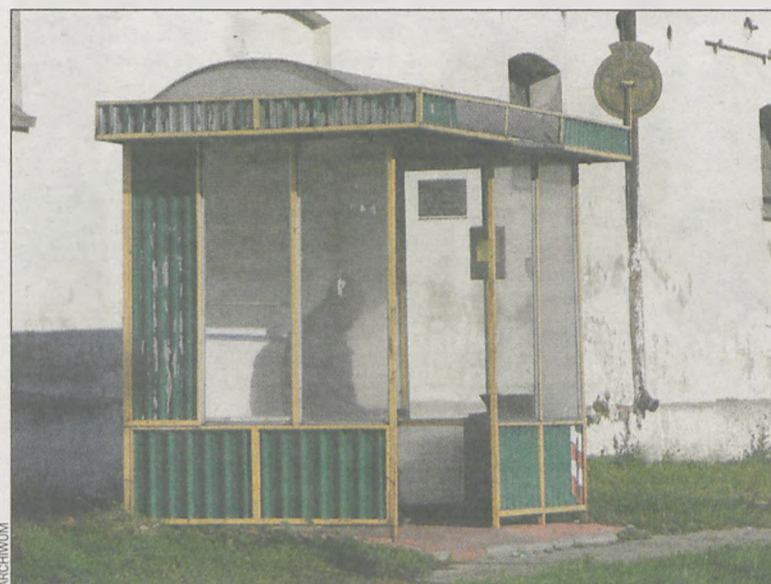
Aktualne ulgi można sprawdzić na stronie www.mzk.krotoszyn.pl

Przystanek w Starym-grodzie leży na terenie gminy Kobylin, gdzie zniżki nie obowiązują (MZK nie ma z tą gminą umowy o częściowej refundacji kosztów). Romanów z kolei to gmina