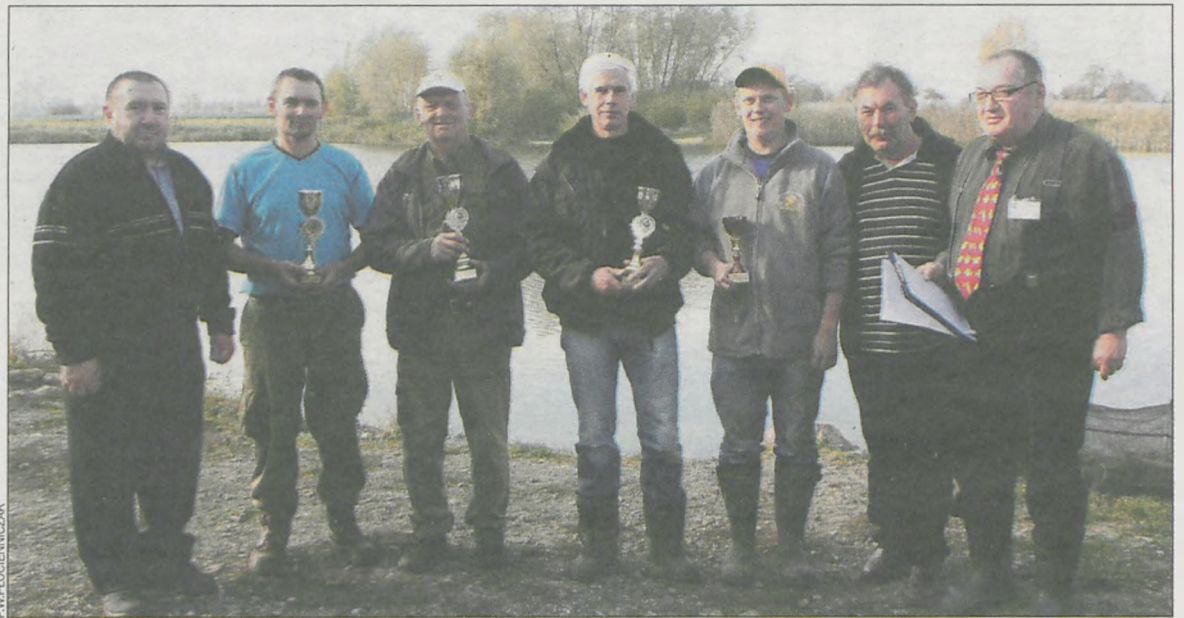
Zwycięzcy jubileuszowego turnieju wraz z organizatorami