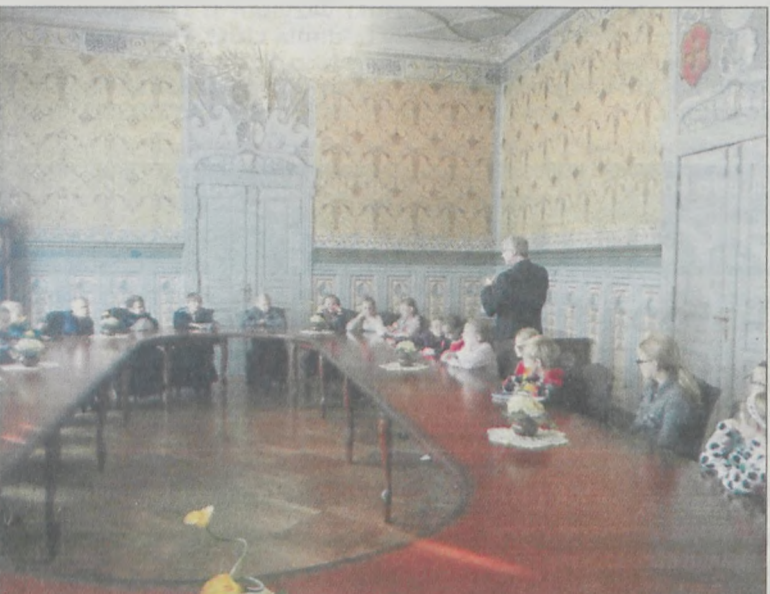
Najmłodsi w magistracie. Furorę zrobiła winda