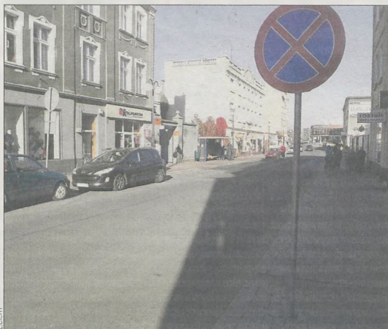
Na ul. Floriańskiej samochody utrudniają pracę kierowcom autobusów