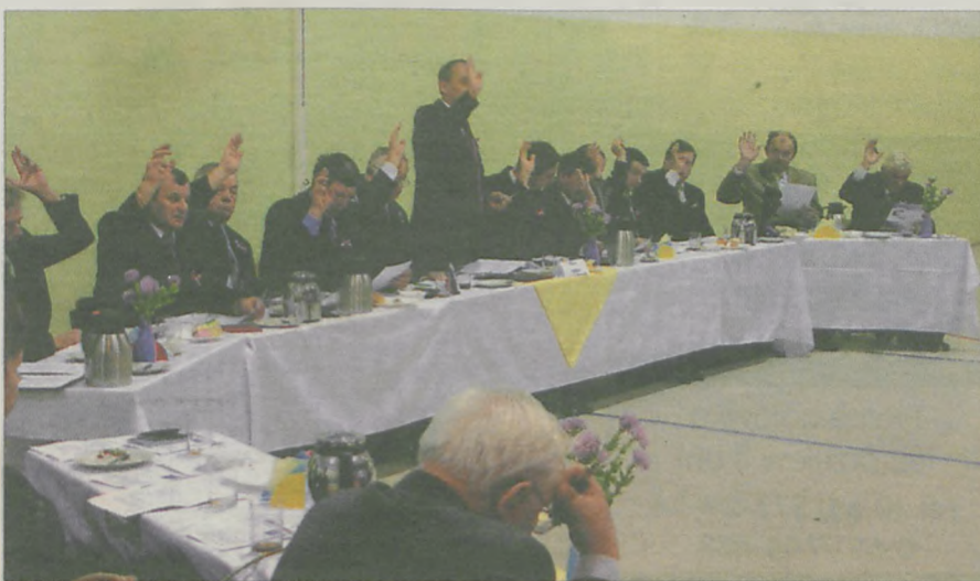
STAWKA PODATKU ROLNEGO - decyzją rady - nie zmieni się w 2009 roku

Kotlińscy radni obniżyli na ostatniej sesji maksymalną stawkę podatku rolnego. Rada podjęła jednogłośnie uchwałę o obniżeniu średniej ceny skupu żyta - z 55,80 zł na 35,00 zł za 1 q. Cena ta przyjmowana jest jako podstawa obliczenia podatku rolnego na 2009 rok.