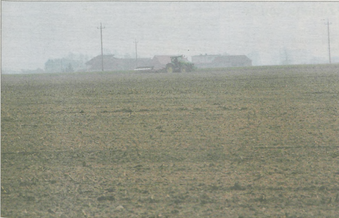
Pole po kukurydzy, na które - według naszych ustaleń - wylano nieczystości, zostało już zaorane

Inspektorzy sprawdzili i stwierdzili, że nie ma innego ujęcia, z którego zakład mógłby czerpać wodę. Skąd zatem zmniejszenie poboru? Kaczmarek tłumaczy tak samo jak doradca ZPM