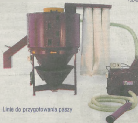
Linie do przygotowania paszy