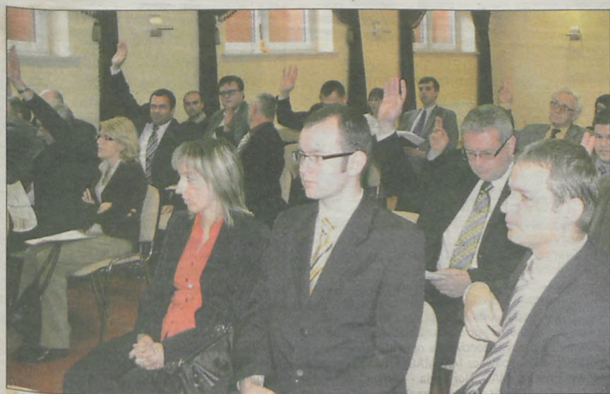
Za składką w wysokości 1 zł opowiedzieli się przedstawiciele wszystkich gmin

10 tysięcy złotych z BZ WBK na pomoc dzieciom