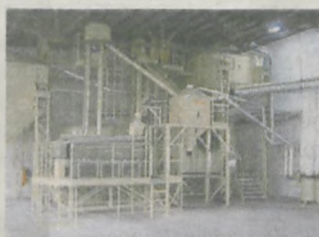
Linie wstępnej i dokładnej czyszczenia ziarna