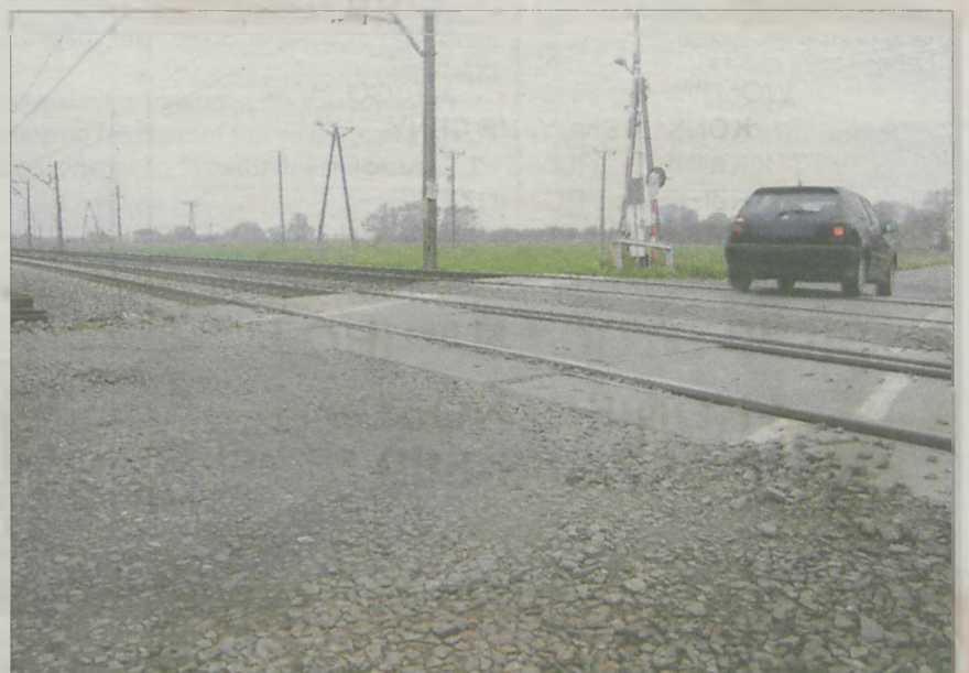
Nierówności na przejeździe kolejowym w Zakrzewie są szczególnie uciążliwe dla samochodów osobowych

Naczelnik Działu Nawierzchni i Obiektów Inżynierskich w Zakładzie Linii Kolejowych