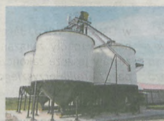
Linie technologiczne magazynów zbożowych

63-800 Gostyń, ul. Ogrodowa 6, tel. 065 5725090, 065 5720886, fax 065 5751765 biuro@zuptor.pl, www.zuptor.pl