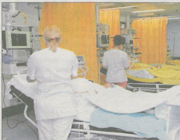
Jarociński szpital zajął 96. miejsce w rankingu „Rzeczpospolitej” - o trzy oczka wyżej niż w roku ubiegłym