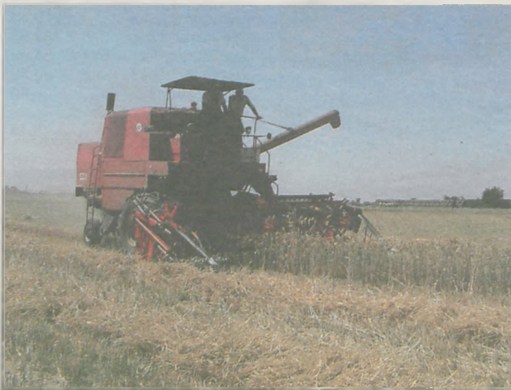
Dopłata do 1 ha zboża wyniesie około 600 zł

Wiadomo już, jakie stawki płatności bezpośrednich obowiązują w tym roku. Jednolita płatność obszarowa (JPO) wynosi 339,31 zł/ha, a płatność do grupy upraw podstawowych - 269,32 zł/ha.