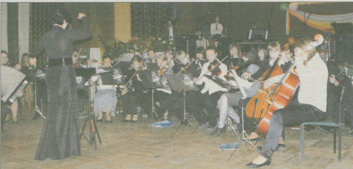
PODCZAS JUBILEUSZU zagrali uczniowie jarocińskiej szkoły muzycznej