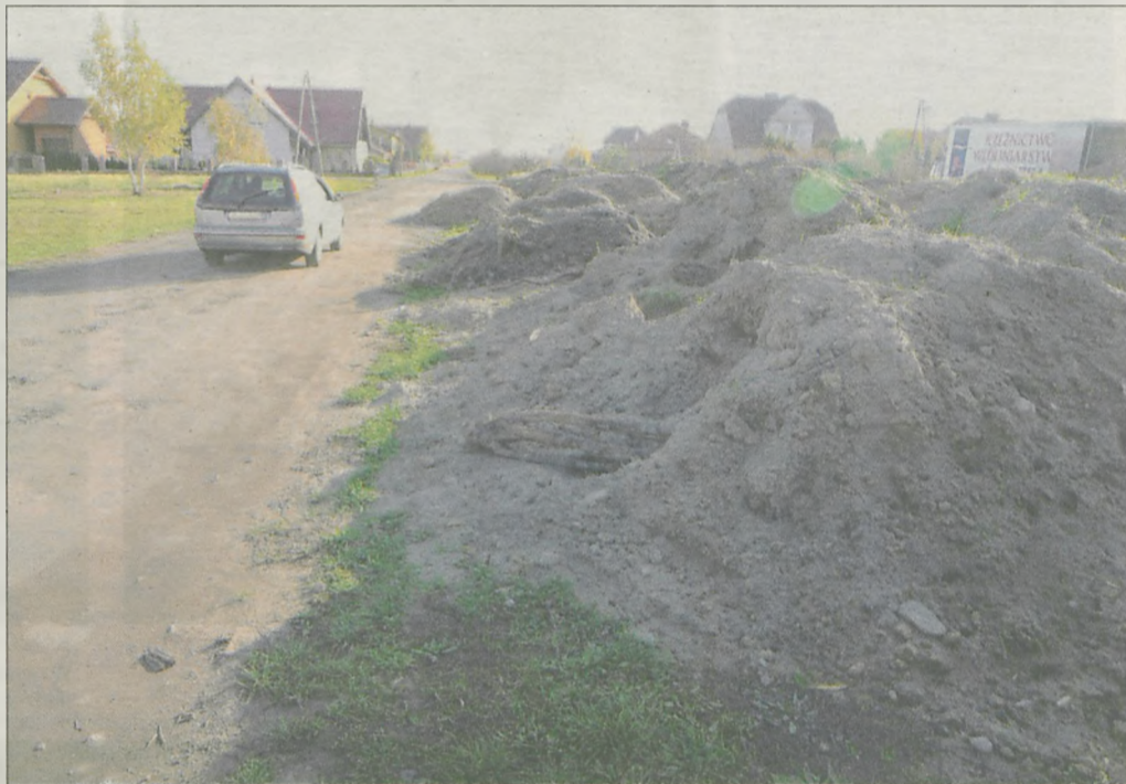
Straż miejska i urzędnicy poszukują sprawców, którzy w środku osiedla usypali hałdę ziemi

W biały dzień, w centrum osiedla, na terenie należącym do gminy nieustaleni sprawcy wysypali kilkaset ton ziemi. Hałda leży częściowo na publicznej drodze. Jeśli straż miejska nie znajdzie winnego, za sprzątnięcie zapłaci gmina.