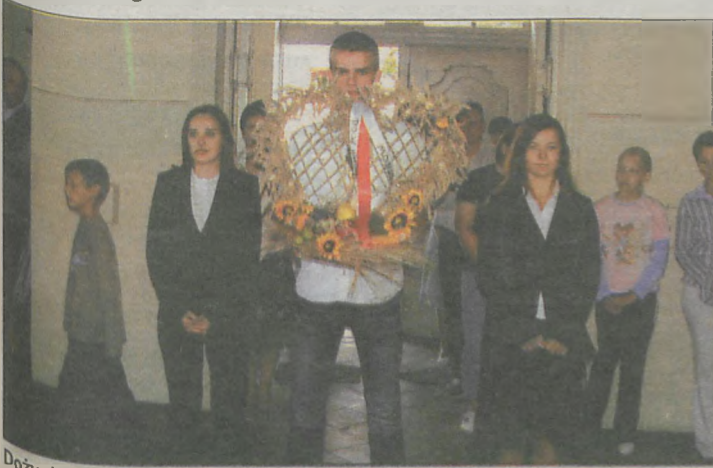
Dożynkowy wieniec przyniosła do kościoła młodzież