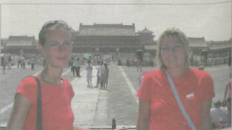
W Zakazanym Mieście