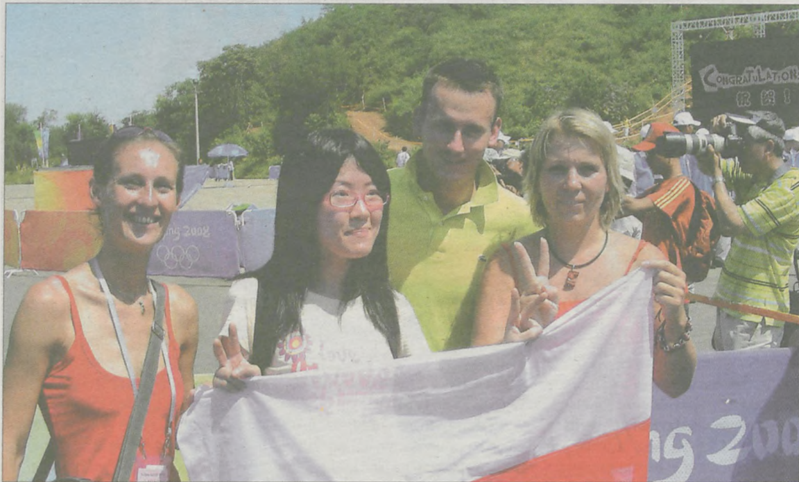
Pekińczycy chętnie fotografowali się z polskimi kibicami

Pekińczycy żyją na ulicach. - Ci ludzie siedzą na ławeczkach, grają w karty, tańczą, albo ćwiczą w si-