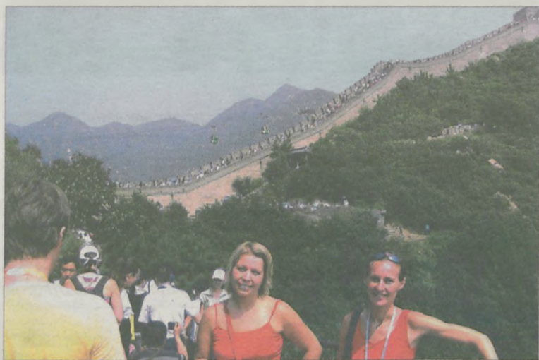
Jeden, spośród trzech tygodni pobytu w Chinach, wuefistki z „jedyńki” poświęciły na zwiedzanie Pekinu

to służyły pomocą. Poza tym duże wrażenie robiły ceremonie wręczenia medali. Bardzo uroczyste z tańcami i występami, perfekcyjnie przygotowane i przeprowadzone. Obsługa wycieczona do granic możliwości, wyglądało to wręcz jak musztra. Nawet rozstawianie płotków do biegu z przeszkodami odbywało się w ten sam sposób, jak wnoszenie flagi na ceremonii otwarcia igrzysk.