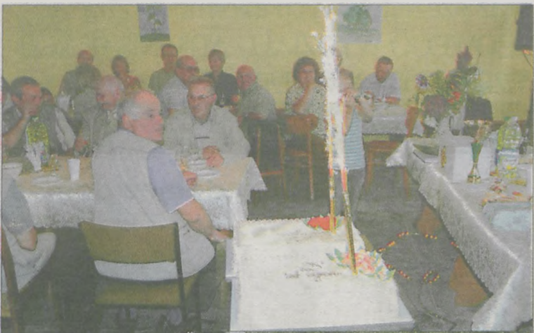
Jubileusz uczczono dwoma tortami urodzinowymi