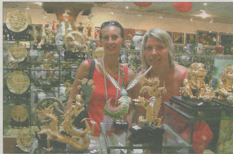
W sklepie z pamiątkami

Obiekty olimpijskie zrobiły na jarociniankach wielkie wrażenie.