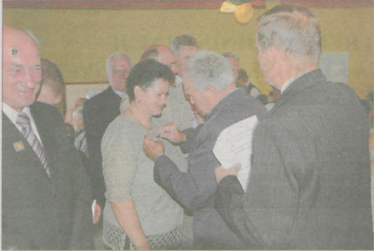
Z okazji 25-lecia „Relaksu” medale odebrało czternastu działkowców. Dwie złote odznaki są pierwszymi w historii ogrodu