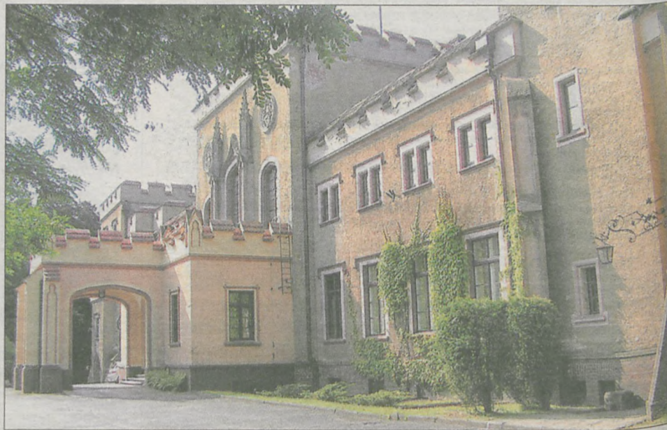
Kto wygra batalię o pałac? Gmina ma nadzieję, że to jej uda się przejąć obiekt

Wiceburmistrz przyznaje, że gmina nie ma gwarancji, że w pałacu nie pojawi się inny nowy właściciel. - Mamy deklarację ministerstwa kultury, ustne co prawda, które nie jest,