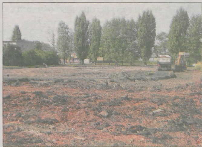
Pod koniec sierpnia rozpoczął się pierwszy etap budowy wielofunkcyjnego boiska