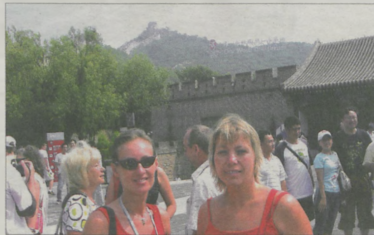
„Jeden świat, jedno marzenie” na Wielkim Murze Chińskim

Wśród olimpijskich kibiców było wielu Polaków. - Mimo że był to nie