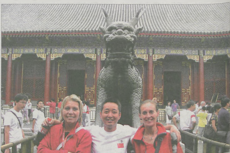
W Pałacu Letnim