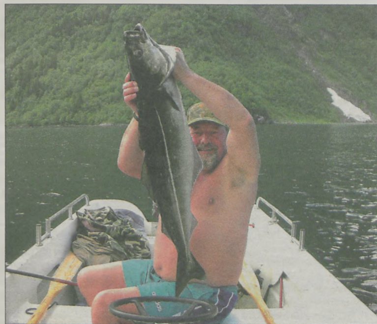
9 kg czarniak połakomił się na 25 cm woblera* *wobler to sztuczna przynęta

ludźmi pojechał jednak na własną rękę. - W takim ścisłym gronie czterech osób - oprócz mnie dwóch kolegów z Gostynia i jeden z Borku - jeździliśmy do Szwecji nawet dwa razy w roku. To trwało około pięciu,