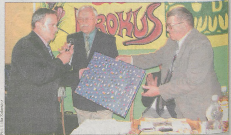
O życzeniach i upominkach dla „Krokusa” pamiętali prezesi innych ogrodów działkowych, w tym również zarząd ROD „Relaks”, który w tym samym czasie świętował 25-lecie istnienia