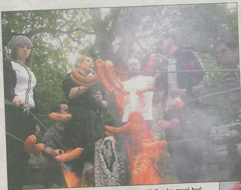
Nie tylko wiosłowaniem człowiek żyje, czas na kiełbaskę musi być