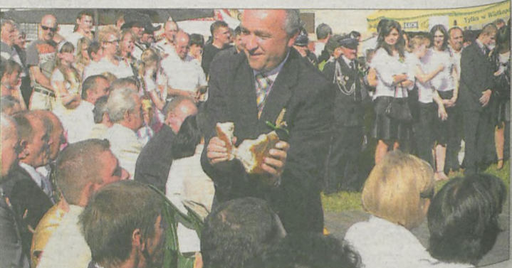
Wójt razem z sołtysem częstowali wszystkich świeżym chlebem z tegorocznych plonów

W Kruczynie widać powiew świeżości. Nowy sołtys wręcz dwoi się i troi, żeby sprostać oczekiwaniom mieszkańców. Obiecał, że dożynki powrócą do wsi i słowa dotrzymał. Po uroczystej mszy w kościele w Kolniczkach zaproszeni goście udali się do Kruczyna. Tam miała spotkać wszystkich niespodzianka. Maszyny rolnicze - kombajny i traktory ustawione w kolejce czekały na znak od sołtysa. Ten zaferowany, w ozdobnym kapeluszu kierował ruchem, żeby na drodze nie utworzył się korek. Potem wsiadł na pierwszy przystrojony traktor z muzykantami na wozie i ruszył na czele korowodu. Po kilkunastu minutach pojazdy przez bramę zajechały na plac koło świetlicy. Dwadzieścia delegacji ze wszystkich sołectw zaprezentowało wieniec z tegorocznych plonów. - Dożynki