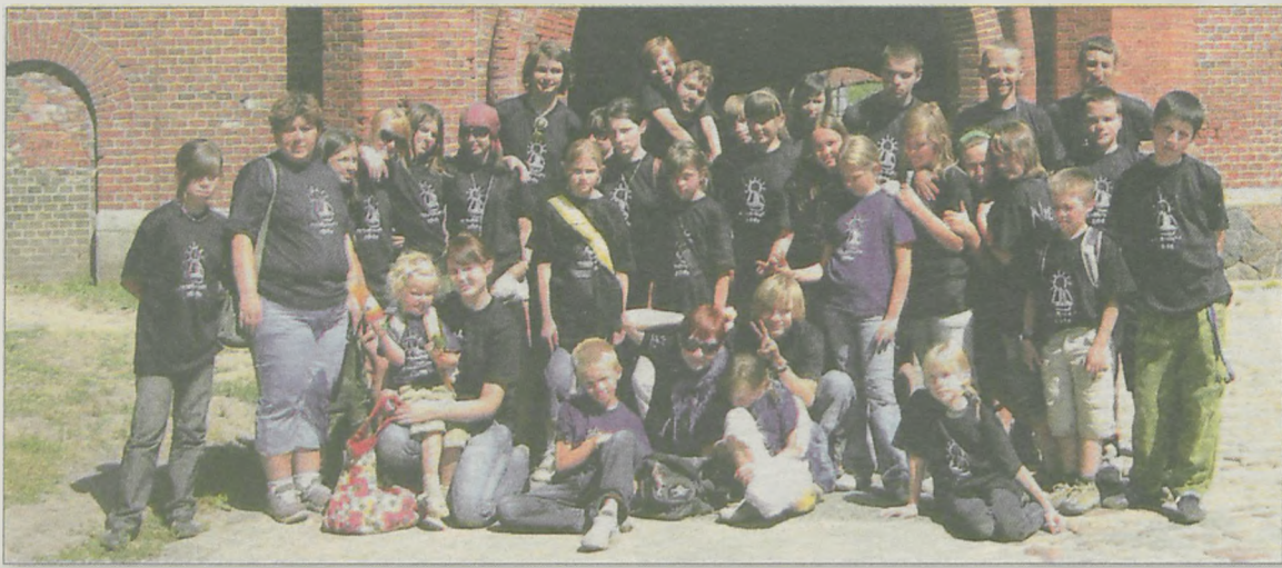
Uczestnicy obozu zwiedzili m.in. twierdzę Boyen

„Na skraju dzikiej puszczy” - tak nazywał się obóz. 500 kilometrów stąd przybrali słowiańskie imiona, założyli słowiańskie stroje, wrócili do kiedyś panujących zwyczajów.