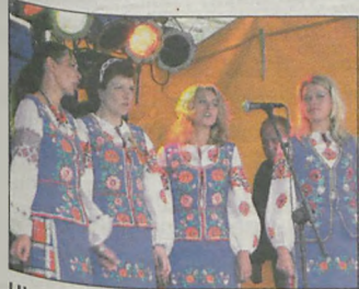
Ukraiński zespół „Znachidka” wystąpił na gminno-powiatowych dożynkach w Górze