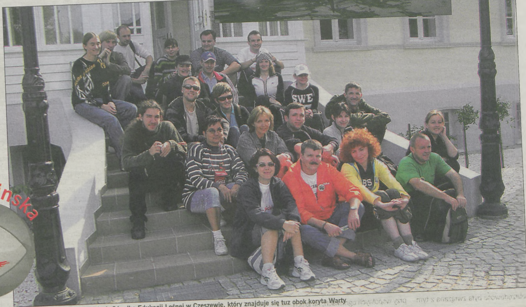
Chwila odpoczynku na schodach Ośrodka Edukacji Leśnej w Czeszewie, który znajduje się tuż obok koryta Warty