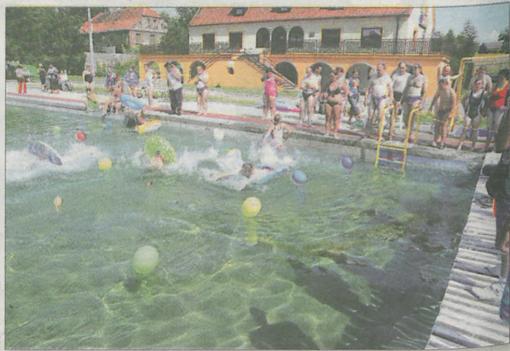
Na żerkowskich basenach rywalizowało 150 osób

teracach. Zawodnicy nurkowali i grali w piłkę plażową. Po obiedzie na wszystkich czekała zabawa przy dźwiękach zespołu Ex-Treme i konkurs „otwarty mikrofon”.