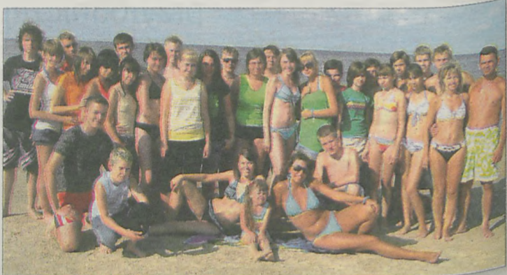
Główną atrakcją pobytu w Świnoujściu były kąpiele w morzu

ru. W Międzyzdrojach odwiedzili Muzeum Figur Woskowych oraz spacerowali słynną Promenadą Gwiazd z odciskami dłoni aktorów i reżyserów. Członkowie KSM przebywali także na terenie Niemiec w miejscowości Ahlbeck. - Ten wyjazd był okazją do prawdziwej