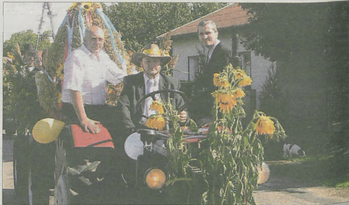
Sołtys dziarsko wskoczył na ciągnik i poprowadził korowód

to dla rolników i mieszkańców wsi bardzo ważna uroczystość. Zgodnie ze starą tradycją dziękujemy Stwórcy za największy skarb rolniczego trudu - chleb. Współczesny rolnik cierpi z powodu niedostatku, ale i braku poszano-