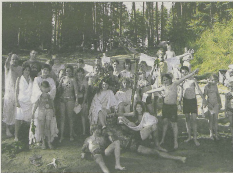
Tego lata bawiono się w Słowian

ca komendanta hufca. 17-dniowy obóz zlokalizowany został na terenie stancy harcerskiej „Cyranka” hufca Otwock w miejscowości Przerwanki, 30 km od Giżycka. Zorganizowanie obozu właśnie tam było możliwe dzięki dotacji, w wysokości 12 tys. zł, z Urzędu Miejskiego w Jarocinie. - Dotychczas jeździliśmy bliżej, nad jezioro, a ponieważ po raz pierwszy otrzymaliśmy tak dużą dotację, postanowiliśmy wyjechać tak daleko - przyznaje komendant obozu. - Poza tym 90 % osób, które jechały, nigdy nie były na Mazurach. To był dodatkowy bodziec dla nas, żeby pojechać właśnie tam.