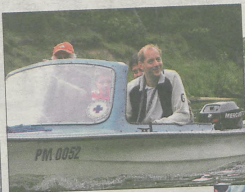
Nad naszym bezpieczeństwem czuwali ratownicy z MCT, pojawiła się także motorówka WOPR-u