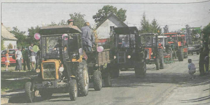
Takiej parady nie widziano w Kruczynie od ponad 30 lat