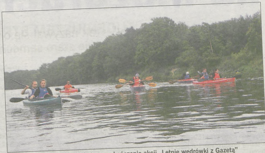
23 osoby płynęły z nami Wartą na zakończenie akcji „Letnie wędrówki z Gazetą”