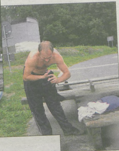
Dla niektórych spływ zakończył się wykręcaniem mokrych ubrań