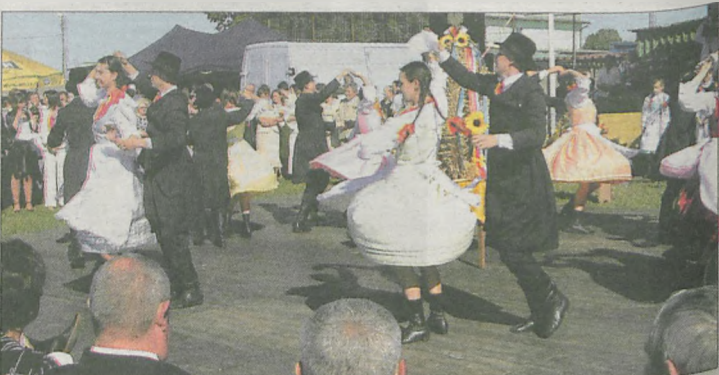
Wieniec dożynkowy został obtańczony przez „Snutki” z Potarzycy