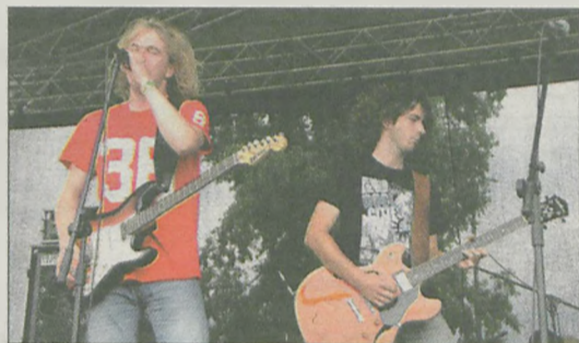
„Rockaway” otrzymał Złotego Kameleona