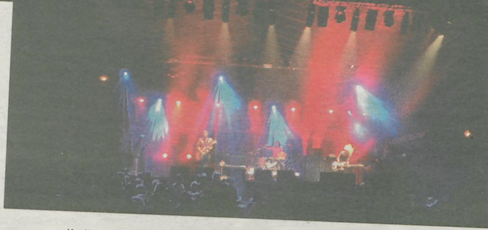
Występ zespołu „The Subways” przez wielu uważany jest za jeden z najlepszych na tegorocznym festiwalu