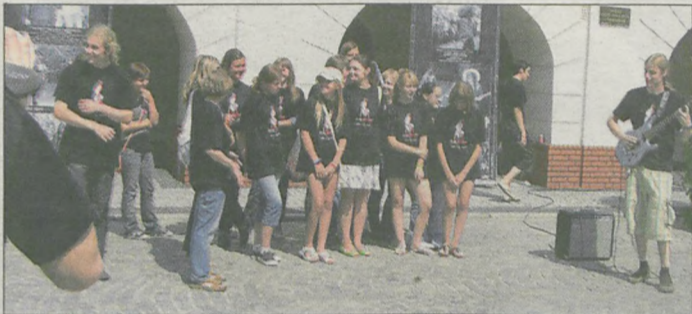
Można było posłuchać dźwięków gitary elektrycznej