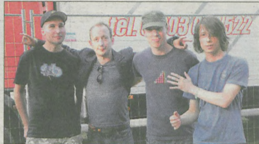
Grand Prix i 1.000 zł zdobył „Reverox”

Wyniki Konkursu Młodych Kapel ogłoszono w sobotę wieczorem. Tytuł Grand Prix i nagrodę pieniężną w wysokości 1.000 zł jury przyznało zespołowi „Reverox”. Oprócz nagrody głównej, przyznało zespołom „Chemical Garage”, „Labirytm” i „Rockaway” równorzędne wyróżnie-