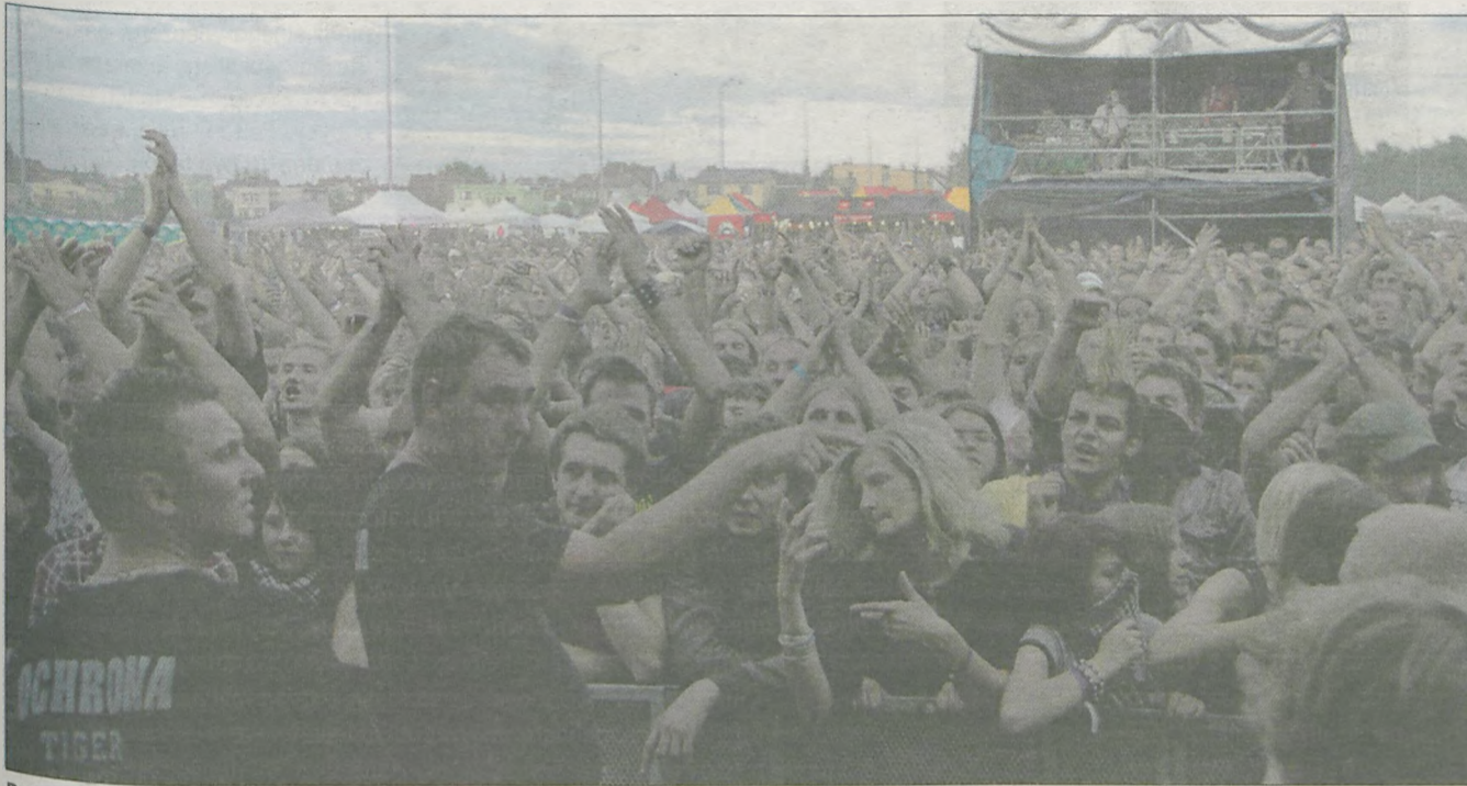
Drugi dzień festiwalu zgromadził pod sceną sporą widownię