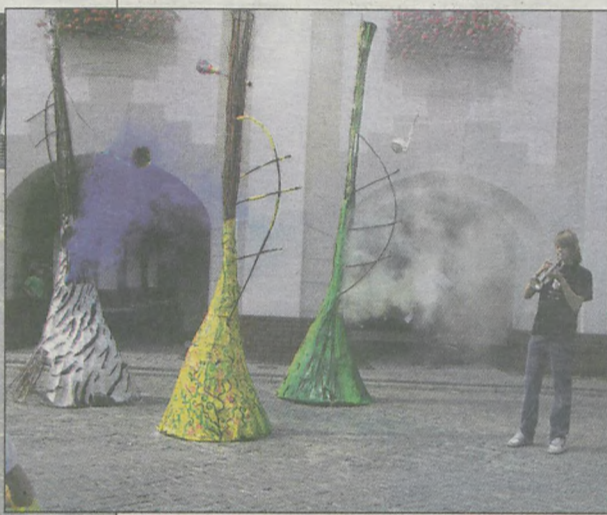
Przy instalacji kilkumetrowych wiklinowo-papierowych trąbek pojawił się trębacz, a potem saksofonista