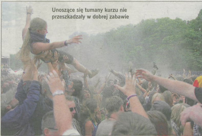
Unoszące się tumany kurzu nie przeszkadzały w dobrej zabawie