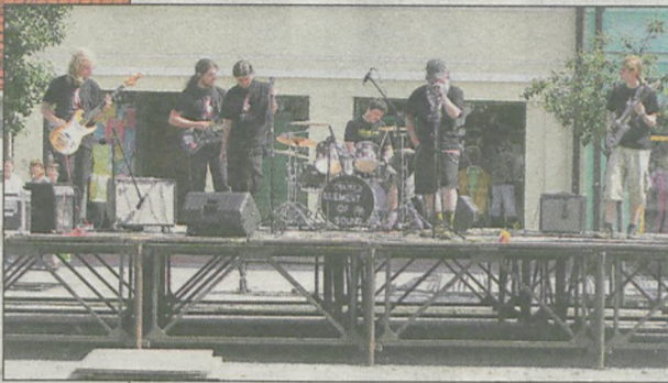
Występ zespołu Element of Sound