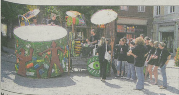
Największe zainteresowanie, szczególnie wśród dzieci, wzbudzały ogromne bębny, przy których oczywiście grali bębniarze