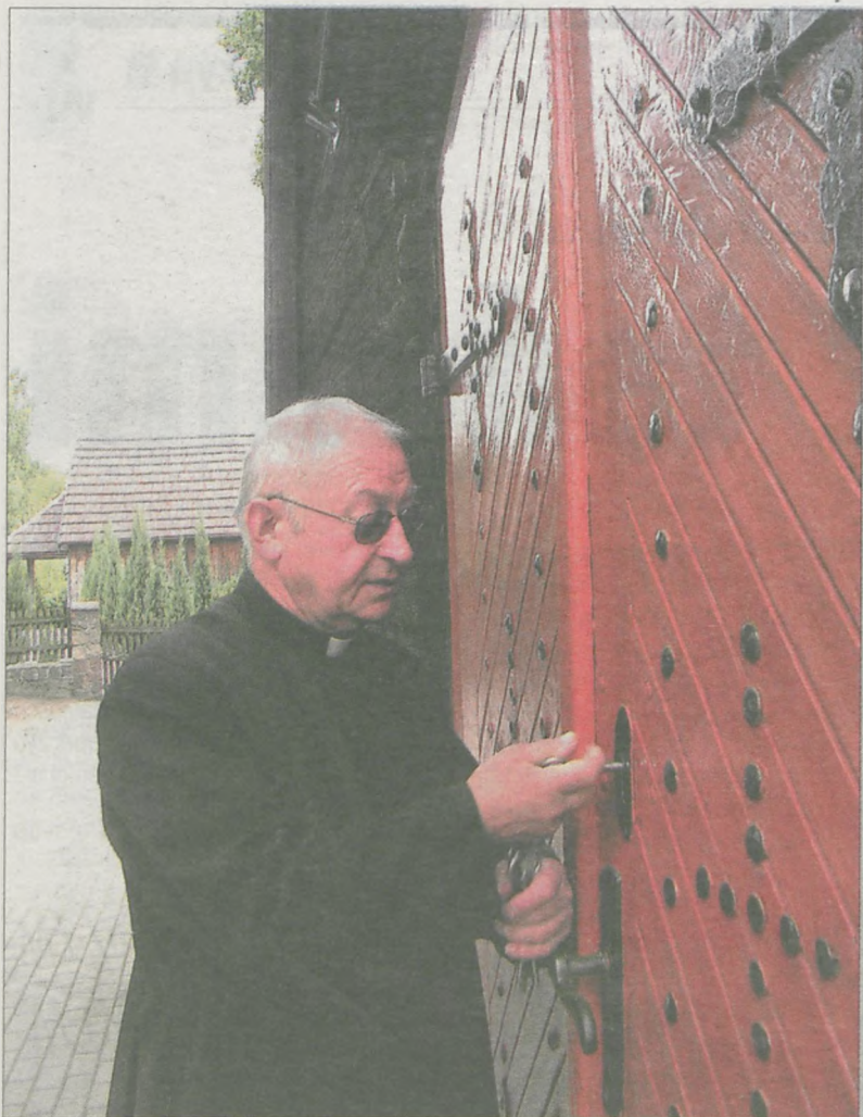
Proboszcz chwali swych parafian - jak trzeba, potrafią się społecznie bardzo zaangażować