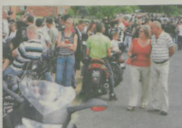
Motocykle wzbudzały spore zainteresowanie u mieszkańców.