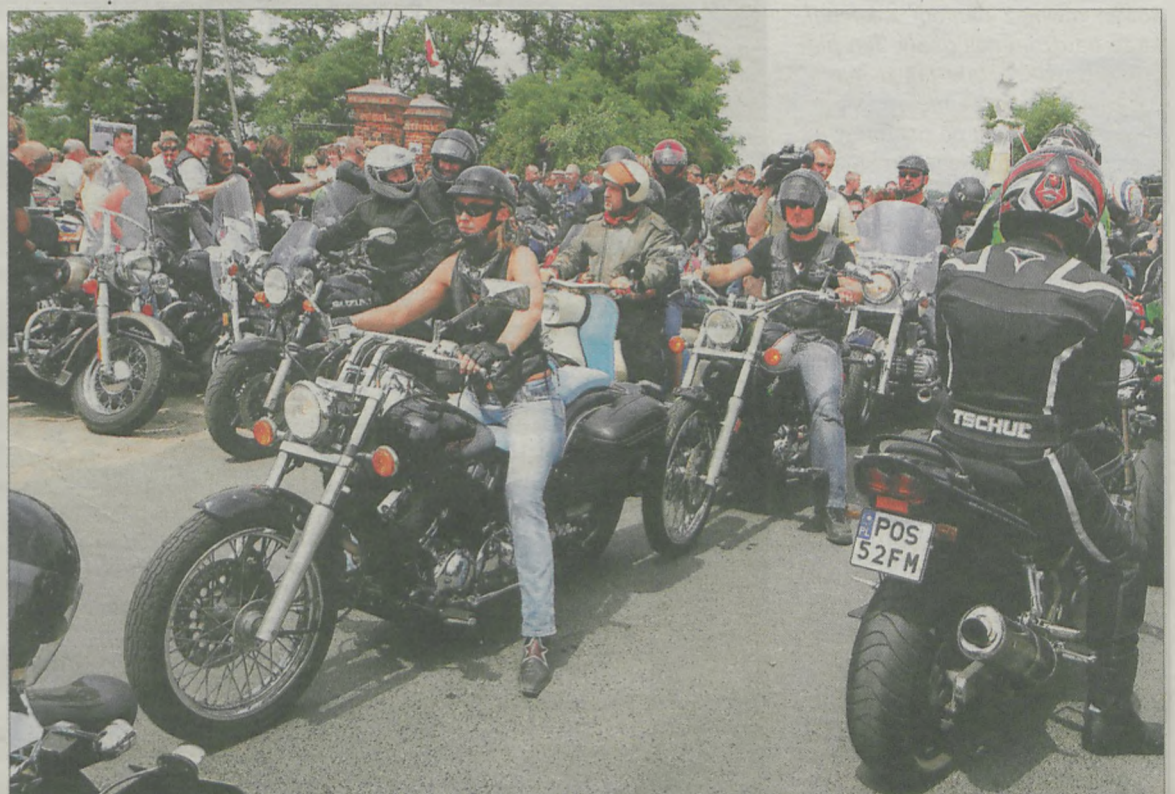
Po mszy odbyła się parada