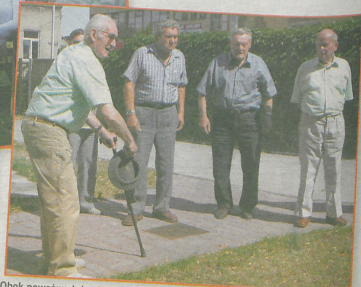
Obok poważnych konkurencji sportowych pojawiały się również bardziej żartobliwe zawody, np. w rzucaniu beretem dla panów i wałkiem dla pań