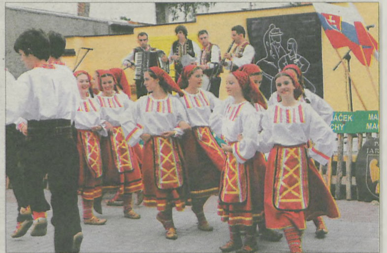
Tancerze z Macedonii podbili w tym roku serca publiczności w Potarzycy i Jarocinie