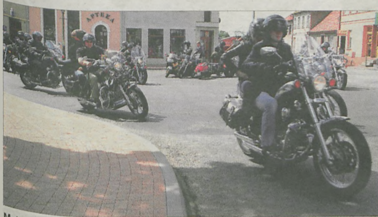
Motory dostawnie zalały gminę Żerków. Tutaj na żerkowskim rynku w drodze na zlot.