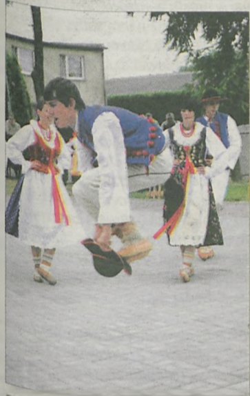
Folklor z terenów górskich cieszy się na Ziemi Jarocińskiej niesłabnącą popularnością