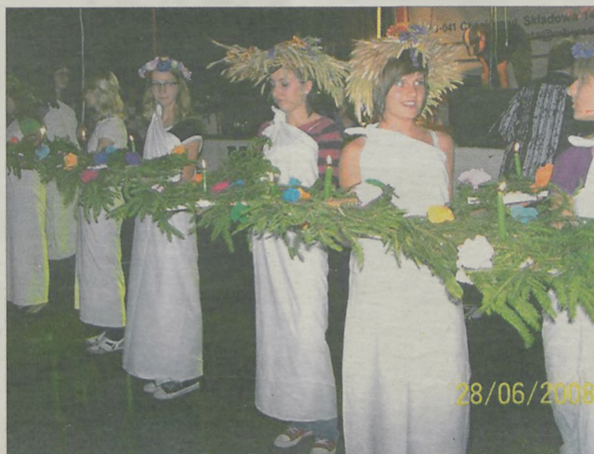
Wianki na Wartę puszczały nowomiejskie dziewczęta