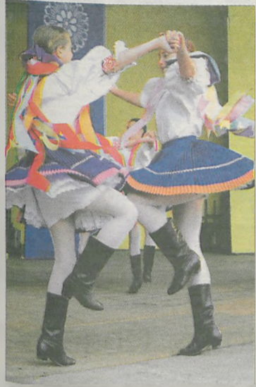
Organizatorzy zadbali, aby na scenie było kolorowo i żywiłowo. Na zdjęciach tancerze z dziecięcych zespołów folklorystycznych „Horeňáček” z Lazne Belohrad (Czechy) oraz „Radost” z Bańskiej Bystrzycy (Słowacja)

Folklor góralski, tańce narodowe, przyśpiewki wielkopolskie, pieśni i tańce z Macedonii, Turcji, Czech i Słowacji, wystawa rękodzieła oraz swojskie jado - to wszystko czekało na tych, którzy w niedzielne popołudnie wybrali się do jarocińskiego amfiteatru. Piękna pogoda i brak innych konkurencyjnych imprez sprawiły, że koncert finałowy