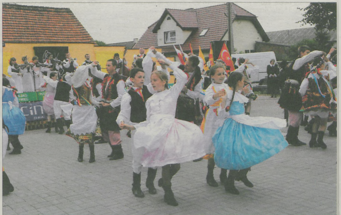
Na festiwalu nie zabrakło polki „Jarocinki” w wykonaniu gospodarzy czyli Zespołu Folklorystycznego z Potarzycy