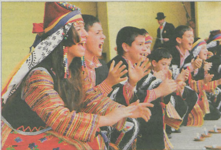
W dziesięciu edycjach spotkań folklorystycznych uczestniczyło 50 zespołów z Polski i 20 z Europy. Do tego grona w tym roku dołączył „Ihlas Koleji” ze Stambułu (Turcja)