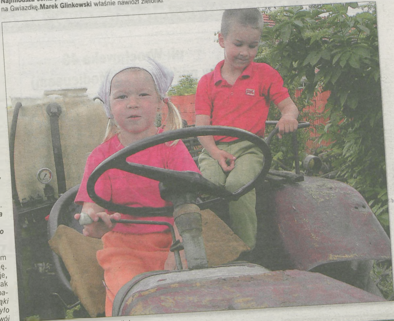
Dzieci najchętniej pozowały do zdjęć