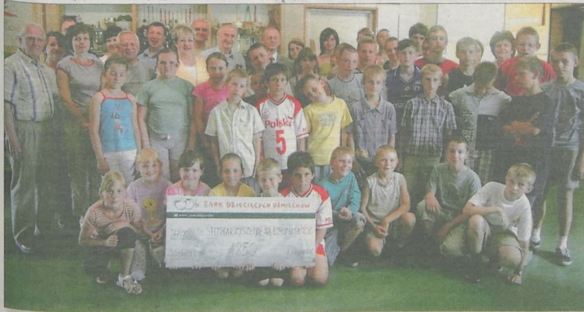
Uczestnicy półkolonii w Witaszycach z czekiem na 1.850 zł dofinansowania z Banku Zachodniego WBK

skiego BZ WBK i MGOPS-u (9.360 zł) półkolonie finansowane są ze środków Stowarzyszenia na Rzecz Witaszyc (ok. 4.000 zł)