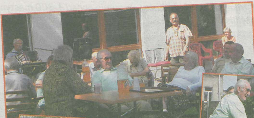
W czasie dwutygodniowych wczasów zorganizowano m.in. biesiadę w ogrodzie Centrum Socjalnego

Turnus „Wczasów pod lipami” w Centrum Socjalnym już po raz drugi zorganizowali Miejsko-Gminny Ośrodek Pomocy Społecznej w Jarocinie oraz zarząd rejonowy Polskiego Związku Emerytów Rencistów i Inwalidów. Pomoc finansową na organizację „półkolonii” dla osób starszych przekazało również stowarzyszenie „Jarocin - Veldhoven”. (Is)