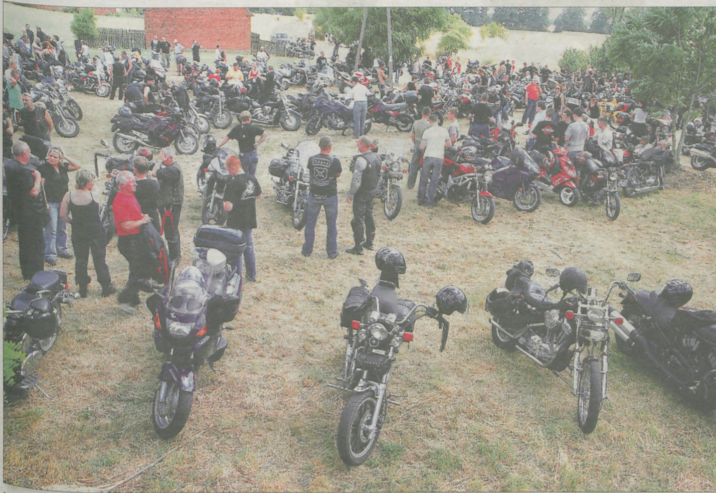
Motocykliści dotarli do Lgowa z całej Polski, a kilku nawet z Niemiec. Po kilkunastu minutach parking był już pełny.

Harleye, ścigacze, choppersy, trike, skutery i oldtimery - w sumie ponad 1.300 maszyn zjechało w niedzielę do Lgowa na mszę dla motocyklistów.