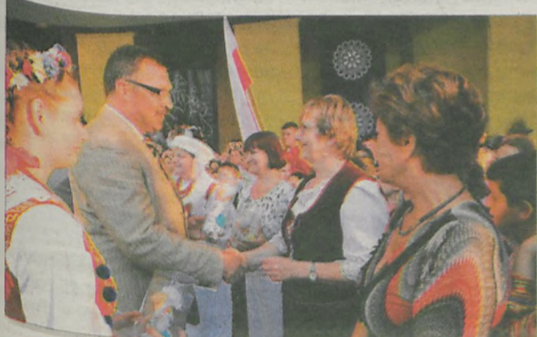
Kierownicy zespołów otrzymali upominki - pamiątkowe statuetki oraz lalki w strojach ludowych