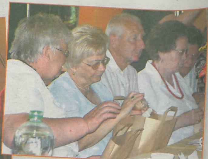
Upominki na zakończenie „Wczasów pod lipami” otrzymali wszyscy uczestnicy wypoczynku