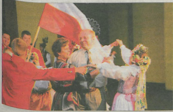
Na zakończenie koncertu finałowego wykonano pieśń „Ogniska już dogasa blask”, a potem na scenie amfiteatru zapanował prawdziwie międzynarodowy „chaos”