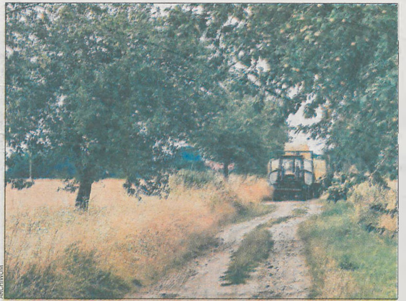
Czy rolnicy wiedzą, kiedy przysługują im odszkodowania?

Zasiłek macierzyński z tytułu urodzenia dziecka, a także z tytułu przyjęcia dziecka w wieku do jednego roku na wychowanie, przysługuje matce lub ojcu ubezpieczonemu w KRUS, jeżeli podlegali temu ubezpieczeniu przynajmniej przez rok przed porodem lub przysposobieniem. Do wynagane-