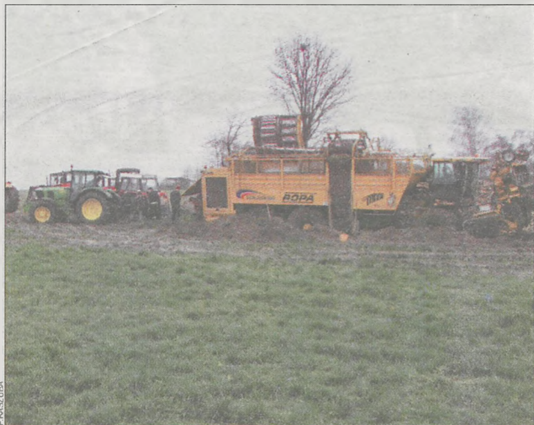
Rolnicy muszą sami organizować transport buraków do cukrowni

Pogoda nie sprzyja rolnikom. Widać zalane wodą pola z niewykopanymi jeszcze burakami cukrowymi. Wszyscy czekają na lepszą pogodę, aby dokończyć jesienne prace polowe.