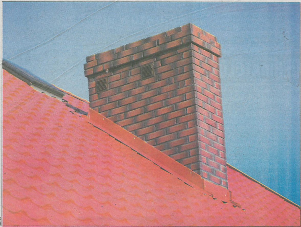
Wokół komina zakłada się w specjalnych bruzdach wyprofilowane kołnierze blaszane

Gdy komin jest wolnostojący, czyli stanowi konstrukcję samonośną, powinien być oddylatowany od stropu. Kiedy jest fragmentem ściany nośnej, można na nim opierać belki stropowe, ale powinno to być poprzedzone obliczeniami statycznymi. Wychodząc z kominem ponad dach, musimy to zrobić na wysokość zapewniającą właściwy ciąg. Na dachu o kącie nachylenia do 12 wylot komina powinien znajdować się co najmniej 60 cm ponad poziomem kalenicy budynku. Jeżeli dach ma większy kąt nachylenia niż 12 i pokryty jest materiałami łatwopalnymi (strzechy, gont drewniany), wyloty przewodów powinny znajdować się także minimum 60 cm powyżej poziomu kalenicy domu. Natomiast jeśli pokrycie dachu jest trudnopalne lub niepalne (dachówka bitumiczna, blacha, dachówka ceramiczna), wyloty przewodów mogą się znajdować