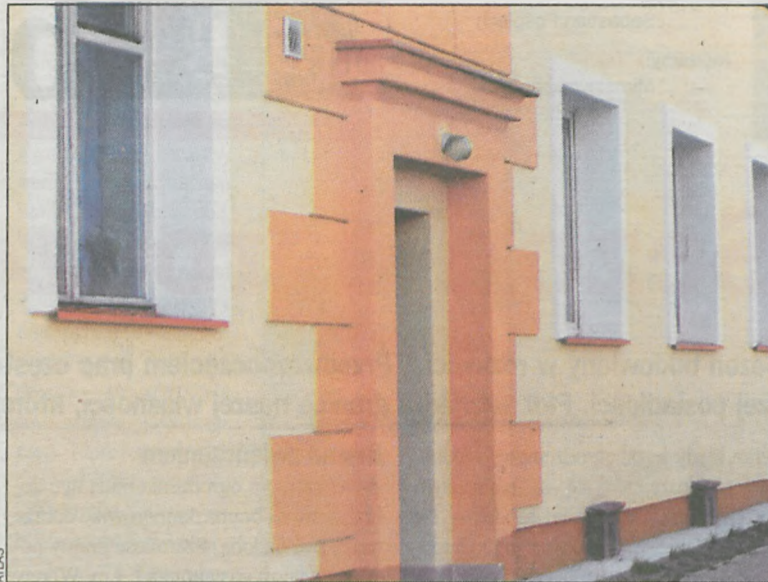
Decyzja o wyborze rodzaju tynku ma kapitalne znaczenie dla trwałości elewacji

Innym błędem projektanta jest zadysonowanie zbyt ciemnych kolorów tynku na ocieplanej elewacji. Tynki takie silnie się nagrzewają i podłoża pod nimi nie nadąża za odkształceniami, powstającymi od skoków temperatury. Dlatego, na elewacjach wyeksponowanych na działanie słońca, należy unikać stosowania tynków ciemnych.