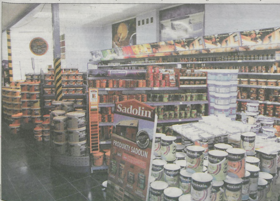
W studiu „Dekorall” przy ul. Rawickiej

na i są odporne na wilgoć. – Ceramika ma tę zaletę, że nie trzeba zegarmi-strzowskiej precyzji przy wykonywaniu ścian, co wymagane jest np. przy silika-tach i gazobetonach – tłumaczy kierow-