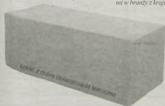
lekkie, z dobrą izolacyjnością termiczną