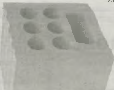
Cegła silikatowa – wytrzymała i łatwa w obróbce

ul. Rawicka 10 Krotoszyn tel. 62 722 65 55