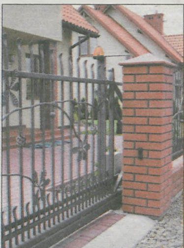
Brama z napędem firmy FAAC

Zwieńczeniem ogrodzenia musi być dobra, sprawna brama, która równie dobrze może być ozdobą. Szerokość bramy powinna wynosić co najmniej 2,4 m. Wbrew pozorom na wybór rodzaju bramy ma wpływ wiele czynników, m.in. szerokość działki. Na wąskiej działce nie zmontuje-