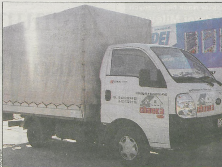
Towar z hurtowni „Chatka” dostarczany jest także własnym transportem