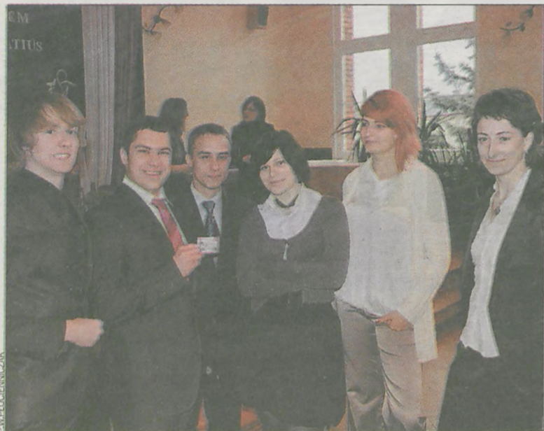
Maturzyści z krotoszyńskiego LO im. Kołłątaja tuż przed rozpoczęciem egzaminu