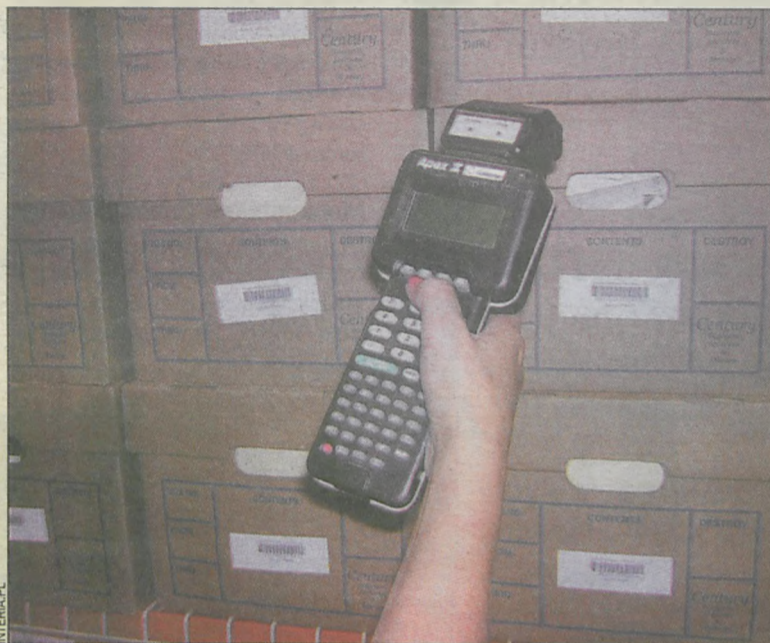
Podrabiał kody kreskowe, a potem podmieniał je w sklepie