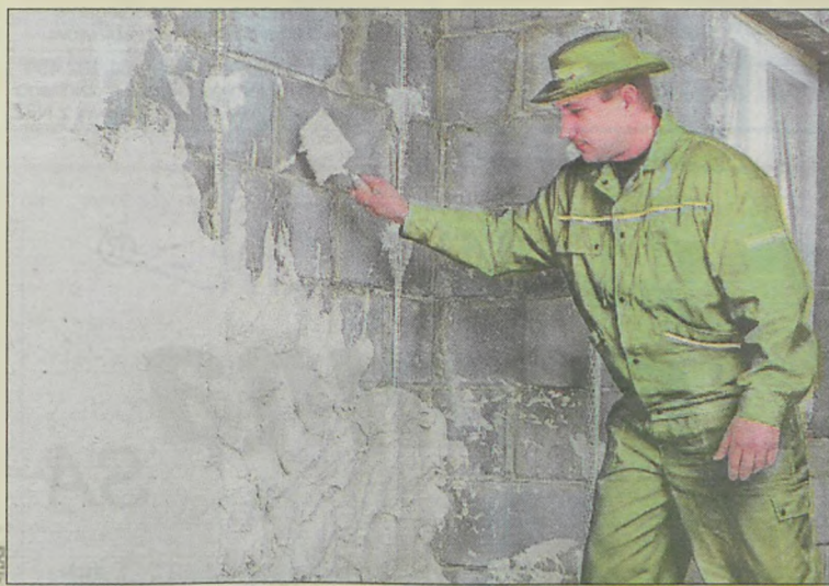
Tynk należy nakładać gładką pacą

Należy doświadczać ustalić maksymalną powierzchnię możliwą do położe-