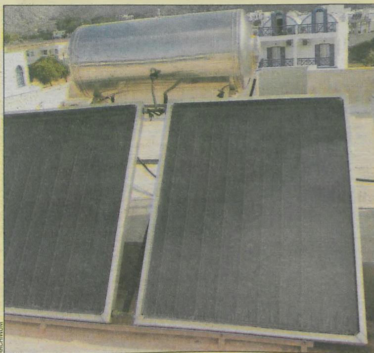
Kolektory słoneczne to najpopularniejszy sposób wykorzystania energii odnawialnej

czarne złoto i jego pochodne są najpopularniejszymi w okolicy. Najważniejszym plusem takiej instalacji są koszty. Zarówno zakup pieca, jak i jego eksploatacja, wymagają relatywnie niskich nakładów. Mimo iż sam opał staje się coraz droższy, tania eksploatacja rekompensuje wzrost cen. Ponadto piece na paliwo stałe mają jedną zasadniczą zaletę – pozwalają niedrogo i efektywnie ogrzewać budynki o dużej kubaturze oraz stare budownictwo, pozbawione odpowiedniej termoizolacji.