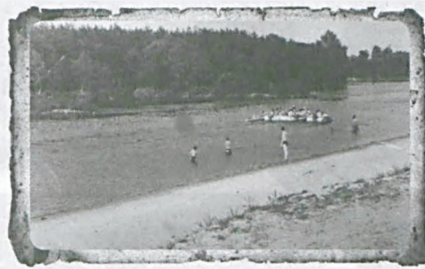
Plaża w Wiórku – lata 50.