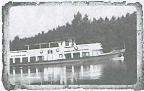
Dziwożona – lata 60.