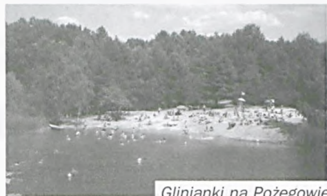
Glinianki na Pożegowie

Z pewnością wielu mosinian będzie chciało odwiedzić kąpielisko nad Jeziorem Jarosławieckim. Przez ostatnie lata legalna kąpiel w tym akwenu była niemożliwa, podobnie jak w innym popularnym jeziorze – Góreckim. W tym roku udało się jednak uzyskać zgodę na ponowne uruchomienie kąpieliska nad popularną „Jarochą”. Stało się tak dzięki wspólnej inicjatywie gmin zrze-