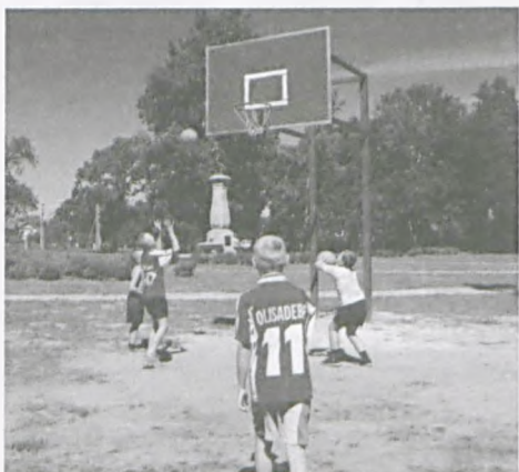
Nowe boisko przy pomniku "Siewcy"