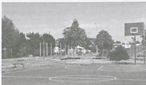
Na starym boisku nowe sprzęty zachęcają do sportu.