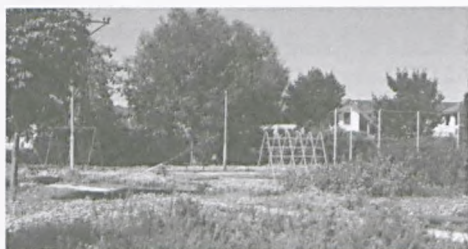
Wyremontowany plac zabaw w pobliżu ul. Poznańskiej