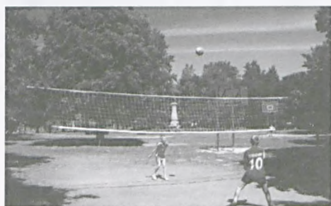
Przy "Siewcy" znalazło się miejsce do siatkówki