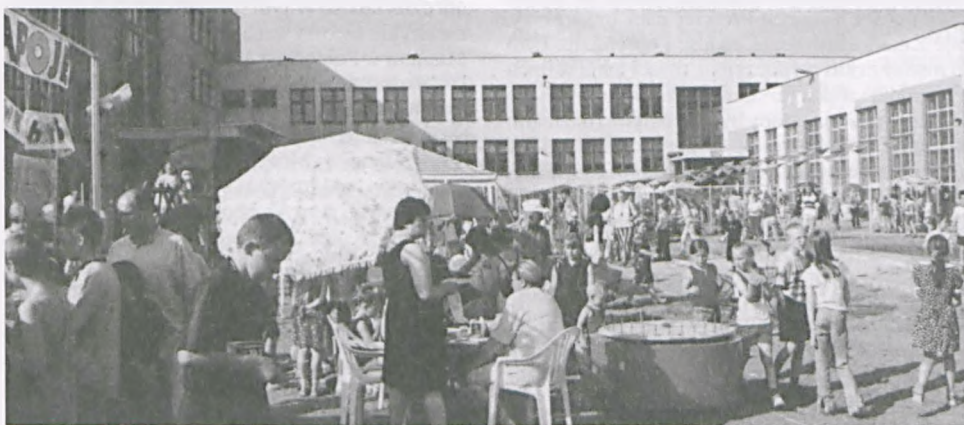
Festyn Rodzinny w Trójce