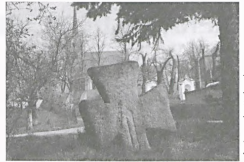
Wiatosów Dolny. Krzyż pokutny typu maltańskiego z rytem miecza lub pałki.

Sztuka ta jest wyjątkowa, co wynika z jej historycznego rozwoju zdeterminowanego geograficznym położeniem regionu i częstymi zmianami jego politycznej struktury oraz przynależności. Sztuka znajdowała się tu wciąż w polu oddziaływania impulsów płynących z