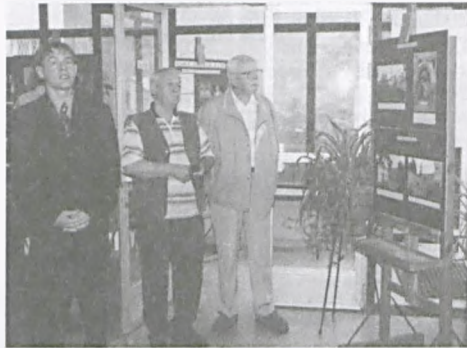
Wernisaż w holu Urzędu Miasta