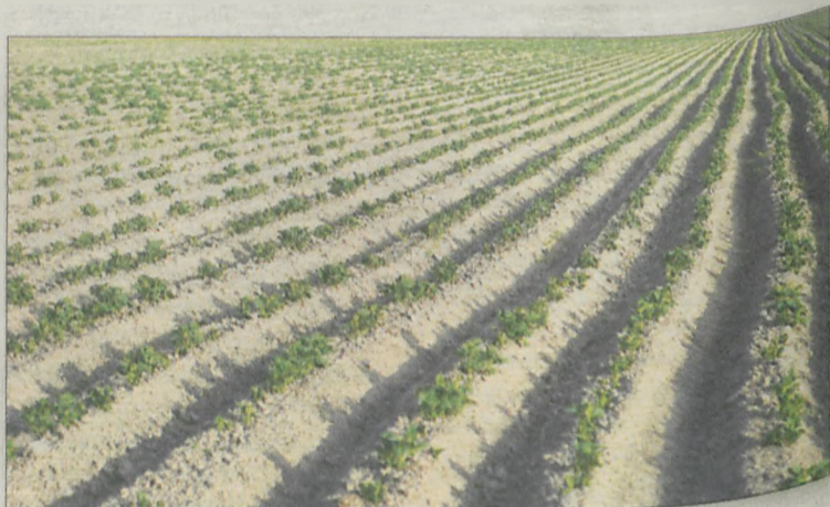
Doплата do ziemniaków wynosi 500 zł

Do 15 czerwca można składać wnioski o dopłaty do zużytego materiału siewnego kategorii elitarny lub kwalifikowany. Przyjmuje je Oddział Terenowy Agencji Rynku Rolnego w Poznaniu. Dotacją objęte są: zboża ozime (wysiane w okresie od 1 lipca do 30 listopada 2007 r.), zboża jare, rośliny strączkowe i ziemniaki.