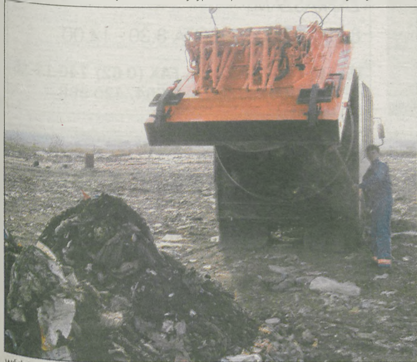
Wództwa wraz zażaleniem zostało przekazane do rozpoznania radzie miejskiej. Sprawą zajęła się komisja rewizyjna.

Właściciele do końca lutego nie mogli podnieść cen za wywóz.