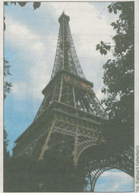
Umowy z biurami podróży zawierają wiele „kruczków” prawnych. Przed podpisaniem warto sprawdzić ich treść

Trzeba także zaznaczyć, że w przypadku niewykonania lub nienależytego wykonania umowy klient może żądać od organizatora wycieczki odszkodowania z tytułu szkody majątkowej i niemajątkowej. Odszkodowanie może obejmować na przykład zwrot opłat z tytułu zakwaterowania w hotelu o standardzie niższym niż ten, który został określony w umowie. Organizator imprezy turystycznej może się zwolnić od odpowiedzialności jedynie w przypadkach ściśle określonych w ustawie o usługach turystycznych, gdy szkoda jest wynikiem działania lub zaniechania klienta lub osób trzecich, nie-