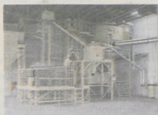
Linie wstępnego i dokładnego czyszczenia ziarna