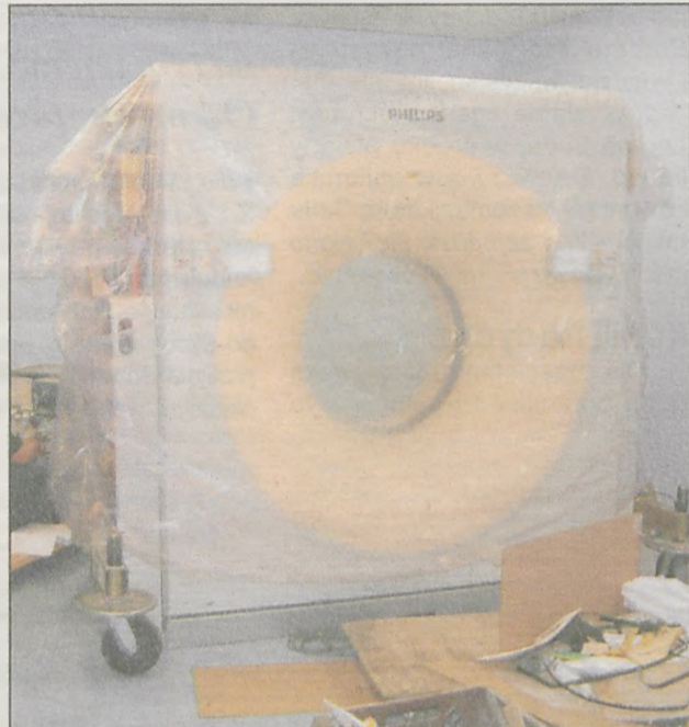
Od marca pacjenci jarocińskiego szpitala będą mogli korzystać z nowoczesnego, cyfrowego aparatu rentgenowskiego i tomografu komputerowego.

Tomograf komputerowy i cyfrowy aparat rentgenowski - sprzęt za ok. 3 mln zł montowany jest w jarocińskim szpitalu. - Są to jedne z najnowocześniejszych urządzeń. Jedną ze zmian, którą na pewno zauważą pacjenci jest to, że po wykonaniu zdjęcia rentgenowskiego nie będą otrzymywali tradycyjnej kliszy. Zdjęcie będzie na płycie CD do odczytu w komputerze - wyjaśnia Grzegorz Szymczak, dyrektor do spraw lecznictwa.