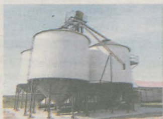
Linie technologiczne magazynów zbożowych

63-800 Gostyń, ul. Ogrodowa 6, tel. 065 5725090, 065 5720886, fax 065 5751765 biuro@zuptor.pl, www.zuptor.pl