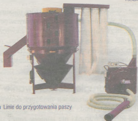
Linie do przygotowania paszy