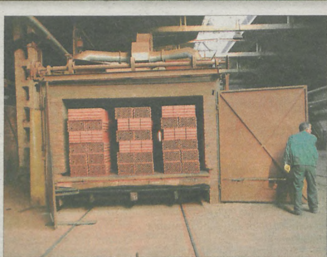
W TEJ FABRYCE miesięcznie produkuje się 6 tysięcy ton cegły.