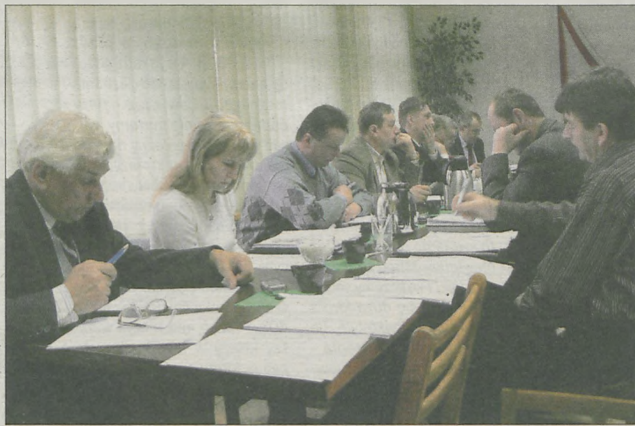
Mimo wątpliwości co do nowych opłat radni jednomyślnie przyjęli nowe stawki.