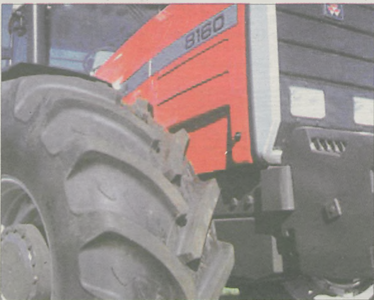
NAJCZĘŚCIEJ ZA UNIJNE PIENIĄDZE rolnicy kupowali nowoczesne maszyny rolnicze

Operacyjnego „Restrukturyzacja i modernizacja sektora żywnościowego oraz rozwój obszarów wiejskich” na lata 2004-2006. Z dofinansowania realizowanych inwestycji w gospodarstwach rolnych skorzystało w sumie ponad 20 tys. rolników - wymienia Radosław Iwański, rzecznik prasowy ARiMR.