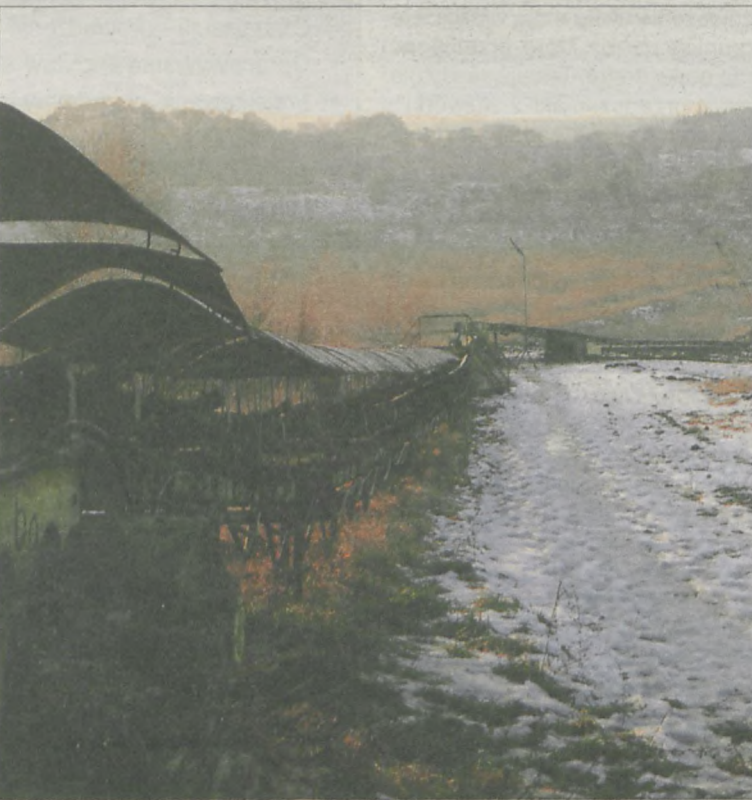
CEGIELNIA eksploatuje własną kopalnię surowców ceramicznych.