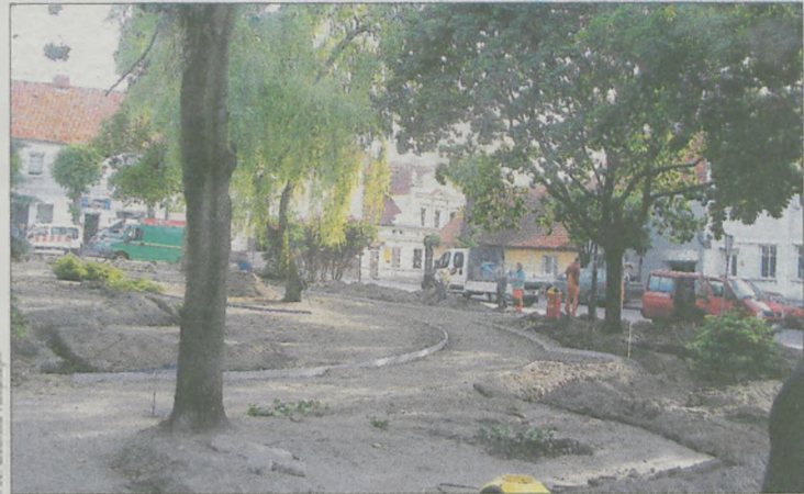
W TEJ CHWILI W CENTRUM RYNKU montowane jest specjalne nawodnienie i odnawiane chodniki

Nowy ma być też deptak wokół zieleni. - Wymieniamy