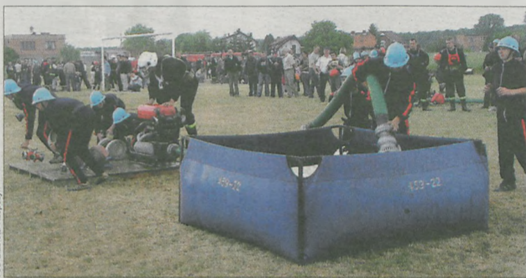
W ZAWODACH wystartowało 31 ekip