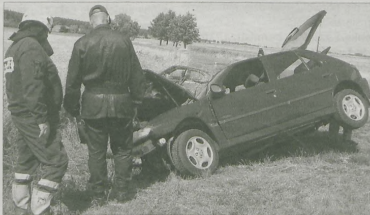
W PEUGEOTA 306 uderzył kierujący nubią