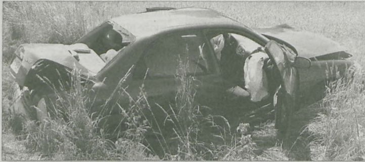
DAEWOO NUBIRA zatrzymała się w polu

Dwie osoby w szpitalu, dwa rozbite auta, kilka tysięcy złotych strat - to bilans poniedziałkowego wypadku w Żerkowie. Kierujący daewoo nubią wymusił pierwszeństwo.