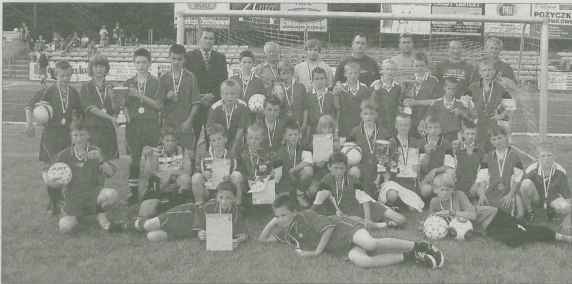
TRZY NAJLEPSZE DRUŻYNY II Memoriału im. Macieja Udzika

Drużyna ze Szkoły Podstawowej w Klęce zwyciężyła w II Memoriale im. Macieja Udzika. W finałowym pojedynku chłopcy z Klęki zdecydowanie pokonali 4:0 ubiegłorocznych zwycięzców - zespół SP z Witaszyc.