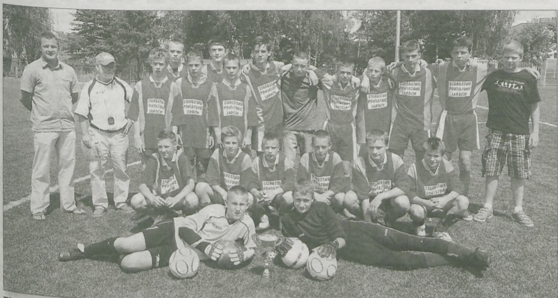
TRAMPKARZE MŁODSI JAROTY JAROCIN zajęli drugie miejsce w Wielkopolsce

Trampkarze młodzi Jaroty Jarocin zajęli drugie miejsce w finale wielkopolskim turnieju Nike Premier Cup 2008. W zawodach wzięły udział najlepsze zespoły z okręgowych związków naszego województwa.