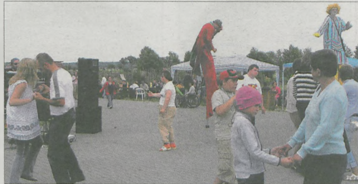
UCZESTNICY PIKNIKU podziwiali występy szczudlarzy

Wielkopolskiej, Gozdowa, Raszew, Powiatowego Ośrodka Wsparcia z Noskowa oraz Stowarzyszenia „Płomień Nadziei” z Nowego Miasta. W pikniku wzięli także udział sponsorzy i przedstawiciele