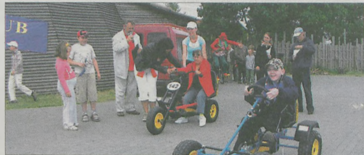
NAJMŁODSI CHĘTNIE brali udział w wyścigach na gokartach

Blisko 500 osób bawiło się na Pikniku Rekreacyjno-Kulturalnym w Radlinie. Były to głównie osoby niepełnosprawne oraz ich opiekunowie i rodziny z terenu powiatu średzkiego, jarocińskiego i wrzesińskiego. Dla uczestników zabawy przygotowano przejażdżki bryczkami, gokartami, występy szczudlarzy, strzelanie z łuku oraz spektakl interaktywny. Najmłodszy ustaliali się do malowania twarzy i włosów. Oblegali dmuchany zamek i trampolinę.