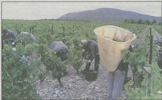
Pracę we Francji można znaleźć na przykład przy zbiorze winogron

We Francji najbardziej poszukiwani są pracownicy służby zdrowia, handlowcy, specjaliści bankowości i ubezpieczeń, księgowość, menedżerowie wysokiego szczebla oraz pracownicy budowlani. Warto podkreślić, że osoby te, aby łatwiej było znaleźć im pracę, powinny znać przynajmniej język angielski. Jeśli jed-