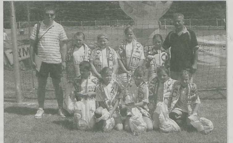
ZWYCIĘZCZYNI FINAŁU WIELKOPOLSKIEGO TURNIEJU „Z podwórka na stadion” - Wilczki Wilkowyja

Dwie drużyny reprezentujące Ziemię Jarocińską zdominowały rywalizację w finale wielkopolskim turnieju „Z podwórka na stadion” o Puchar Tymbarku (rocz. 1998 i młodsze). W zawodach rozgrywanych