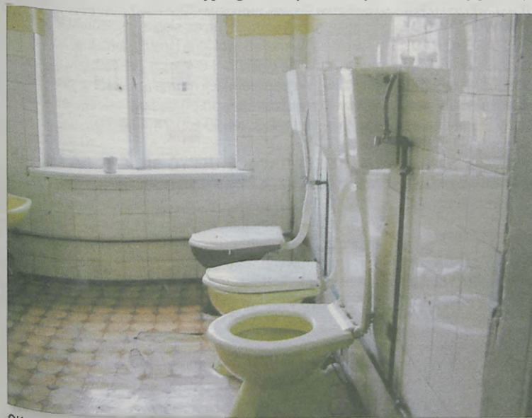
OKOŁO 30 TYS. ZŁ ma kosztować remont sanitariatów w jaraczewskim przedszkolu