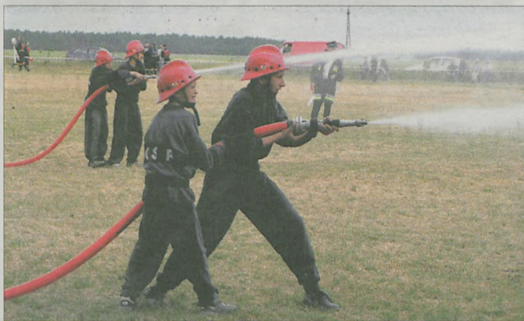
TRADYCYJNIE DRUHOWIE RYWALIZOWALI w ćwiczeniu bojowym