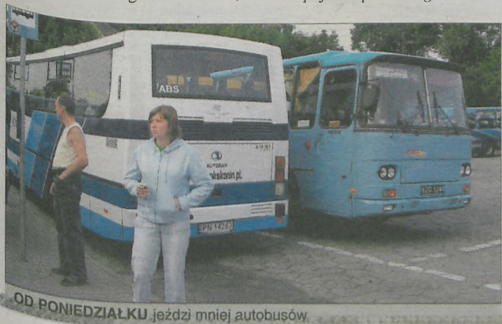
OD PONIEDZIAŁKU jeździ mniej autobusów