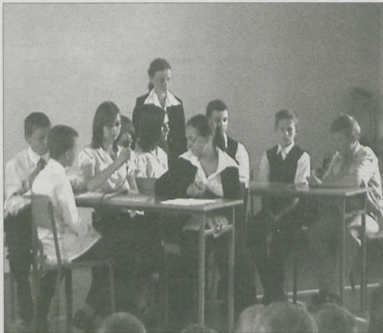
UCZNIOWIE KLAS VI w czasie występu w Łuszczanowie