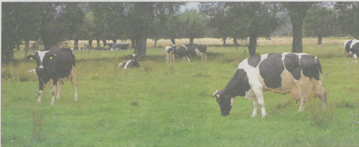
DOPLATY po raz pierwszy dostaną rolnicy, którzy posiadają pastwiska i łąki oraz trawy na gruntach ornych

301 zł wynosi tegoroczna dopłata bezpośrednia do jednego hektara. Pieniądze Agencja Restrukturyzacji i Modernizacji Rolnictwa wypłacać będzie już od 3 grudnia. Zgodnie z przepisami, rolnik dopłatę musi otrzymać najpóźniej do końca czerwca 2008 roku.