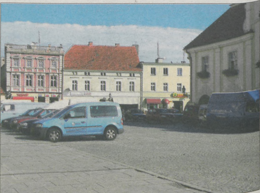
W miniony czwartek około godziny 13.00 naliczyliśmy 16 zaparkowanych aut