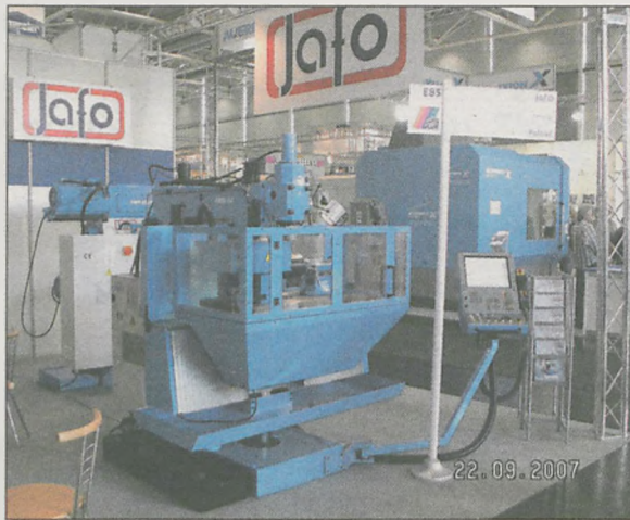
Na targach w Hannoverze Jarocińska Fabryka Obrabiarek wystawiła swoje najnowsze produkty.