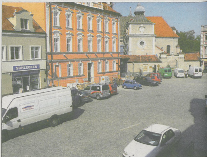
Jarociński rynek w czwartek 20 września