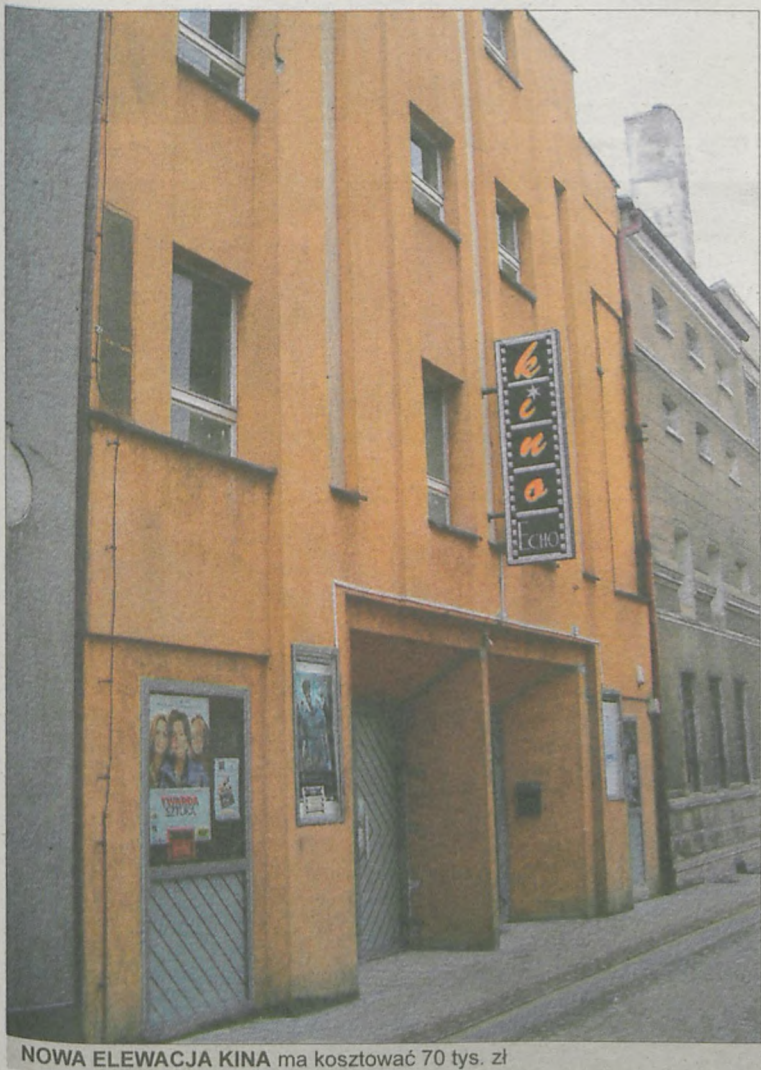
NOWA ELEWACJA KINA ma kosztować 70 tys. zł