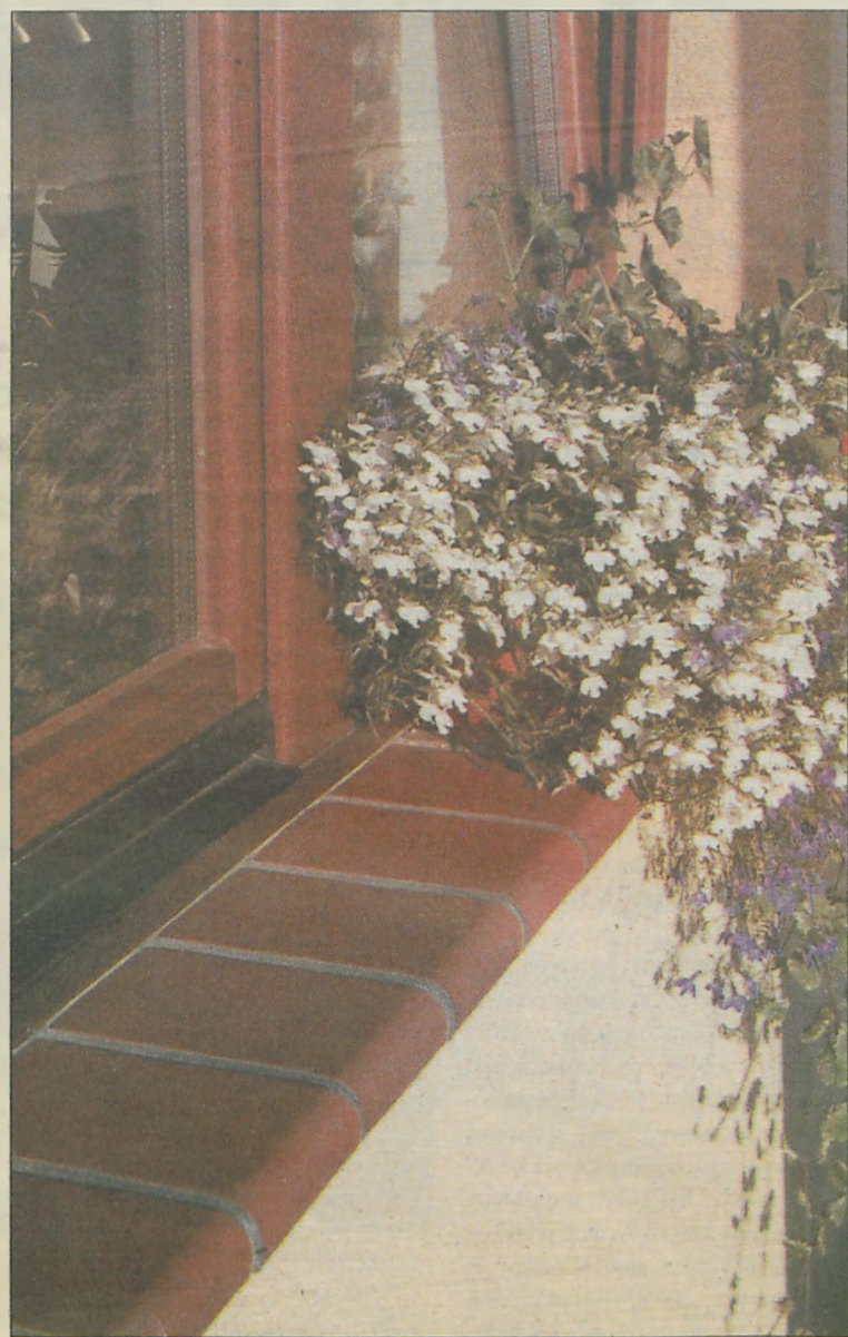
Parapety z klinkieru są trwałe i praktyczne

my parapet, musi być czyste. Jeżeli kłaść będziemy płytki klinkierowe, można je zagruntować emulsją gruntującą, zwiększającą przyczepność, poprawiającą elastyczność, regulującą proces chłonności podłoża.