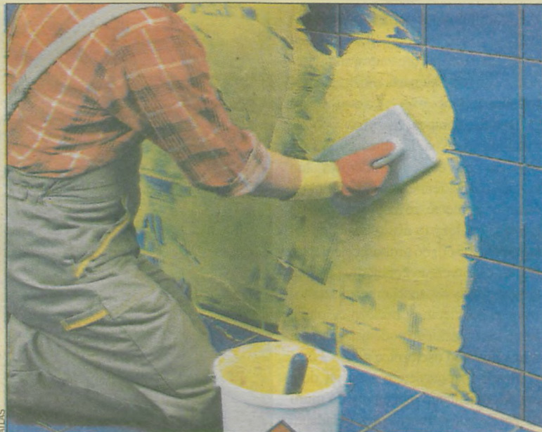
Fugowanie można rozpocząć po upływie co najmniej doby od przyklejenia płytek

Miejsca, w których stykają się różne powierzchnie – np. krawędzie ścian, połączenia ścian z posadzką oraz spoiny przy urządzeniach sanitarnych (m.in. wokół wanien, brodzików, umywalk) należy wypełniać uszczelniaczem silikonowym. Jest on odporny na działanie pleśni i grzybów, dlatego zaleca się stosować go w łazienkach, prysznicach, kuchniach, pralniach oraz w innych pomieszczeniach