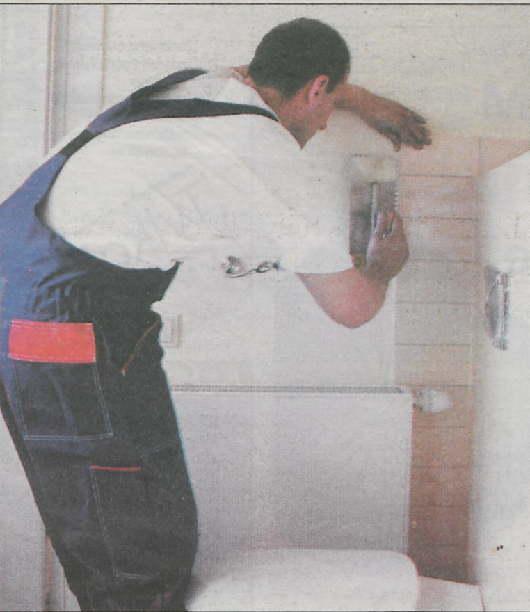
Brakuje fachowców z prawdziwego zdarzenia