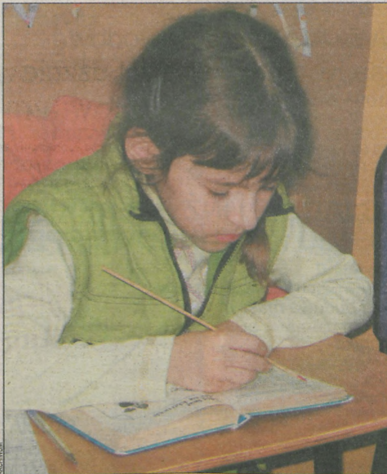
Warto zaczynać od najmłodszych lat

Coraz bogatsza oferta, jaką proponują krajowe szkoły językowe, pozwala wysnuć wniosek, że Polacy bardzo chcą dorównać pod względem umiejętności porozumiewania się swoim zachodnim sąsiadom. Otwarcie granic