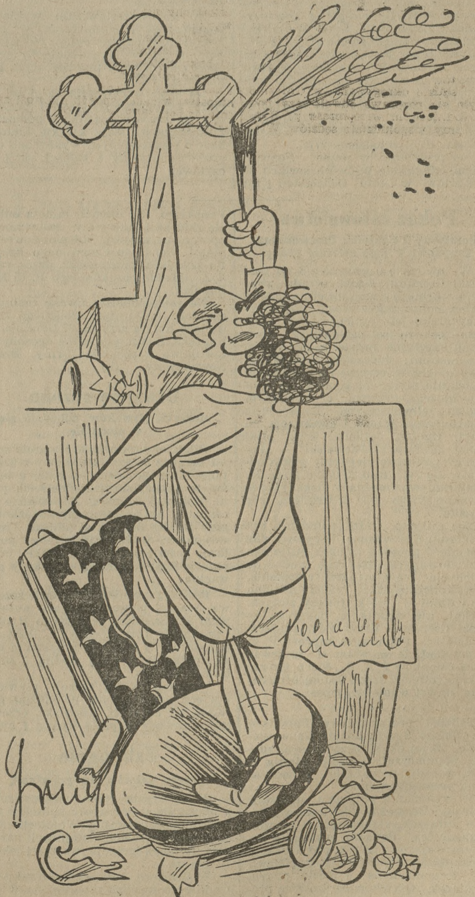
Katolicycy Żydzi w Hiszpanji.

Młodzież Wszechpolska i grupa akademicka Obozu Wielkiej Polski urządza w sobotę, dnia 16 b. m. o godz. 20,15 w sali Królowej Jadwigi (Al. Marcinkowskiego).