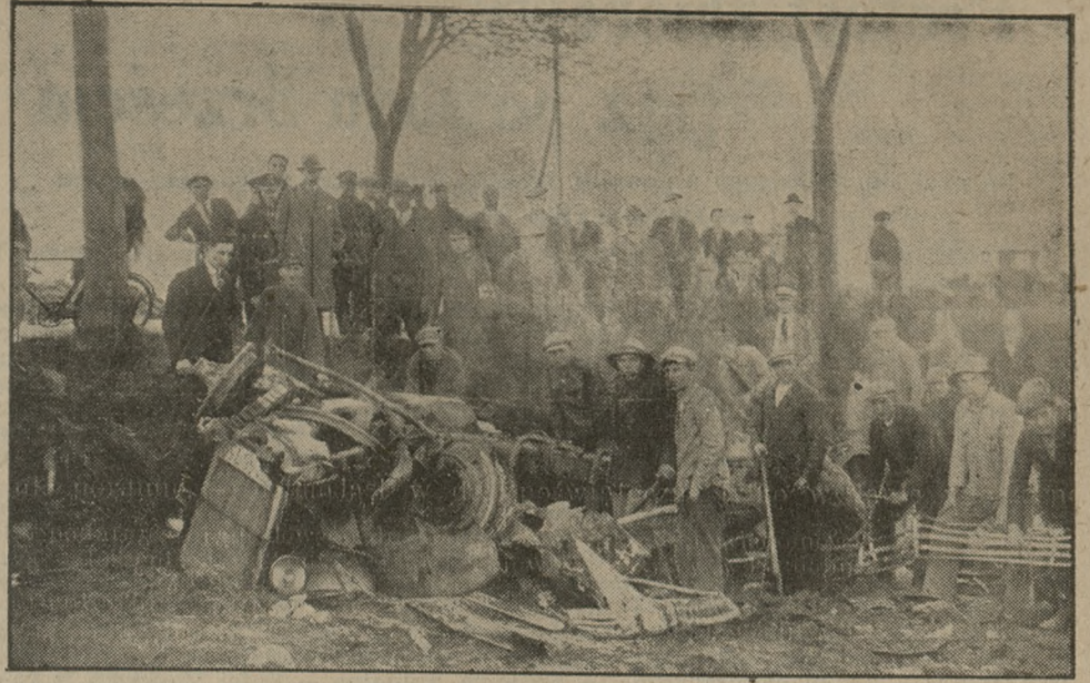
W środę, 13 b. m. popołudniu wydarzyła się na linii Nakło — Sadki straszna katastrofa autobusowa. Skutkiem pęknięcia opony, autobus uległ zupełnemu zniszczeniu. Szereg osób, znajdujących się krytycznej chwili w autobusie, odniosło rany z poparzenia; rannych odwiozło Pogotowie do szpitala w Wyrzysku. Autobus był ubezpieczony. Zdjęcie powyższe przedstawia nam obraz katastrofy.

Otóż wydłużanie się gałęzi rozpoczyna się w maju, w czerwcu osiąga swe maksimum, a w lipcu ustaje. Wydłużanie to odbywa się niejednako w różnych porach dnia, słabsze jest nad ranem aniżeli po południu, a nawet przed wieczorem, natomiast około 20 godziny ustaje zupełnie, by znów się rozpocząć dopiero ze wschodem