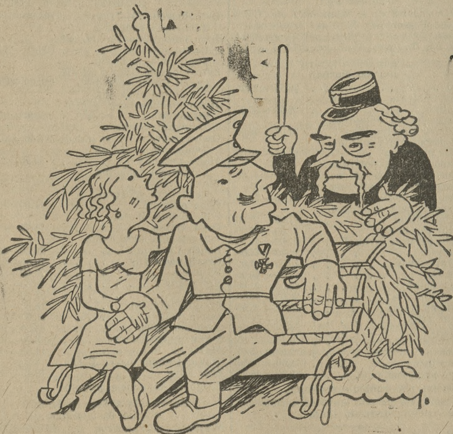
Grzeczny policjant Briand: No proszę się trochę rozejść, miłi Kochankowie!