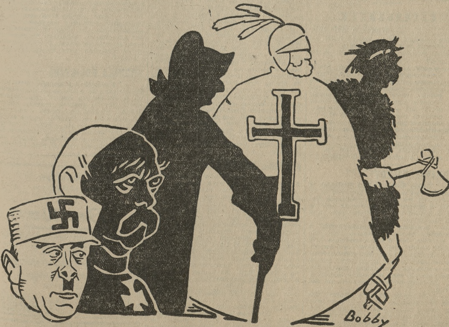
Zniesienie ustawy likwidacyjnej z Niemcami. Odwieczny Drang nach Osten.

Kair, 5. 5. (Tel. wł.) Rozruchy w Egipcie zaczynają przybierać coraz szersze rozmiary. W czasie walk ulicznych w Benifué padło ogółem 4 zabitych i 40 rannych. Wojsko i policja w całym Egipcie są w ostrym pogotowiu. Ludność z rozgoryczeniem komentuje świeże wypadki w Benifué, przypisując całą winę niesłychanym wystąpieniom policji, która z bronią w ręku przeciwstawiała się demonstrującym przeciwko rządowi. Ogólnie oczekuje się interwencji Anglii.