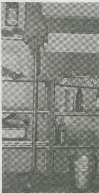
Tak dbają o swoje kluby i świetlice mieszkańcy niektórych wsi

Czy istnieje szansa na ożywienie działalności kulturalnej w środowisku wiejskim? Optymiści, do których należy Śremski Ośrodek Kultury, uważają, że tak. Zależy to jednak będzie od stopnia zaangażowania się wszystkich instytucji i organizacji, które w swoich statutowych zapisach mają obowiązek działania na rzecz wsi. Opracowany program poprawy działalności kulturalnej na terenie gminy przewiduje utworzenie czterech Wiejskich Ośrodków Kultury — filii Śremskiego Ośrodka Kultury (Wyrzeczka, Krzyżanowo, Dąbrowa, Pyszczka). W filiach tych powinien być zatrudniony etatowy pracownik, który koordynowałby działalność kulturalną podległego terenu. W połączeniu z istniejącymi filiami Biblioteki Publicznej Miasta i Gminy dałoby to możliwość większego oddziaływania kulturalnego na środowisko. Podjęto starania o uzyskanie dodatkowych etatów i środków finansowych na remont i wyposażenie filii. Istotny problem stanowi również kadra i działacze społeczni, bez których niemożliwe jest prowadzenie działalności kulturalno-wychowawczej. Dlatego też od 15 listopada br. przy Śremskim Ośrodku Kultury rozpoczął działalność pierwszy w województwie poznańskim Niedzielny Uniwersytet Ludowy . Powołano go do życia wspólnym wysiłkiem SOK i Biura Rejonowego ZMW w Śremie. Opracowany program Niedzielnego Uniwersytetu Ludowego realizowany będzie od listopada do marca podczas jedno i dwudniowych spo-