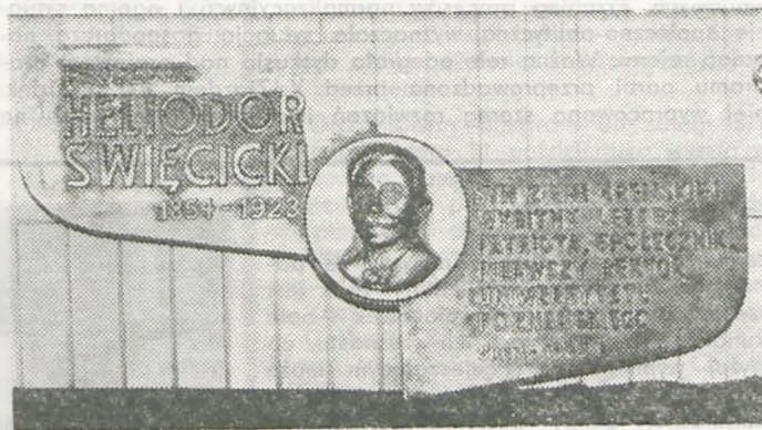
Fot. Tablica pamiątkowa z okazji nadania Bibliotece imienia Heliodora Święcickiego wg projektu E.A. Ferstera.

Zdaję sobie sprawę, że to zaledwie krótki rys historyczny dotyczący działalności bibliotek na Ziemi Śremskiej, o których tak