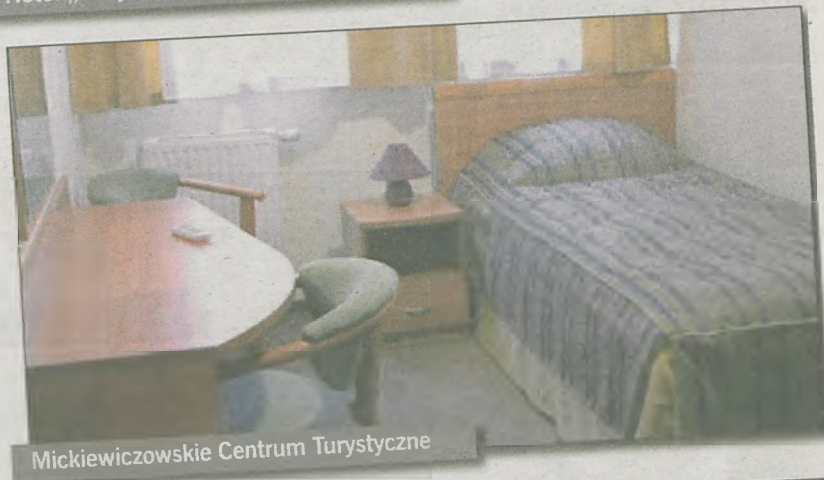
Mickiewiczowskie Centrum Turystyczne