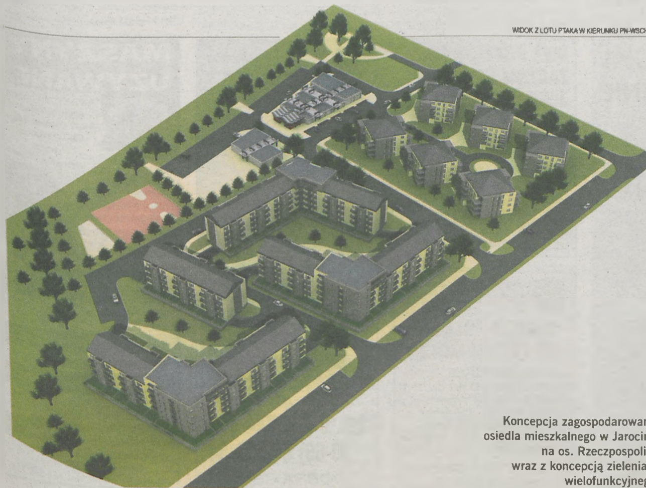
WIDOK Z LOTU PTAKA W KIERUNKU PN-WSCH.

Koncepcja zagospodarowania osiedla mieszkalnego w Jarocinie na os. Rzeczpospolitej wraz z koncepcją zieleniaka wielofunkcyjnego.