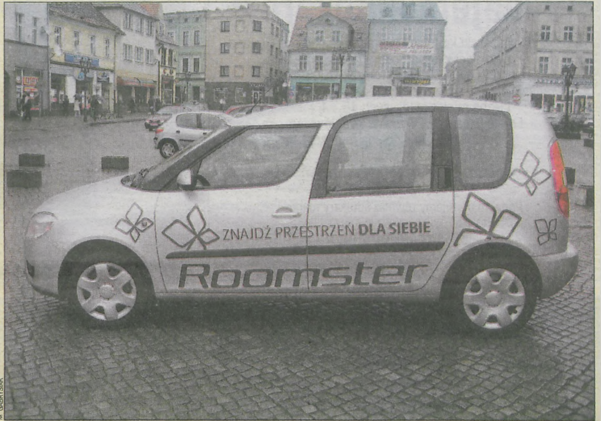
Roomster może zabrać pięć osób i sporo ładunku

padku zwiększającą się aż do 1700 l. Bagażnik został starannie przemyślany i można w nim znaleźć m.in. praktyczne siatki trzymające bagaż, nie pozwalające mu na przesunięcia, chroniące przed uszkodzeniami. Poza tym w bagażniku zamontowano chowane haczyki na torby z zakupami. Bardzo ciekawy jest system tylnych foteli o nazwie VarioFlex , po-