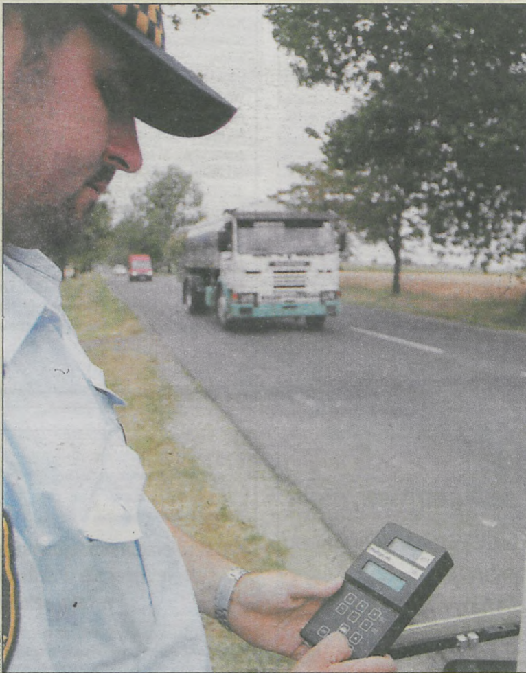
Fotoradar krotoszyńskiej straży na ul. Kobylińskiej

Dotychczasowe korzystanie z fotoradarów przez straż miejską w całym kraju odbywało się na podstawie rozporządzenia wydanego kilka lat temu przez Ministerstwo Spraw Wewnętrznych i Administracji. Dla samorządów było źródłem dodatkowych dochodów,