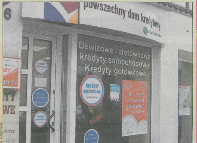
Biuro kredytowe w Krotoszyń

Nie ma to znaczenia. Nie liczy się nawet to, czy osoba ubiegająca się o taki kredyt ma uregulowany stosunek do służby wojskowej.