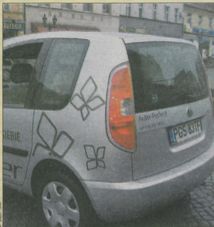
Tył auta podkreślają duże światła

Dziękujemy Ryszardowi Bronicowi z firmy Auto Perfect w Gostyniu za udostępnienie auta do testów.