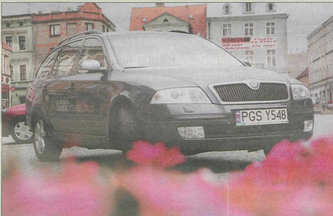
Kusicielka na krotoszyńskim Rynku

Nowa skoda octavia combi jest bezpieczna, wygodna, bogato wyposażona, a jazda nią sprawia wielką przyjemność. Auto z silnikiem 1,6 FSI zapewnia moc, dynamikę i oszczędność zarazem. Po prostu kusi!