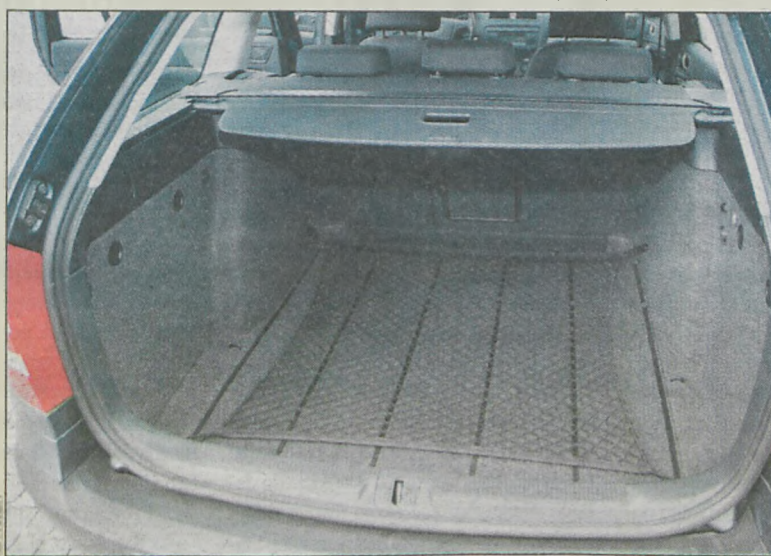
Pasażerowie na pewno nie będą musieli siedzieć na walizkach

dy testowej sami mogliśmy się o tym przekonać. Auto zachowuje się bardzo stabilnie na drodze. Sprawdzaliśmy je