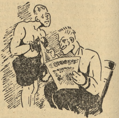
Bokserzy między sobą: — Popatrz, pisza, że urodziło się dziecko o trzech rękach! — Co za wspaniałe możliwości będzie miało w boksie.

W Rzymie rozegrany został między państwowy mecz tenisowy pomiędzy reprezentacjami Włoch i Szwecji, które zakończyło się zdecydowanym zwycięstwem gospodarzy w stosunku 4:1. (i)