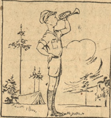
Świta nad lasem świat budzi się z nocy Harcerskiej trabki roznoszą się tony Tytu w pobudzie młodzieńczej jest moca Ze zwawo wstaje najbardziej uspijony.

Po wieczornej pieśni zamiera życie obowozowe i wszyscy udają się na spoczynek.