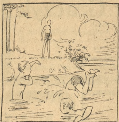
Lecz czas do rzeki by zażyć kąpiel Tam ci dopiero harce i zabawa Gdybyż nieszczęśliwy już napród wiedzieli Jaka na rzecz rozegra się sprawa!