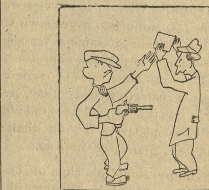
Pieniądze albo „WIECZÓR”

pozbawiając go jednocześnie wszystkich praw obywatelskich i honorowych. Całe imię skazanego zostaje skonfiskowane na rzecz Skarbu Państwa.