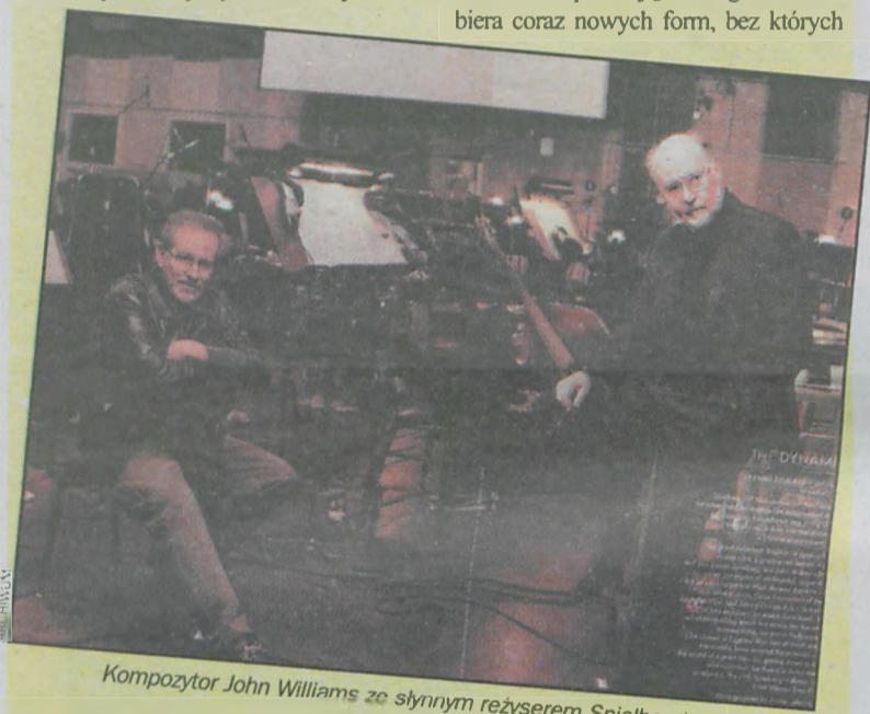
Kompozytor John Williams ze słynnym reżyserem Spielbergiem

Są piosenki, które sprawiły, że filmy stały się niezapomniane. Bez nich obraz byłby dużo uboższy. Kontemplacyjne Sound od silence , pięknie podsumowujące metamorfozę Dustina Hoffmana w Absolwencie , szatan śpiewający piosenkę Franka Sinatry w Adwokacie diabła , Dancing Queen w Weselu Muriel , smutne Yesterday w Dawno temu w Ameryce . Piosenki te sprawiają, że magia kina nabiera coraz nowych form, bez których