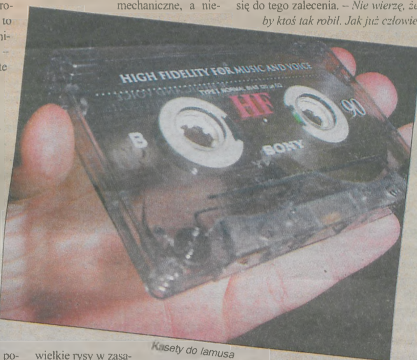
Kasety do lamusa

nie plików w formacie MP3 jest nielegalne tylko na dłuższą metę. Można, bowiem legalnie odsłuchiwać ściągniętą muzykę u siebie w domu przez 24 godziny, a następnie wykasować go z dysku. Jak wiemy jest to tylko pobożne życzenie, ponieważ niewiele osób stosuje się do tego zalecenia. – Nie wierzę, żeby ktoś tak robił. Jak już człowiek