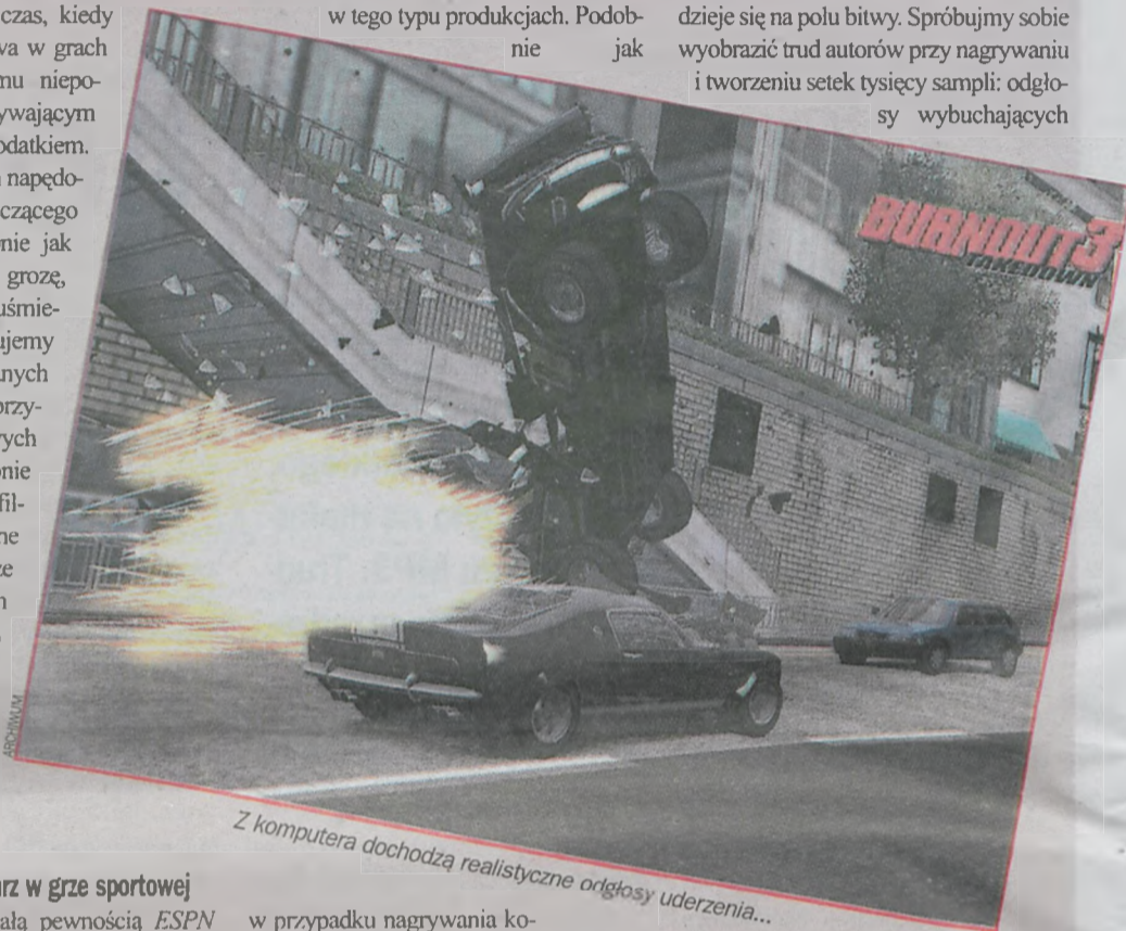
Z komputera dochodzą realistyczne odgłosy uderzenia...

dzieje się na polu bitwy. Spróbujmy sobie wyobrazić trud autorów przy nagrywaniu i tworzeniu setek tysięcy sampli: odgłosy wybuchających