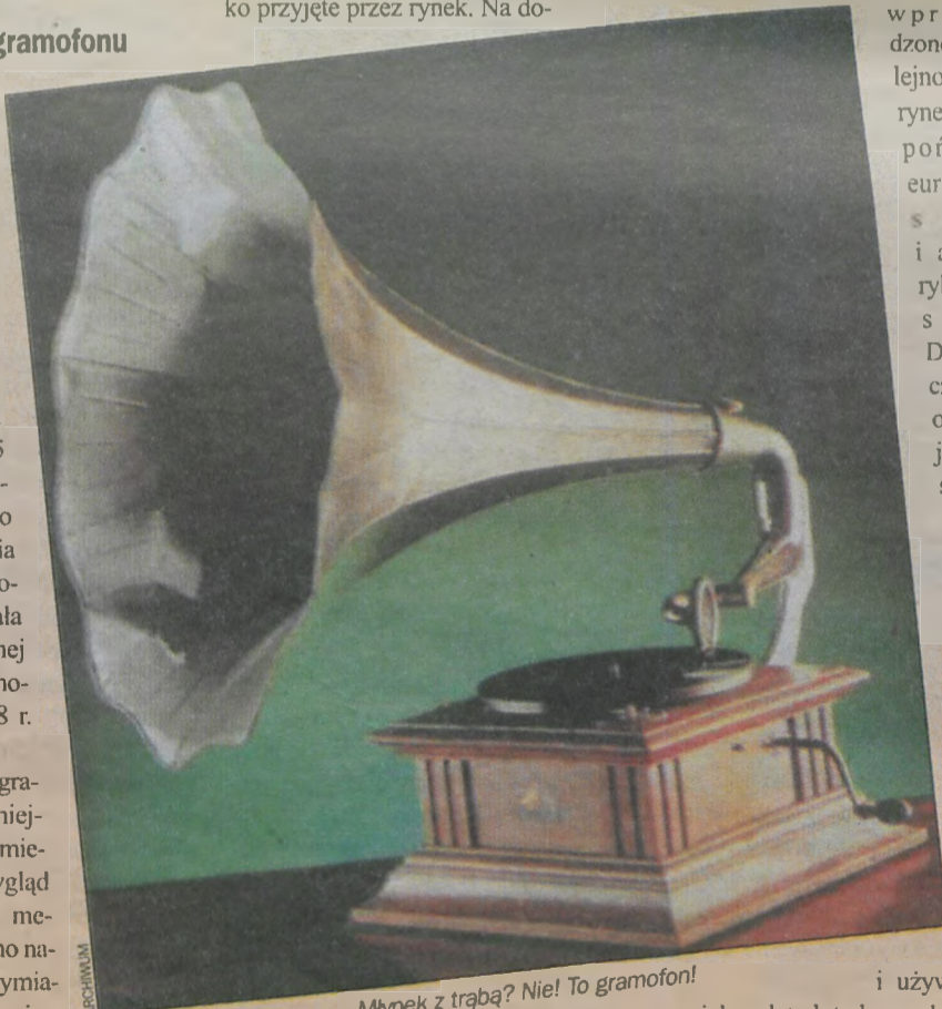
Młynek z trąbą? Nie! To gramofon!

bre w Polsce magnetofony zdomowały się dopiero pod koniec lat 80. Kasetka zyskała powszechne uznanie i w wielu domach szybko pojawiły się